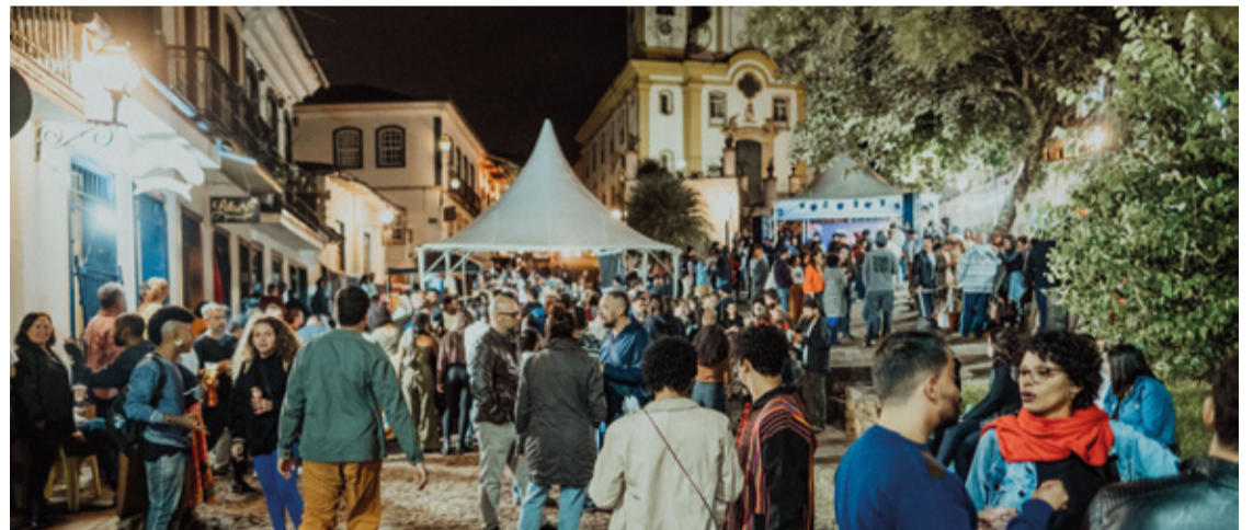
Oferecendo oficinas de arte e ampliando conexões, FAOP realizará última edição do projeto “Sextas Abertas” dia 22/11.

As oficinas artístico-culturais e gastronômicas acontecem no bairro Antônio Dias, em sua maioria, geralmente na sede do Núcleo de Arte e Ofícios da FAOP, que funciona no Casarão Pedro Aleixo, uma casa ampla erguida no século XIX, que oferece ambientes variados, incluindo pátios abertos e ateliês de linguagens artísticas diversas. Para aproveitar as belezas de Ouro Preto, algumas práticas se estendem por fora da casa.