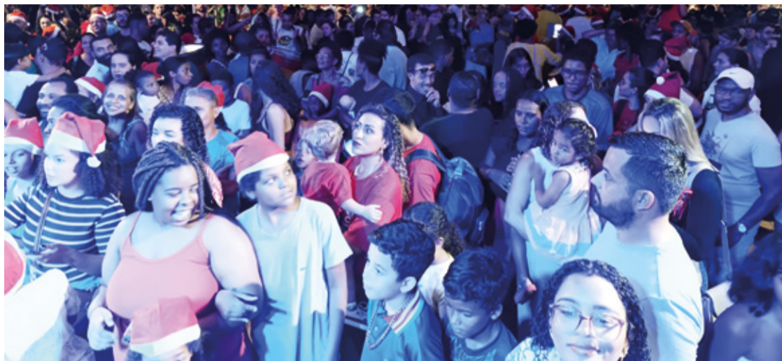
Natal de Luz com tema “Luzes, Encantos e Histórias” deixa população entusiasmada com Natal.

Da árvore ao presépio, a cidade se encontrará enfeitada até o mês de janeiro, deixando assim, Mariana enfeitada e colorida durante muito tempo. A Praça da Sé, Praça Gomes Freire, Rua Direita, Praça Minas Gerais e Rua Padre Gon-