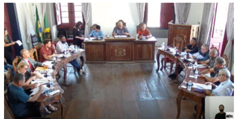
Os projetos realizados foram recebidos parecer contrário da Comissão de Finanças, o que motivou o debate entre os vereadores.

O resultado desse impasse deve ser decidido até o final do mês, enquanto a população de Mariana aguarda o desfecho de mais um capítulo da política local, marcado por disputas e diferentes visões sobre a responsabilidade fiscal e as prioridades do município.