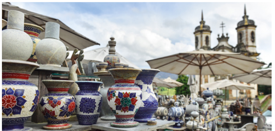
O Cria.Forma integra o programa "Rotas do Conhecimento", que visa desenvolver a capacitação para as áreas de Turismo e Cultura.