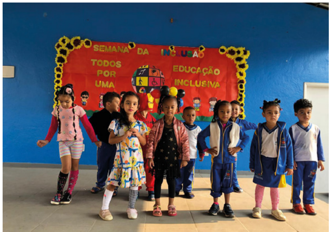
Evento nas escolas de Mariana promove a inclusão e acessibilidade no ambiente escolar.

A Semana da Inclusão reafirma o compromisso de Mariana com a educação inclusiva, visando garantir que todos os alunos tenham acesso a um ensino de qualidade, respeitando suas individualidades e promovendo uma sociedade mais inclusiva e empática.