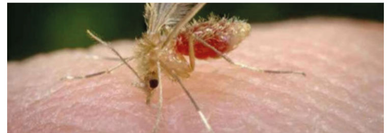
O estado realiza ações intensivas para identificar e controlar a transmissão.

A leishmaniose tem duas formas principais: visceral (LV) e tegumentar americana (LTA). A LV afeta órgãos internos, como fígado e baço,