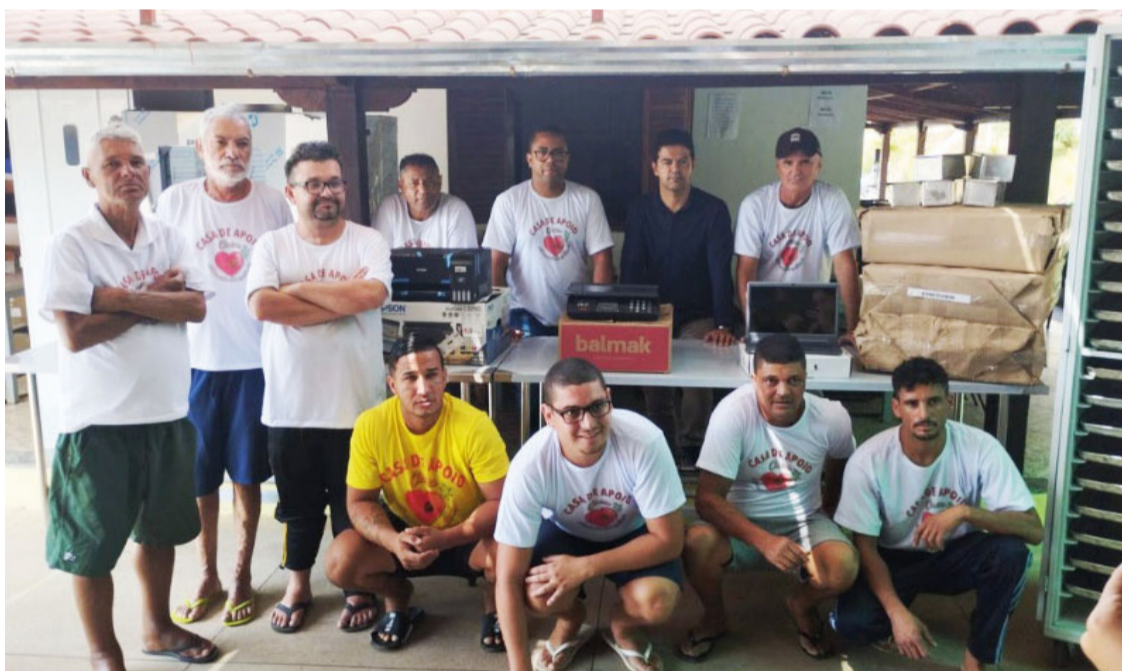
Através de uma emenda parlamentar, a Casa Semente do Amor conseguiu adquirir equipamentos essenciais para a futura padaria da entidade.