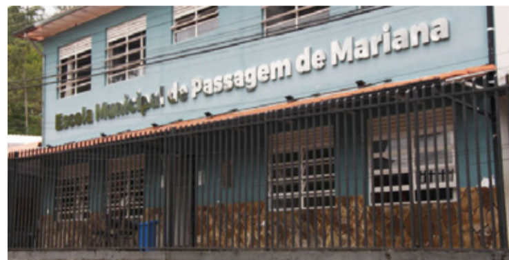
A área desapropriada será destinada à construção de novas salas de aula e instalações na Escola Municipal Passagem de Mariana.

A necessidade de ampliar a Escola Municipal Passagem de Mariana tem sido apontada como urgente devido ao aumento da demanda por vagas e à necessidade de proporcionar um ambiente mais adequado e moderno para os estudantes. A atual estrutura da escola já não comporta o número crescente de alunos, o que motivou a busca por alternativas que incluíssem a expansão física do