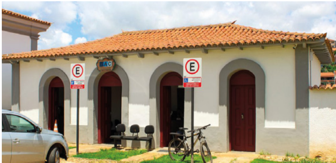
A unidade marianense comporta 40 atendimentos diários, por não haver mão de obra qualificada, que necessita de curso de identificação pela Polícia Civil.

Além disso, a unidade marianense comporta 40 atendimentos diários, por não haver mão de obra qualificada, que