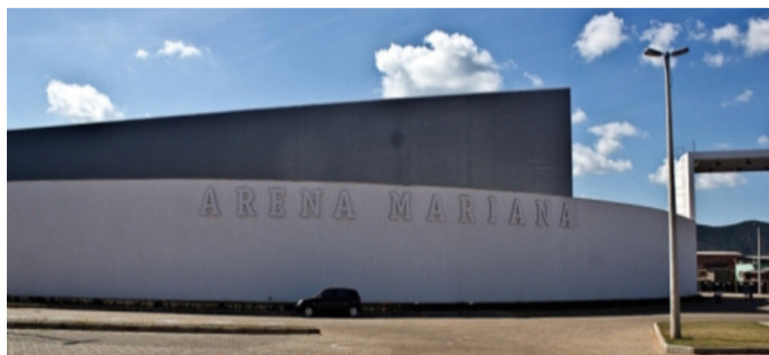
A cidade de Mariana foi escolhida como sede do Cruzeiro Futsal, sendo o anúncio oficial realizado em 7 de março.

A iniciativa representa um avanço significativo no fortalecimento do esporte local e na promoção de eventos que proporcionam entretenimento e lazer para a comunidade marianense, além de contribuir para o desenvolvimento do turismo esportivo na região.