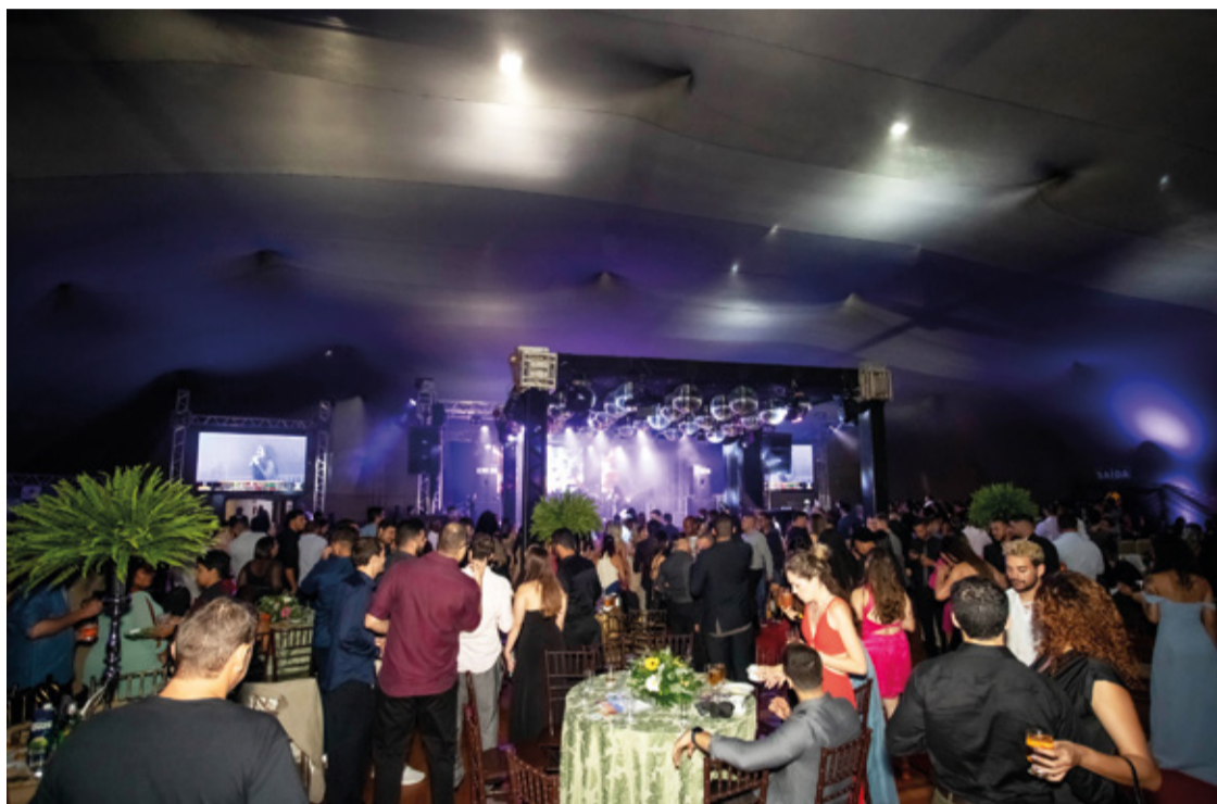
A organização do evento merece destaque especial, pois entregaram mais uma vez um megaevento, proporcionando uma experiência única para os homenageados e todos os presentes.

Na semana que vem, não deixe de conferir os melhores momentos desta noite no caderno especial, que inclui todos os detalhes da festa e a emoção de cada homenageado.