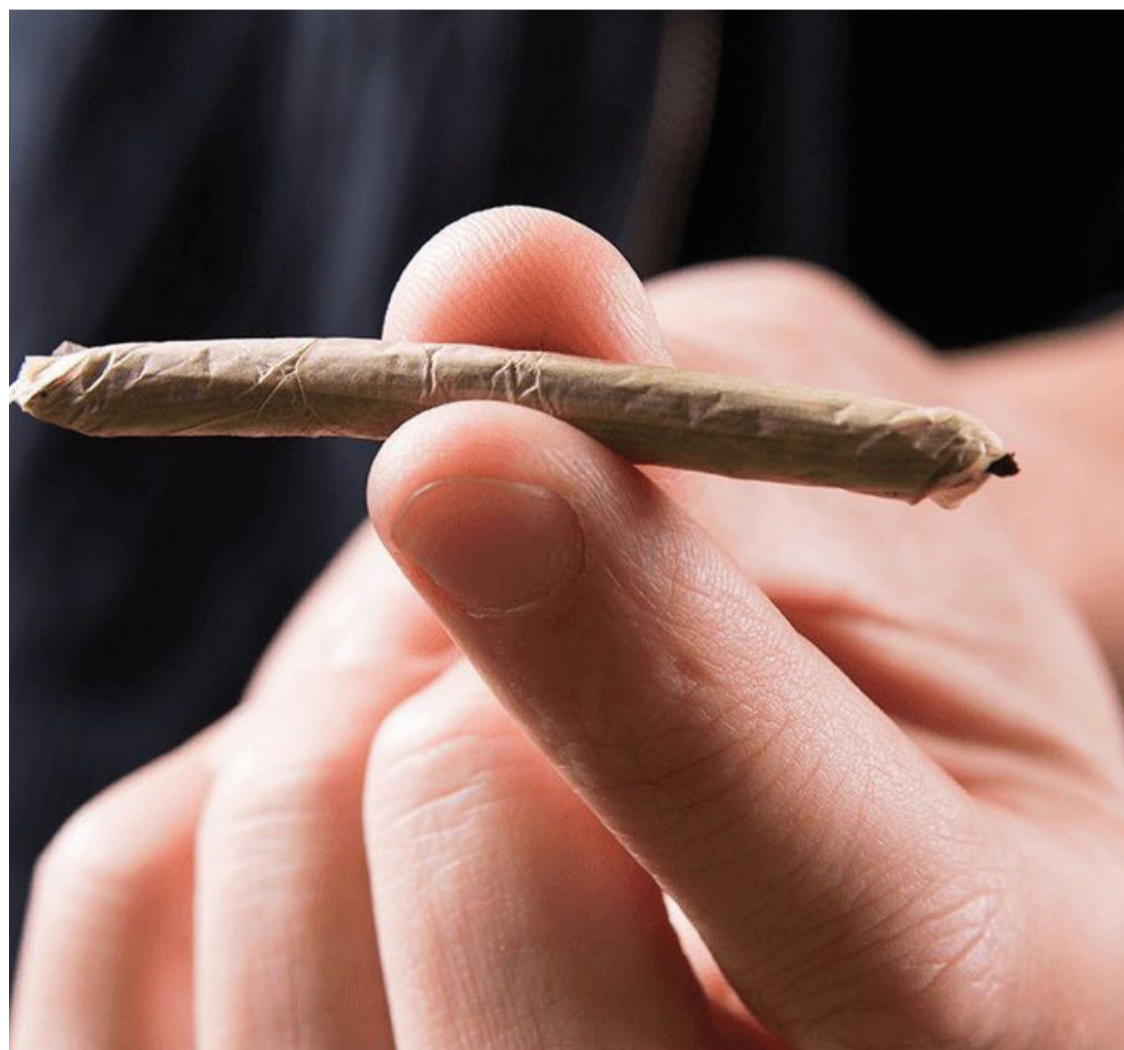
A proposição destaca a necessidade de distinguir entre traficantes e usuários.

A PEC foi apresentada em um momento em que o tema estava em destaque devido ao julgamento sobre a matéria pelo Supremo Tribunal Federal (STF). Com a aprovação no Senado, a discussão sobre a criminalização da posse e porte de drogas ilícitas continua a avançar no âmbito legislativo, suscitando debates sobre políticas públicas de segurança e saúde.