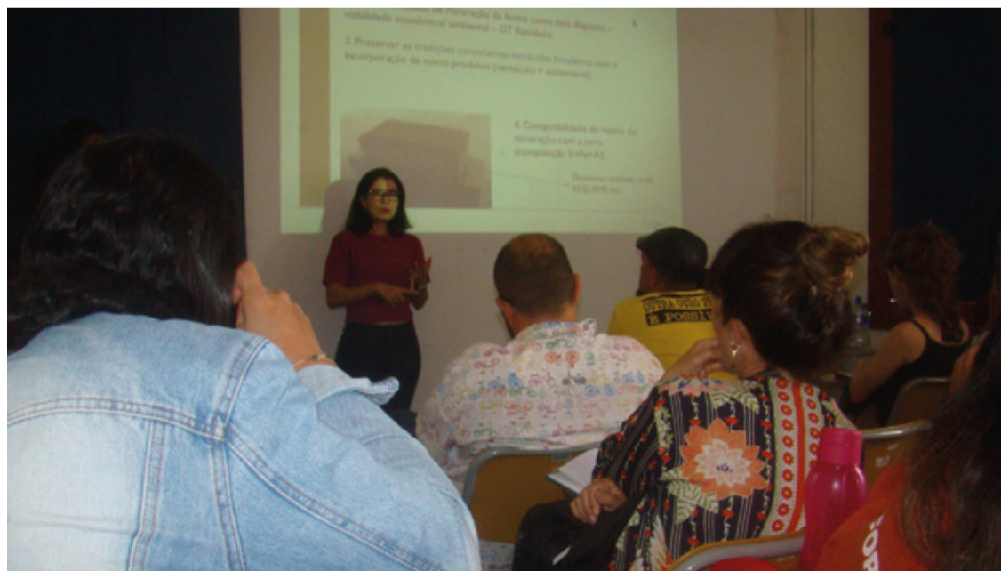
A Praça Antônio Dias será palco de espetáculos musicais, teatrais e de uma feirinha de arte e artesanato local.