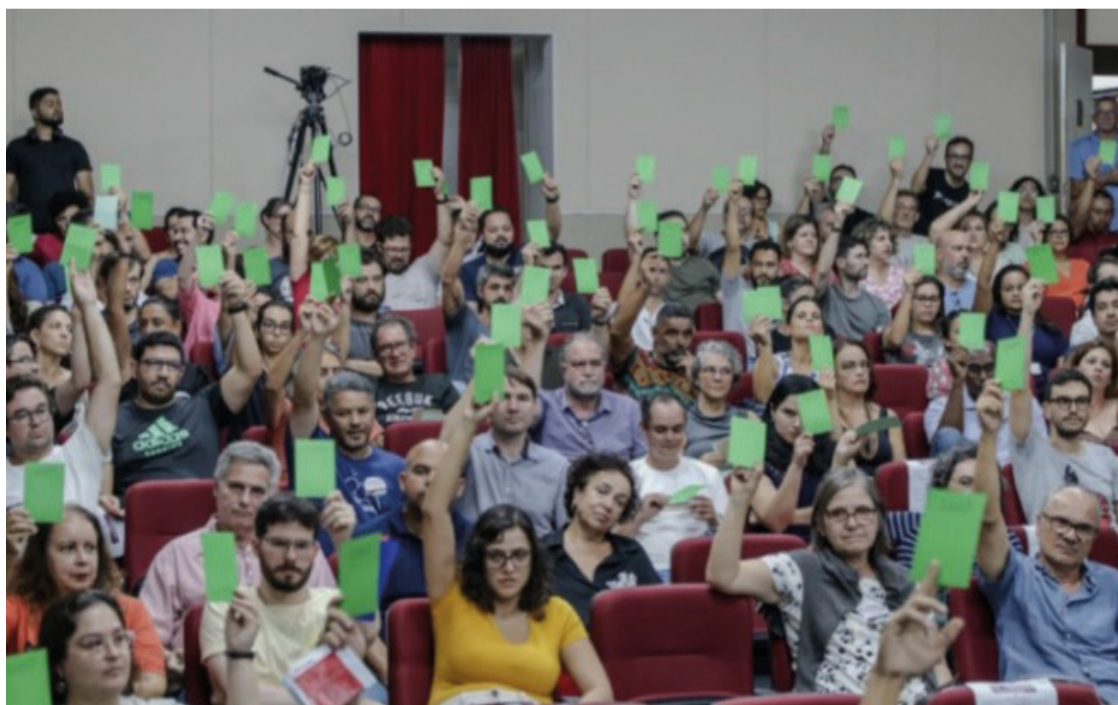
Os professores solicitam um reajuste de 22,71%, a ser dividido em três parcelas iguais de 7,06%, nos anos de 2024, 2025 e 2026.

Em comunicado, o Ministério da Educação (MEC) declarou que tem se empenhado em buscar opções para valorizar os servidores da educação, mantendo um diálogo aberto e respeitoso com as categorias e que no ano anterior, o governo federal implementou um reajuste de 9% para todos os servidores.