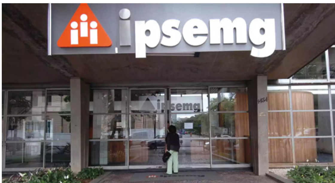
O INSTITUTO ESPERA ARRECADAÇÃO DE R$ 700 MILHÕES.

ém de elevar o piso da contribuição de R$ 33 para R$ 60 e o teto de R$ 275,15 para R$ 500, a proposta do governo Zema também inclui o fim da isenção para os filhos dependentes de até 21 anos dos beneficiários. A alíquota de contribuição será de 3,2% e abrangerá dependentes de até 38 anos, em contraste com a idade limite atual de 35 anos. O Palácio Tiradentes argumenta que o aumento das alíquotas é necessário para financiar a expansão de leitos, aprimorar a infraestrutura e ampliar os serviços eletivos do Ipsemg.