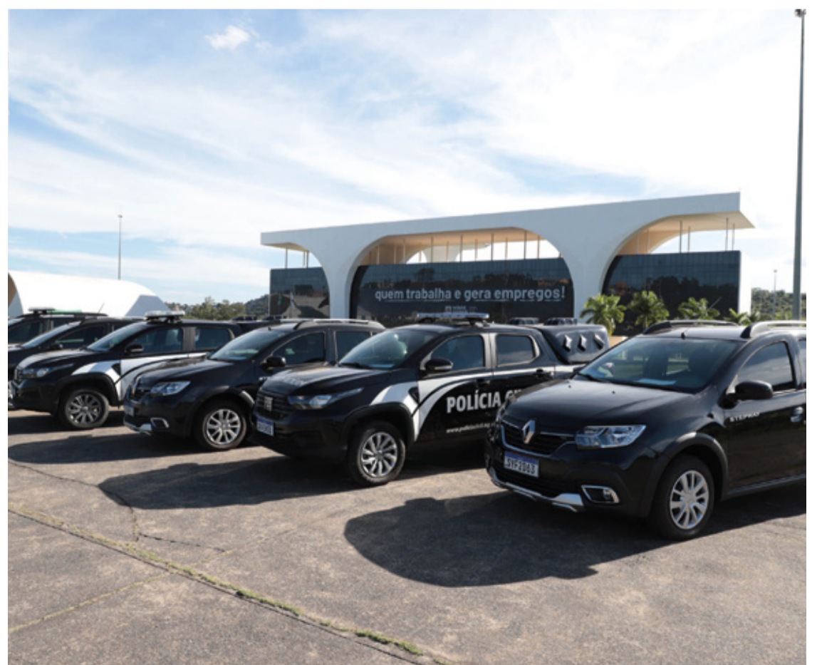
Essa nova frota será direcionada para delegacias da capital, da Região Metropolitana e do interior.

Nos últimos cinco anos, o Governo de Minas tem direcionado diversos investimentos para a Polícia Civil, incluindo incremento na frota, armamento, equipamentos e melhorias estruturais nas unidades, evidenciando o compromisso com a segurança pública e o bem-estar da população mineira.