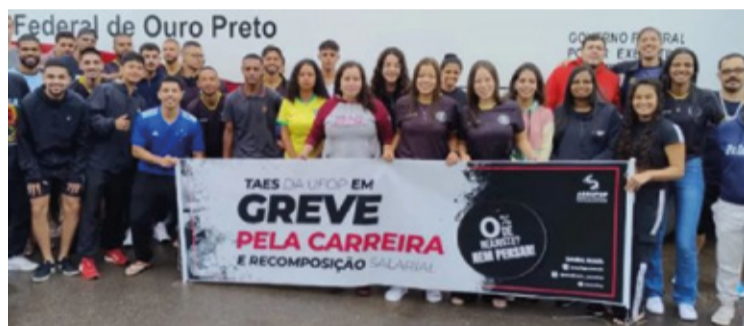
- A previsão de chegada dos manifestantes a Ouro Preto é para quinta-feira (18).

GREVE. A greve dos técnicos-administrativos da instituição teve início em 25 de março, enquanto a dos docentes teve início em 15 de abril.