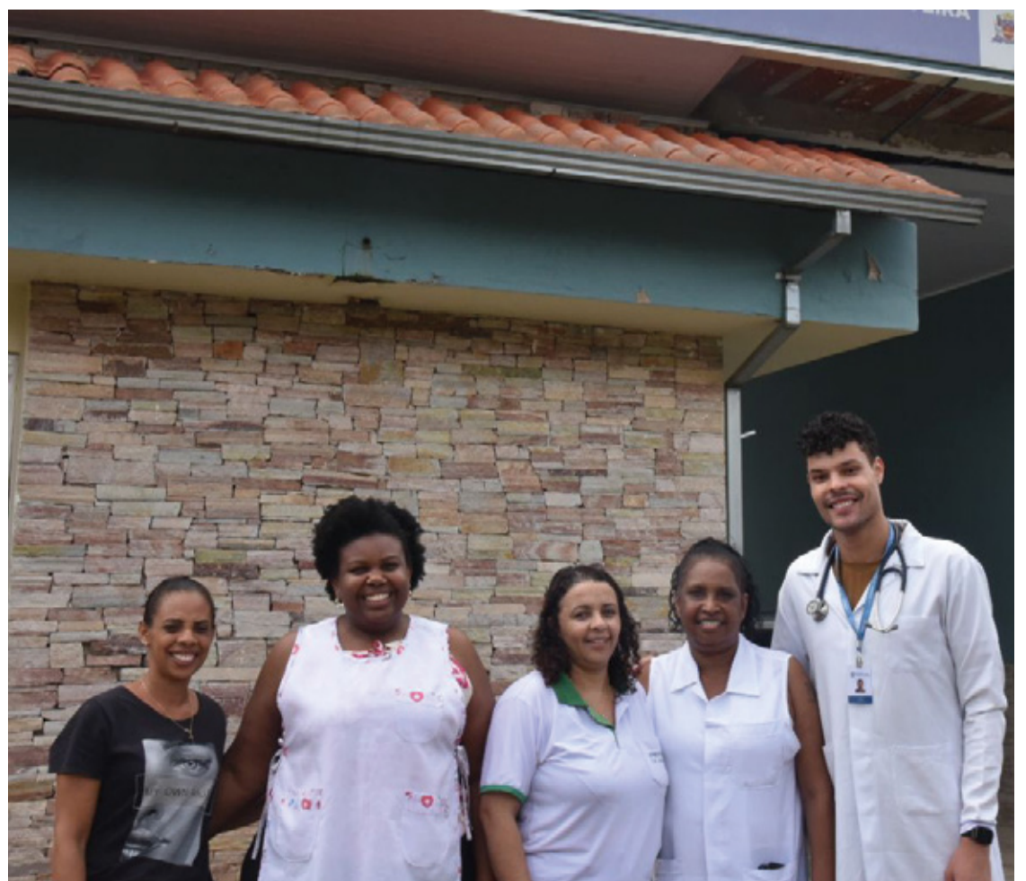
Nove UBSs tiveram seus horários de funcionamento ampliados para os sábados.