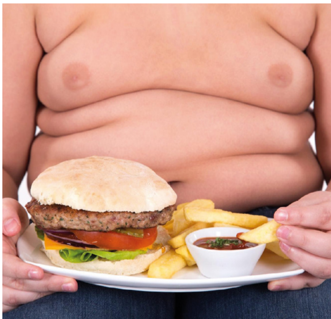
Esses achados destacam a necessidade urgente de políticas públicas eficazes para combater a obesidade infantil.

Esses achados destacam a necessidade urgente de políticas públicas eficazes para combater a obesidade infantil e promover hábitos saudáveis desde a infância. Educação nutricional, incentivo à prática de atividades físicas e acesso a alimentos saudáveis são medidas essenciais para reverter essa tendência preocupante e garantir um futuro mais saudável para as crianças brasileiras.