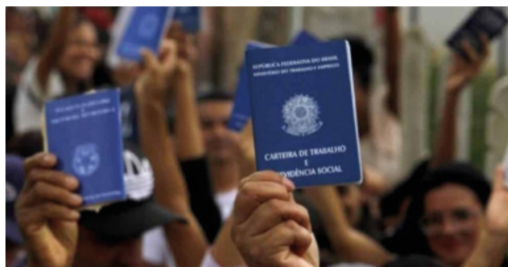
Entre os meses de dezembro e fevereiro, a população ocupada permaneceu estável, com 100,2 milhões de pessoas ocupadas.

Os dados refletem o cenário atual do mercado de trabalho no país e destacam a importância de políticas públicas e medidas econômicas para estimular a geração de empregos e promover a inclusão no mercado de trabalho.