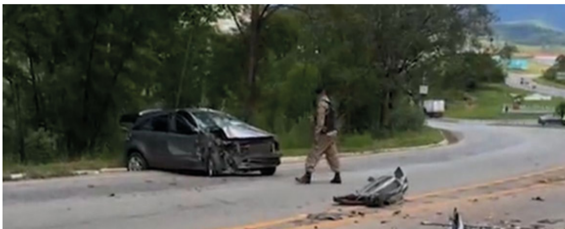
Após a colisão, o motorista de 30 anos, tentou escapar a pé, mas foi rapidamente capturado pela polícia.

A polícia seguiu o carro em fuga e, em certo momento, o motorista perdeu o controle do veículo e colidiu na traseira de um caminhão de coleta de lixo. O acidente resultou em danos materiais significativos, mas felizmente não houve feridos entre os ocupantes do caminhão.