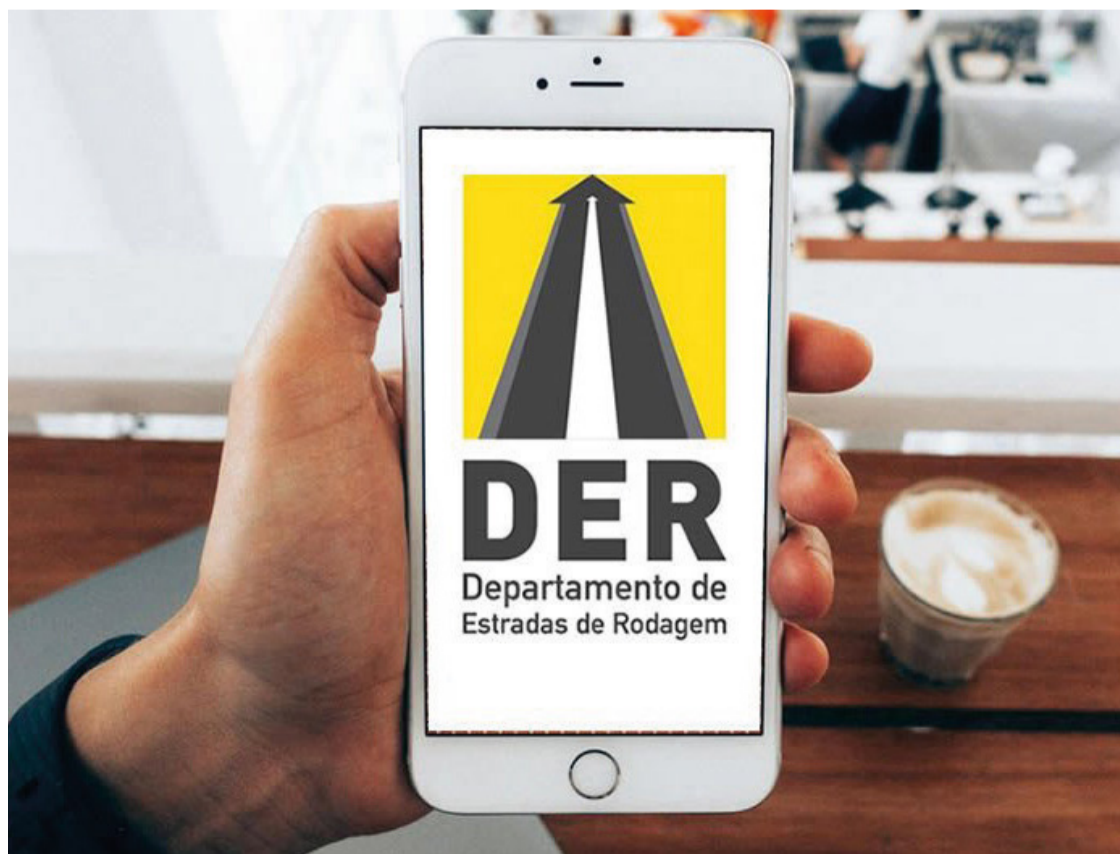
As informações inseridas no mapa são atualizadas por servidores do DER-MG

Com essa iniciativa, o DER-MG reafirma seu compromisso com a segurança e a qualidade das vias estaduais de Minas Gerais, proporcionando aos usuários uma experiência de viagem mais tranquila e informada.