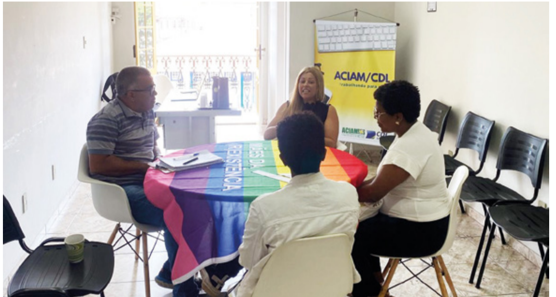
O encontro representa um marco na busca por parcerias e ações concretas em prol da comunidade LGBTQIA+ de Mariana.

O encontro entre a ACIAM/CDL Mariana, a Secretária de Desenvolvimento Social e Cidadania e o Coletivo