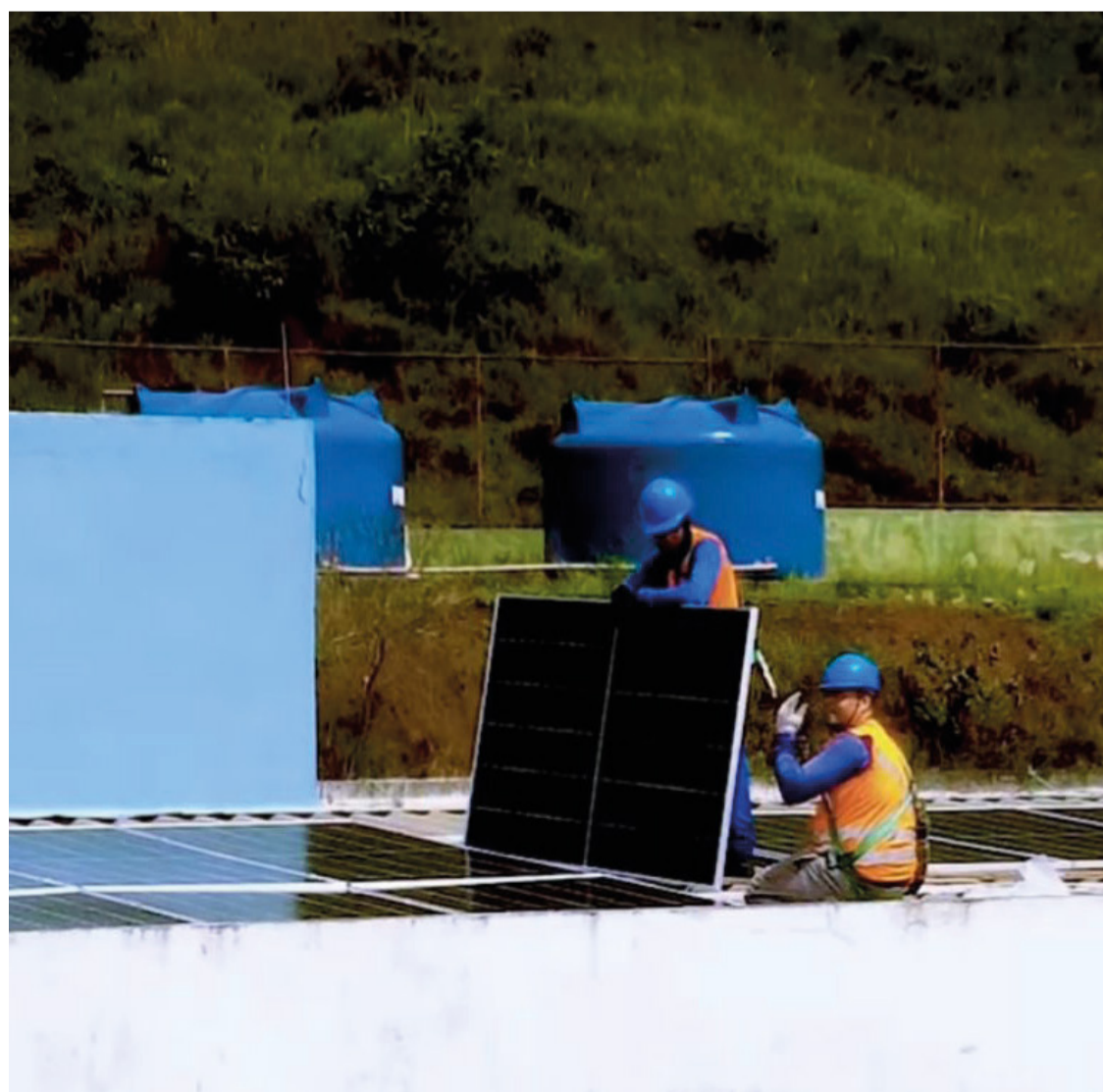
Essas placas são capazes de gerar impressionantes 110 kWp por dia.

Essa ação não apenas promove a sustentabilidade ambiental ao utilizar fontes renováveis de energia, mas também representa uma economia significativa nos custos de energia elétrica para a administração pública, contribuindo para uma gestão mais eficiente e responsável dos recursos municipais.