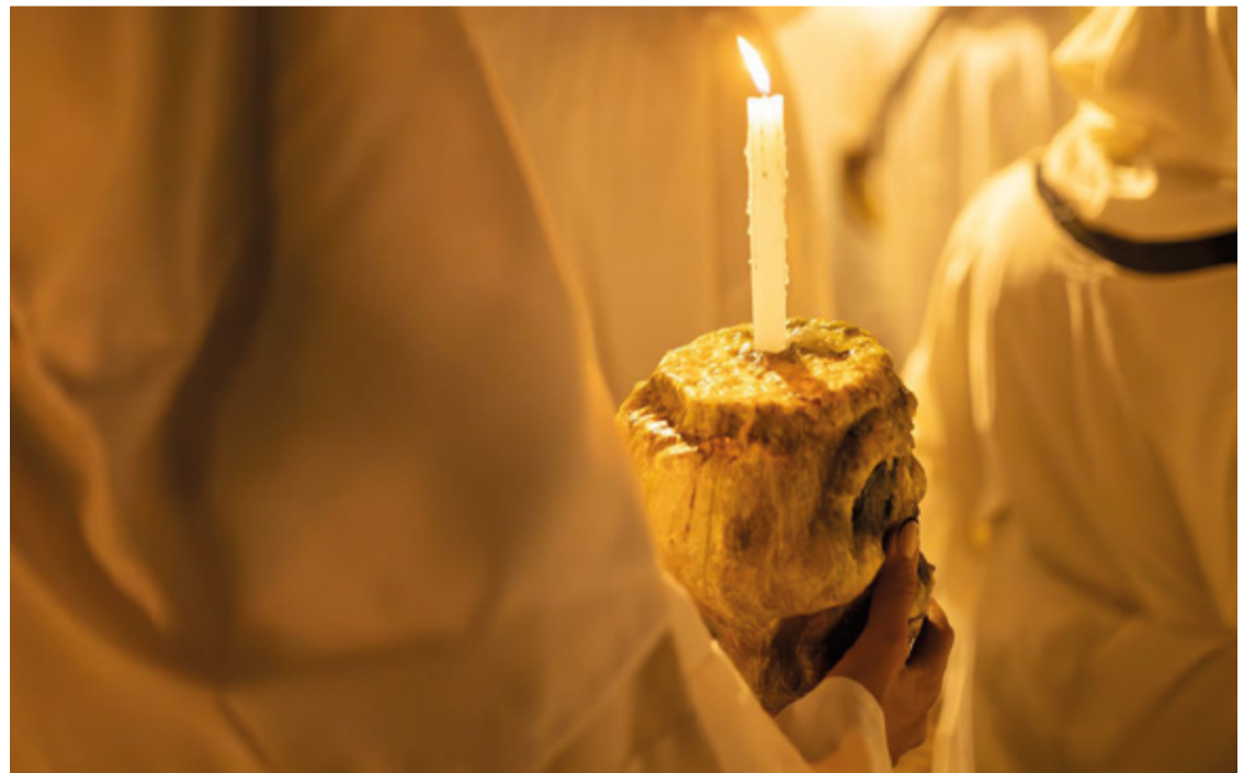
Dezenas de pessoas vestidas com túnicas brancas e segurando velas se reuniram para percorrer o trajeto.

Essas narrativas folclóricas, aliadas à atmosfera única da Procissão das Almas, tornam o evento uma tradição enraizada na cultura e na história de Mariana, perpetuando-se ao longo das gerações.