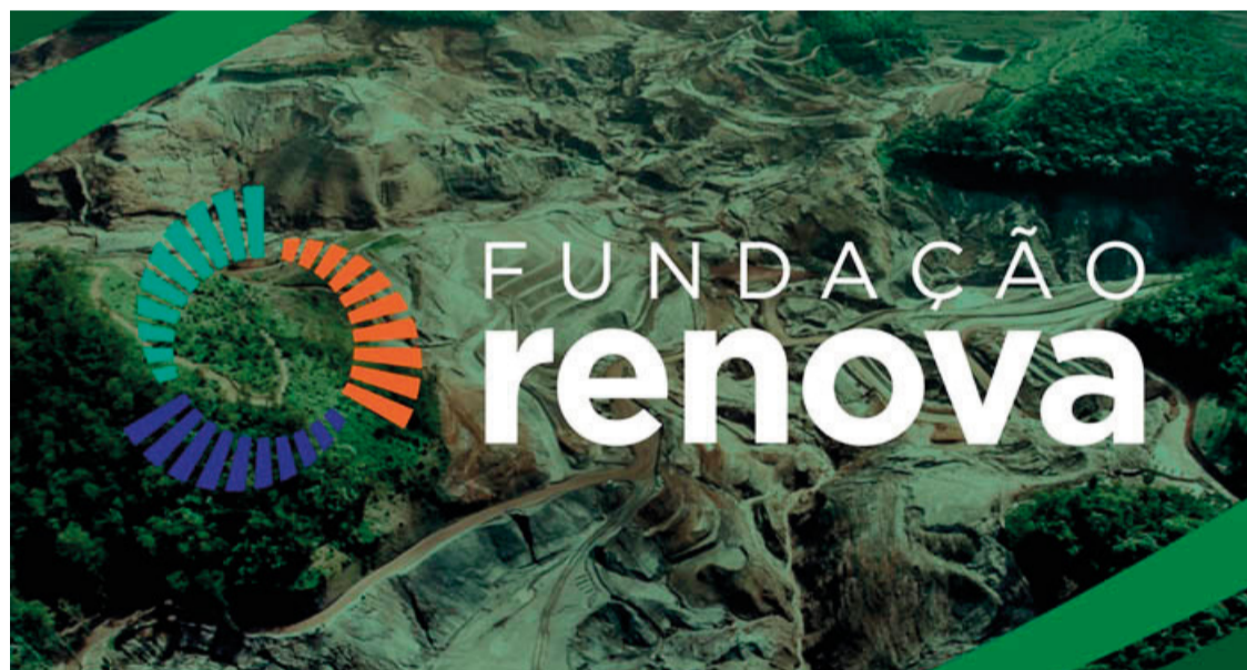
Pelo menos 373 moradores de 23 municípios de Minas Gerais e Espírito Santo relataram a negativa de pagamento.

A Fundação Renova justificou que a negativa estava fundamentada em uma cláusula de quitação prevista no termo do Novel. No entanto, o magistrado considerou que essa interpretação extrapolava o acordo, ressaltando a necessidade de uma análise fundamentada e de boa-fé por parte da Fundação Renova para a concessão ou não do benefício, em conformidade com o Termo de Transação e Ajustamento de Conduta (TTAC) e precedentes judiciais.