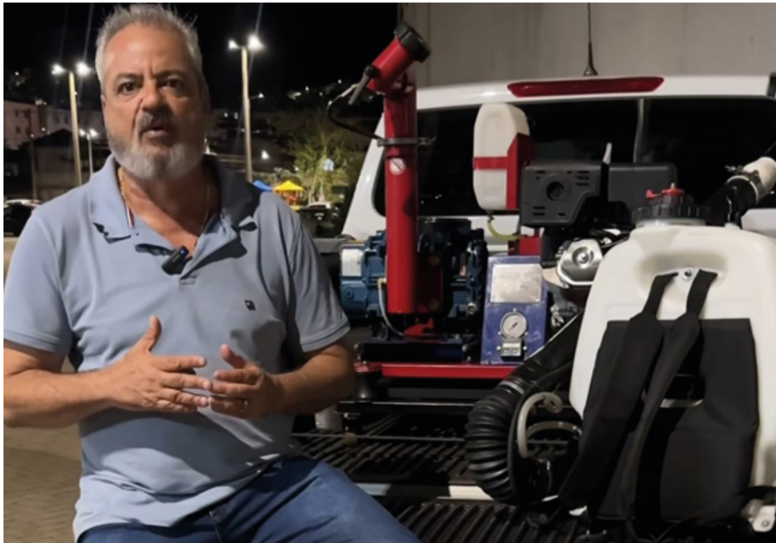
O cronograma de aplicação do fumacê segue o protocolo do Ministério da Saúde