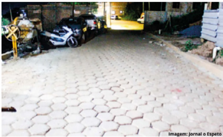
Obra na rua Caetano Pinto concluída.

UNIÃO. Moradores arrecadaram R$ 60 mil em doações e usufruíram de mão de obra voluntária.