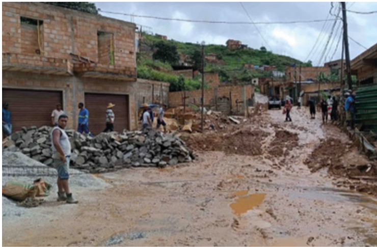
Rua Caetano Pinto antes da execução da obra.