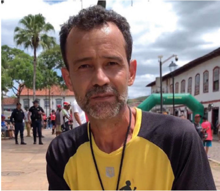
Recentemente, um evento especial, o Treinão, foi organizado em apoio a Nico.

GRATIDÃO. Em relação à expectativa, Nico expressa profunda emoção diante da generosidade e apoio que tem recebido.