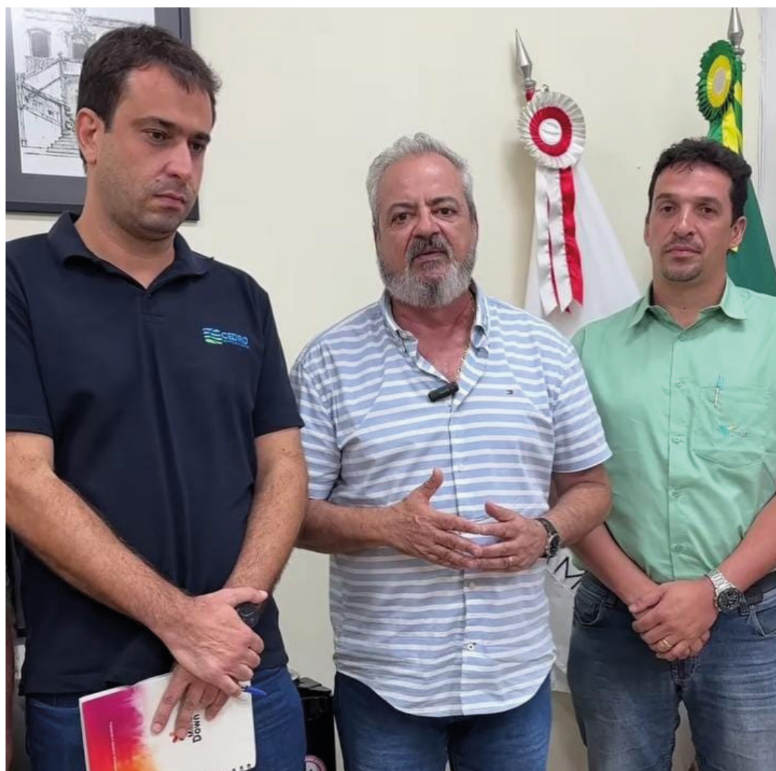
A reunião aconteceu no gabinete do prefeito Celso Cota.

opções encontrada pelas partes foi a contratação de profissionais de logística que residem no distrito e adjacências. A solução decreta a quantidade de caminhões que transitam diariamente e gera emprego para os trabalhadores da área de transportes. A aprovação mútua entre empresa privada, poder público e população foi celebrada, e cria expectativa de ser repetida mais vezes.