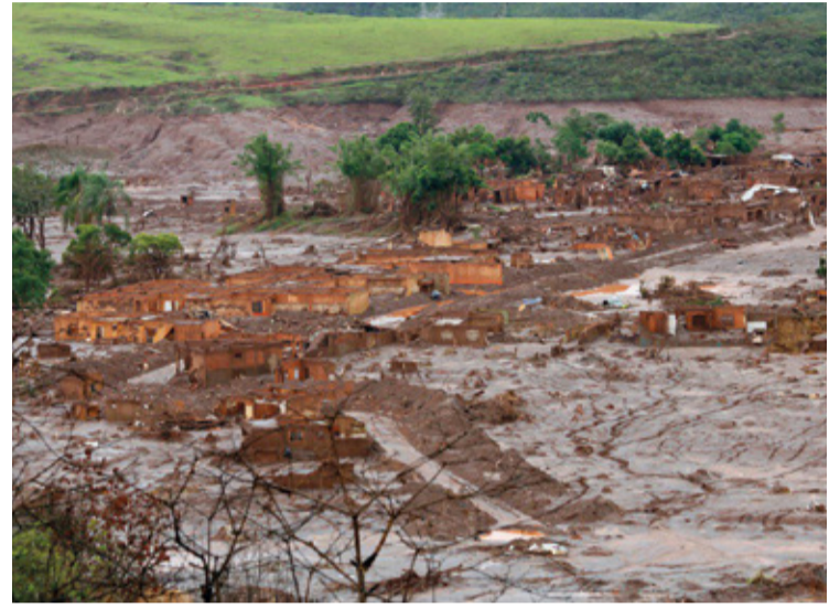
Rejeitos da lama proveniente do rompimento em 2015.

nos Países Baixos contra a Vale e a Samarco Iron Ore Europe BV surge em um momento delicado para a Vale no Brasil. Isso acontece após a renúncia de um diretor independente do conselho, que citou preocupações relacionadas à governança corporativa e alegada "influência política prejudicial" na seleção do próximo diretor executivo da Vale.