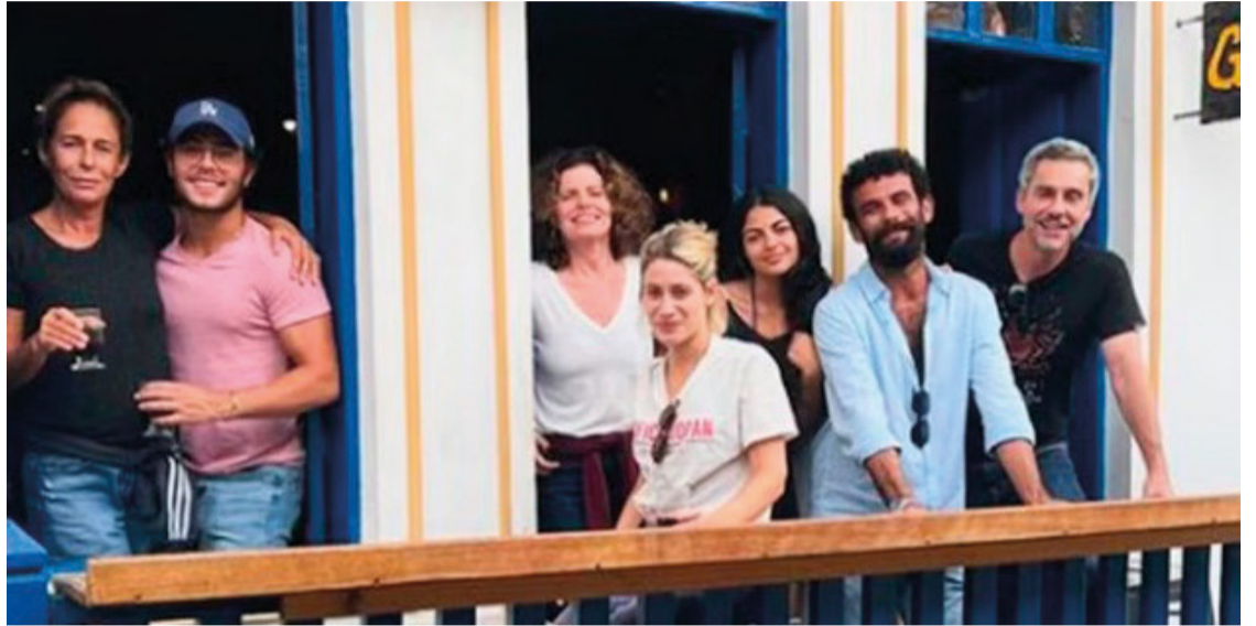
Hospedados em três hotéis da cidade, os atores já se preparam para dar vida aos seus personagens.

A narrativa de “No Rancho Fundo” se desenrola na fictícia cidade de Cariri, situada em Lasca Fogo, município de Lapão da Beirada, no sertão nordestino, trazendo consigo toda a riqueza cultural e paisagens deslumbrantes dessa região do país.