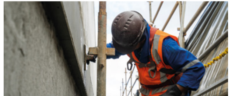
As vagas oferecidas nesta semana contemplam diversas áreas de atuação.