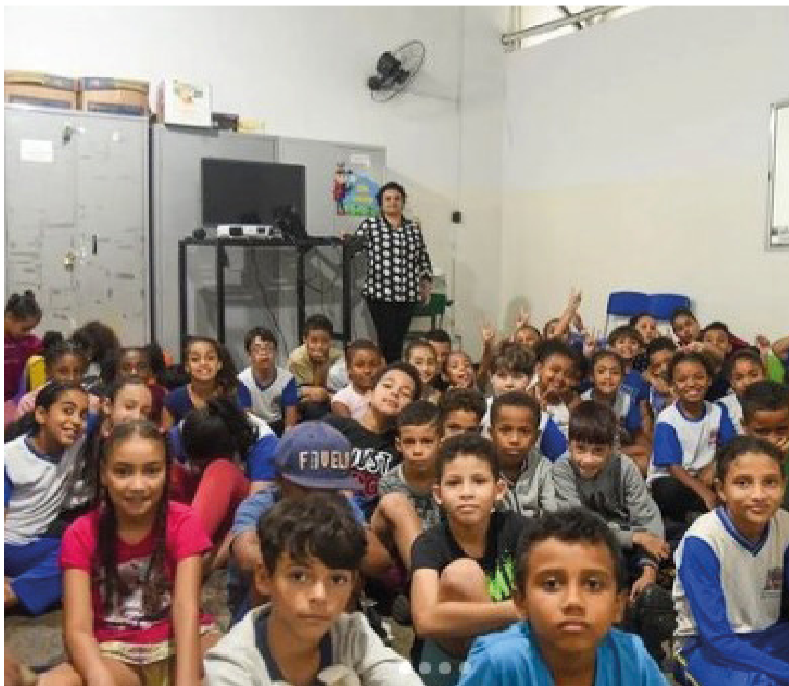
O modelo está disponível para os estudantes do 1º ao 9º Ano do Ensino Fundamental matriculados nas escolas da rede municipal.

A implementação da Escola em Tempo Integral está ocorrendo gradualmente ao longo do mês de março. Onze escolas deram início às atividades. Nesta segunda-feira (11), outras 16 unidades de ensino estão oferecendo a modalidade, e a expectativa é de que todas as instituições do Ensino Fundamental sejam contempladas.