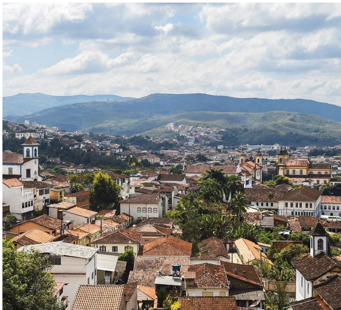
Os critérios para recebimento do aluguel social são estabelecidos pela Lei do Programa de Auxílio Moradia.

A situação coloca em evidência a importância de garantir o pagamento em dia dos aluguéis sociais, uma vez que essas famílias dependem desse auxílio para garantir sua moradia e estabilidade financeira. O Jornal Ponto Final permanecerá atento ao desenrolar dessa questão e continuará buscando informações para manter a população informada.