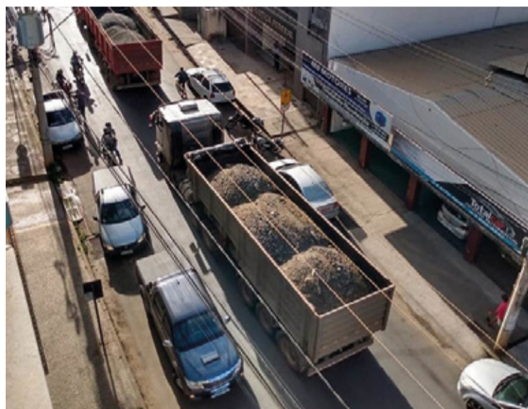
Caminhões usados no transporte de minério em Minas Gerais.

Em parágrafo único, a disposição dos avisos deve ser re-