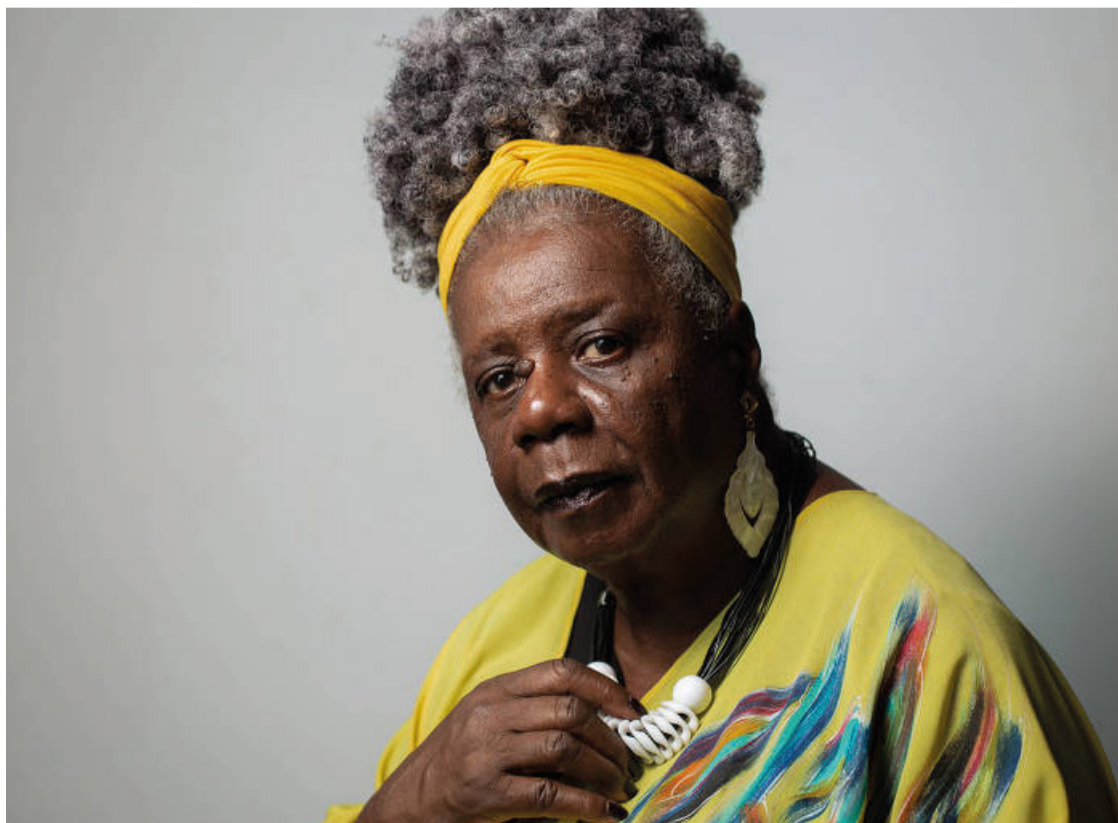
Ela é considerada uma das literatas mais influentes do movimento pós-modernista no Brasil.