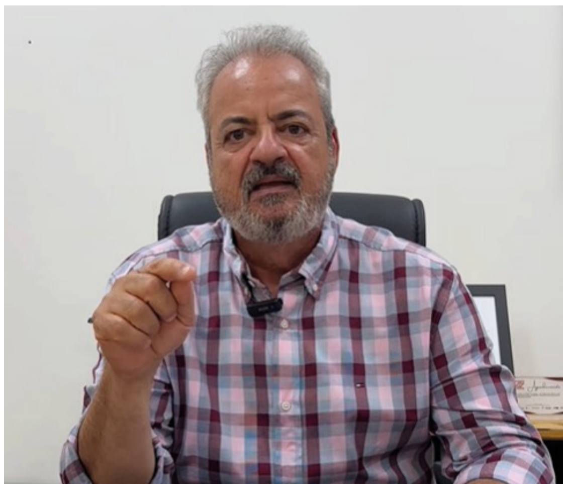
A decisão do Tribunal de Justiça confirmou a sentença de primeira instância.