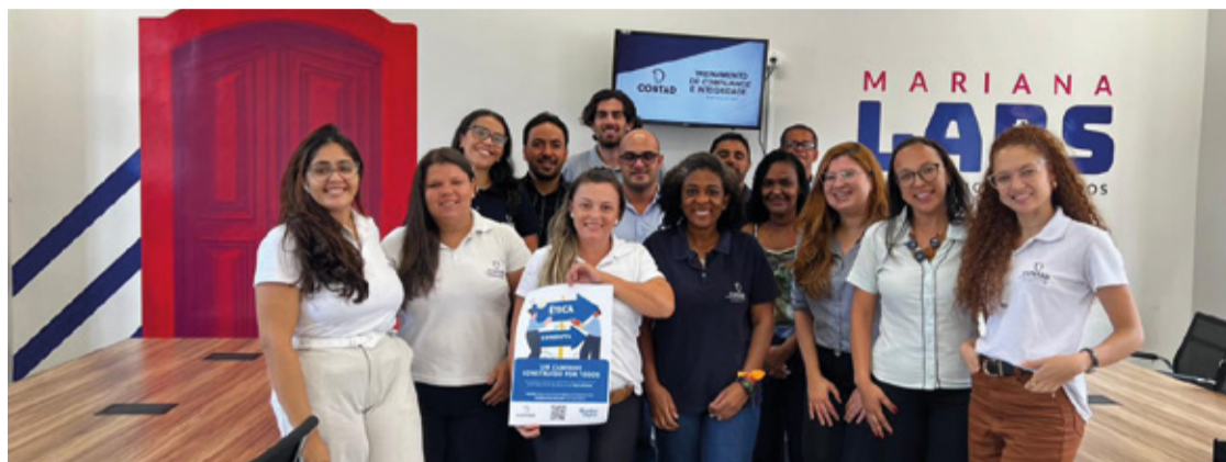
Equipe da Contad recebendo as orientações do Programa de Compliance.

O programa busca incorporar os valores que guiam e reforçam o compromisso da organização com a lisura, transparência e respeito mútuo. Isso reitera a dedicação em conduzir todas as atividades da empresa de acordo com os mais altos padrões. Além disso, enfatiza a determinação em cumprir as leis vigentes e promover relacionamentos éticos com todas as partes envolvidas nas operações da Contad Gerenciamento, incluindo colabo-