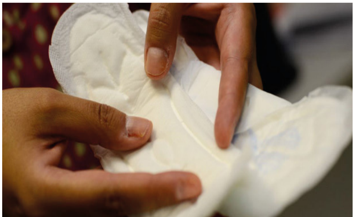
Nesta fase inicial, a distribuição de absorventes será principalmente através do Programa Farmácia Popular.

Os absorventes podem ser obtidos em unidades credenciadas pelo Programa Farmácia Popular, após a geração de autorização através do aplicativo ou site Meu SUS Digital. Cada indivíduo tem direito a 40 itens a cada período de 56 dias. Para aquelas com dificuldade de acesso ao programa, o governo sugere procurar as Unidades Básicas de Saúde (UBS), que podem imprimir a autorização se necessário.