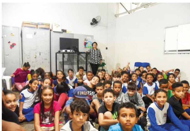
Os estudantes estão engajados na conscientização e prevenção da doença nas escolas.

CONSCIENTIZAÇÃO. Equipe da Vigilância em Saúde visita escola para discutir estratégias de combate ao mosquito transmissor e às doenças associadas.