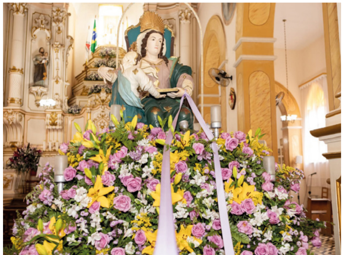
A Paróquia Nossa Senhora Aparecida no Cabanas, foi o local escolhido para acolher a imagem peregrina.

A visita da imagem peregrina de Sant’Ana de Guaraciaba em Mariana será um momento de grande significado para os fiéis e devotos. Essa visita especial servirá como preparação para a Festa de Sant’Ana em Guaraciaba, um evento muito aguardado por todos. Que essa visita fortaleça a fé e a devoção de cada um, e que Sant’Ana continue abençoando e protegendo a todos os fiéis e devotos.