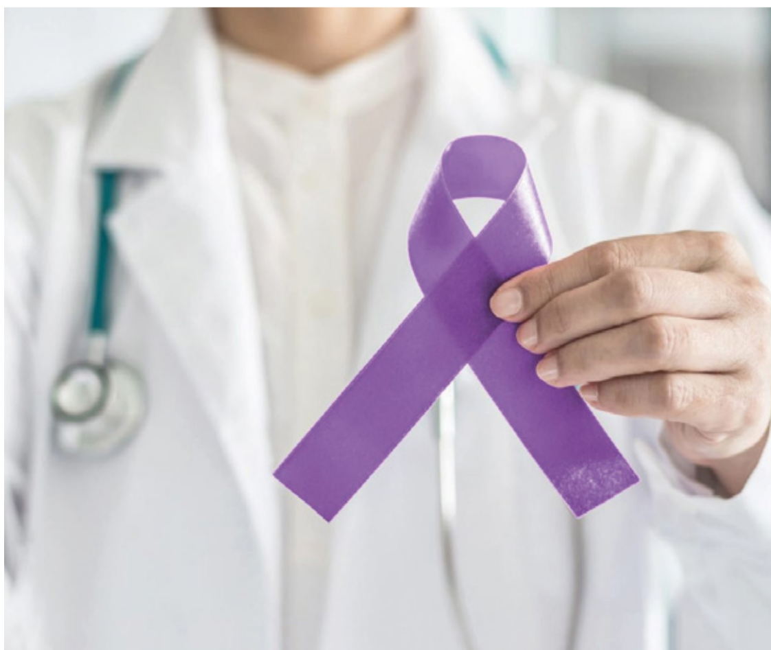
Prevenir é um gesto de amor à vida.

Prevenir é um gesto de amor à vida. Portanto, não deixe de se cuidar e de se informar sobre a importância da prevenção do câncer de colo uterino. Junte-se à campanha Março Lilás e ajude a conscientizar cada vez mais pessoas sobre esse tema tão relevante para a saúde da mulher.