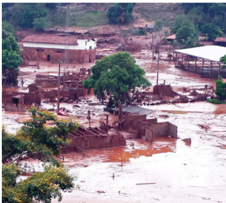
Bento Rodrigues após o desastre de 2015 com casas submersas na lama da barragem de Fundão, destacando a devastação e a importância de preservar essa memória.