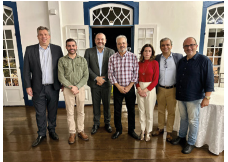
Diversas autoridades e representantes do setor público e privado estiveram presentes, valorizando ainda mais o encontro.