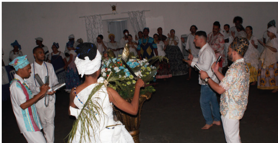
A feitura do cordão de Francisco é tradicional nas religiões afro-brasileiras.

O turismo religioso é o segmento que mais contribui para o desenvolvimento de novas rotas turísticas em Minas Gerais. O programa Minas Santa contará com atividades em rotas emblemáticas do estado, tais como o Caminho da Luz, o Caminho da Fé, o Caminho Nos Passos de Dom Viçoso, o