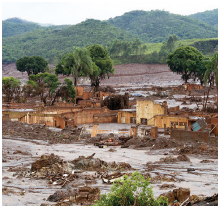
Bento Rodrigues após o desastre de 2015 com casas submersas na lama da barragem de Fundão, destacando a devastação e a importância de preservar essa memória.

BARRAGEM DE FUNDÃO. Iniciativa visa preservar memória do desastre ambiental de 2015 e garantir proteção histórica dos territórios afetados.