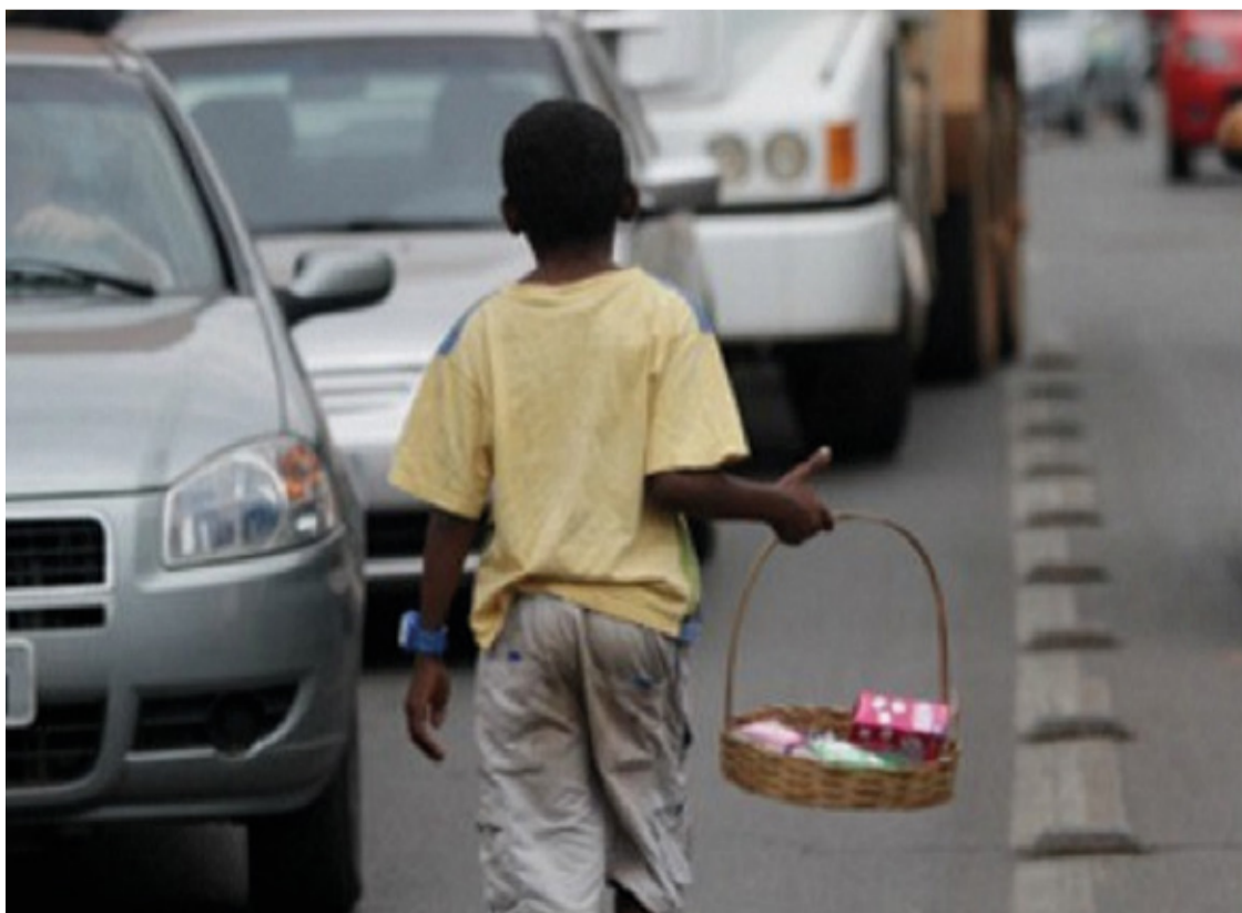
Mais de 280 mil crianças podem estar em trabalho forçado.

O governo de Minas Gerais assegura que está empenhado em diversas iniciativas para combater o trabalho infantil. O Estado promove a divulgação de materiais técnicos destinados às equipes da assistência social, conselheiros tutelares e a toda a rede de proteção dos direitos de crianças e adolescentes. Além disso, em dezembro de 2023, foi lançada uma campanha de conscientização e combate a essa forma de exploração, acompanhada por um curso de formação sobre o tema.