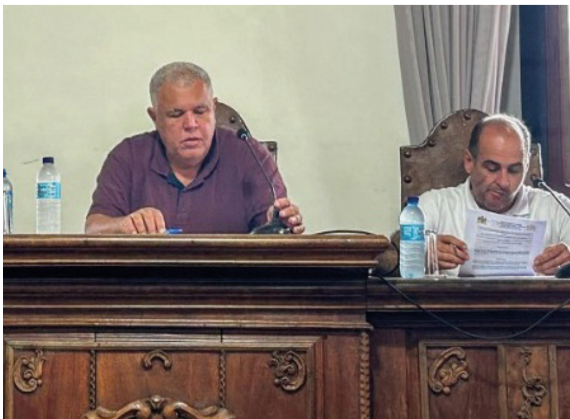
O parecer das comissões de finanças, legislação e justiça foi favorável à tramitação da proposta.

A votação em torno do Projeto de Lei nº 23/2024 foi realizada com sucesso e teve aprovação unânime entre os edis.