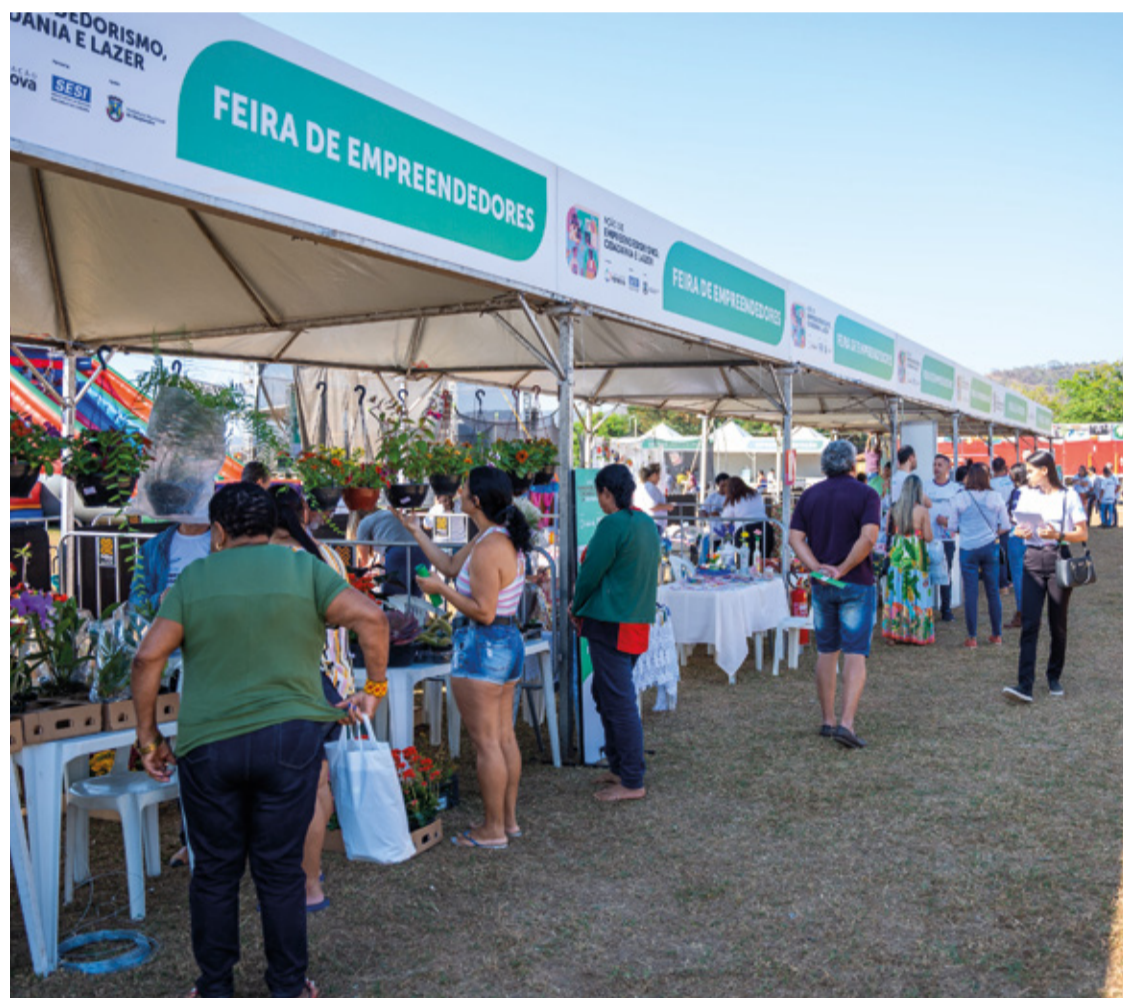
A Ação de Empreendedorismo, Cidadania e Lazer é parte das ações de reparação da Fundação Renova no município.