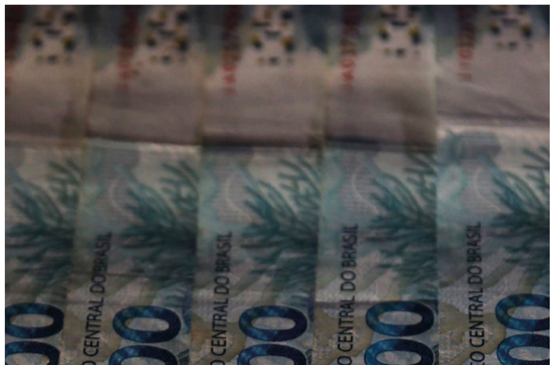
O Governo agora tem prazo médio de 4,11 anos para refinaranciar a dívida pública.

As instituições financeiras continuam sendo as principais detentoras da Dívida Pública Federal interna, representando 28,1% do estoque total. Em seguida, aparecem os fundos de pensão, com 23,6%, e os fundos de investimento, com 23,5%. Através da dívida pública, o governo obtém empréstimos dos investidores para cumprir suas obrigações financeiras. Em contrapartida, compromete-se a reembolsar os recursos após certo período, com algum tipo de correção, que pode ser vinculada à taxa Selic (os juros básicos da economia), à inflação, ao dólar ou ser estabelecida previamente.