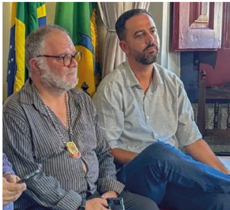
Em um encontro marcado pelo compromisso com sua terra natal, o deputado destacou a importância de representar a população local.

Ao finalizar seu discurso reafirmou seu compromisso em trabalhar incansavelmente para fortalecer Mariana e representar os interesses da população, destacando a importância de compreender o sistema político para escolher representantes que realmente contribuam para o desenvolvimento da cidade.