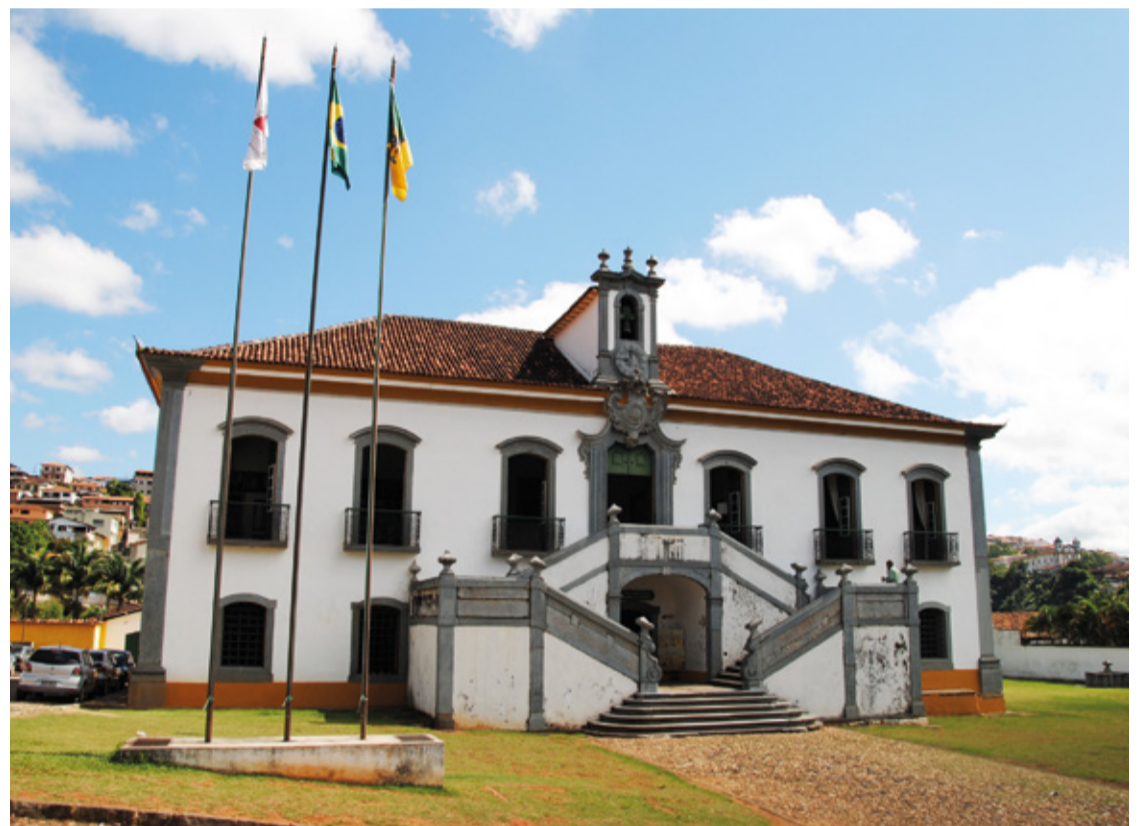
A audiência será realizada na quinta-feira (29/02), às 14h, na Câmara Municipal de Mariana e será transmitida ao vivo pelo canal do YouTube da Câmara.