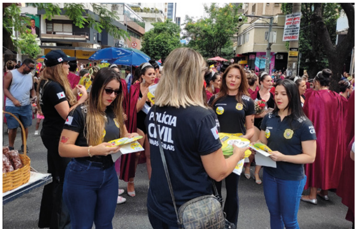
Equipes da Polícia Civil já estão atuando na conscientização durante os eventos de pré-Carnaval.

Com a campanha “Depois do não, é crime, uai!”, a Polícia Civil de Minas Gerais reafirma seu compromisso com a segurança e a proteção dos cidadãos durante as festividades carnavalescas, incentivando um ambiente de respeito e tranquilidade para todos os foliões.