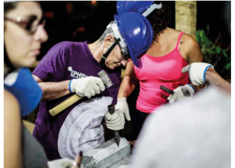
Neste semestre o curso “Pedreira - Mulheres na Construção” é novidade na escola.

Os conteúdos abordados durante o curso se baseiam em temas fundamentais como segurança no trabalho, planejamento e acompanhamento de obras, leitura e interpretação de projetos, manuseio de máquinas, ferramentas e equipamentos, conhecimento das características dos mate-