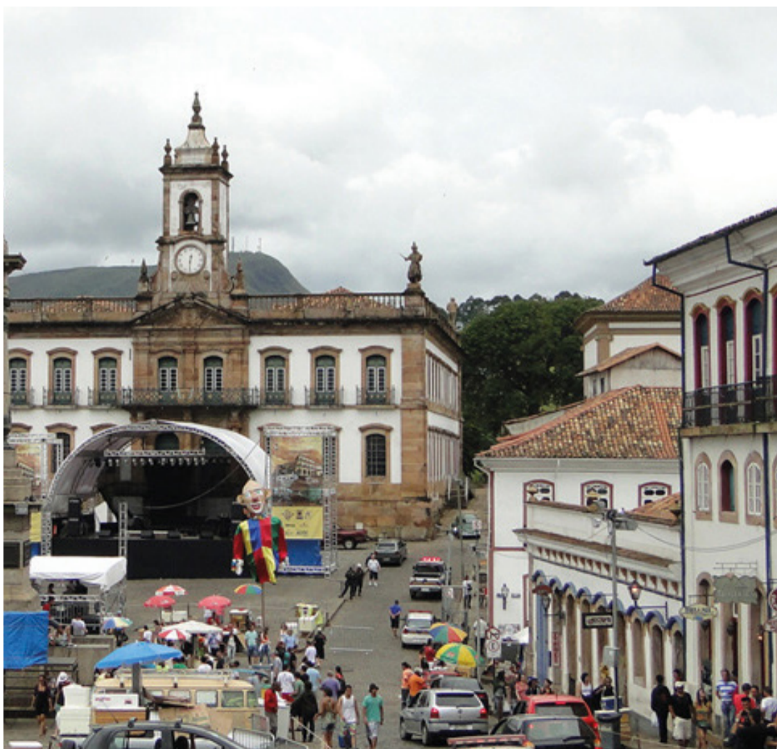
Segundo noticiários da região, houve manifestações no local na noite da terça-feira (06), realizadas pela Associação de Barraqueiros de Ouro Preto

Na última segunda-feira (05), a Justiça Federal agendou uma Audiência em Ponte Nova e a Prefeitura apresentou documentações para a liberação da celebração. A decisão ainda está sendo analisada pelo Ministério Público Federal (MPF), com prazo de 48 horas desde o fim da audiência. A definição ainda não havia sido realizada antes do fim da edição.