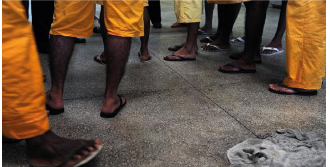
A medida de suspensão das saídas temporárias durante o Carnaval visa aumentar a segurança e prevenir incidentes.