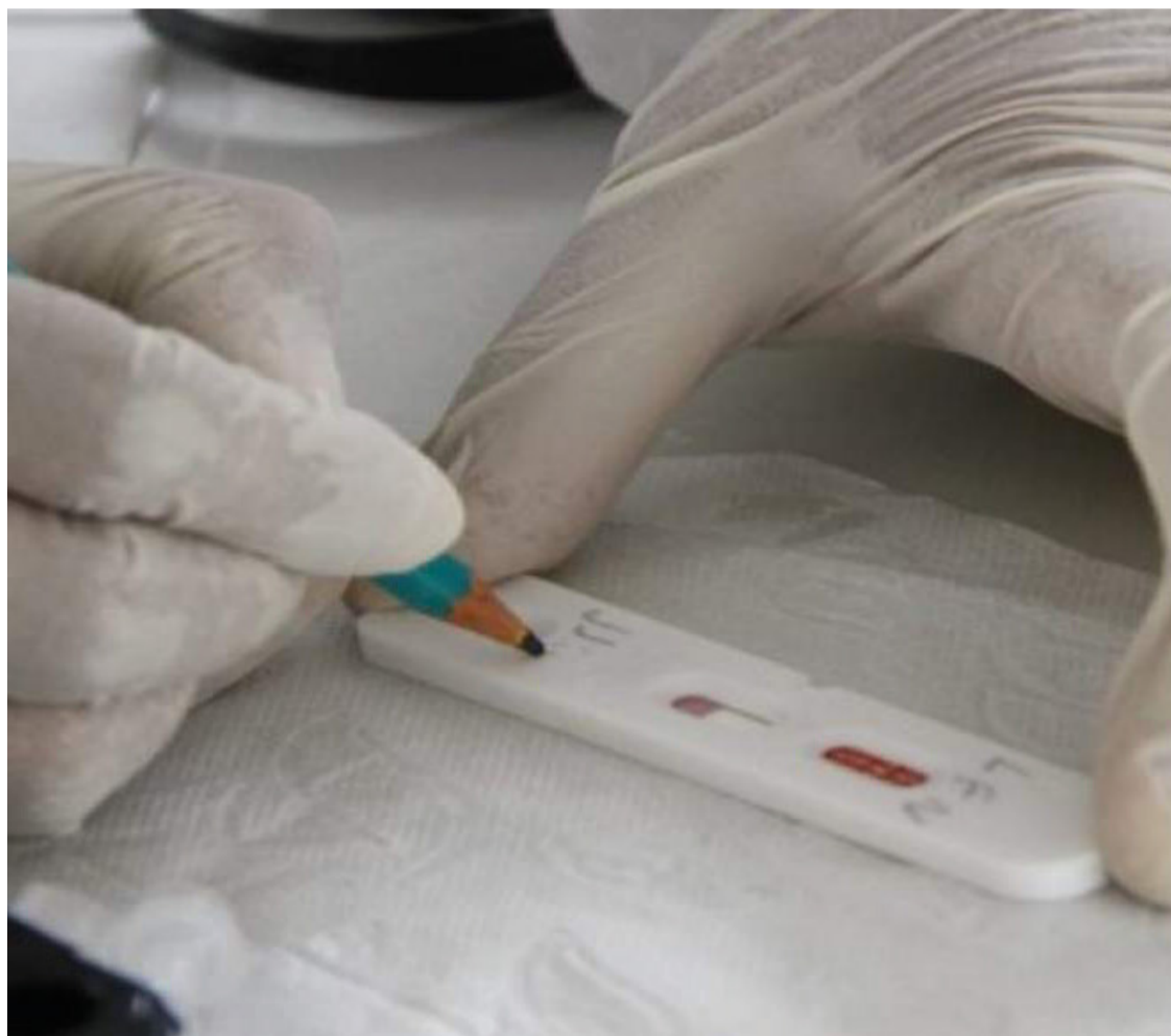
Um dos pontos de destaque nessa atualização é o expressivo aumento no número de óbitos em algumas cidades mineiras.

Diante do cenário preocupante, as autoridades de saúde reforçam a importância da manutenção das medidas de prevenção, como o uso de máscaras, higienização das mãos e distanciamento social, e incentivam a população a aderir à vacinação como forma eficaz de combate à propagação do vírus e redução dos impactos da doença.