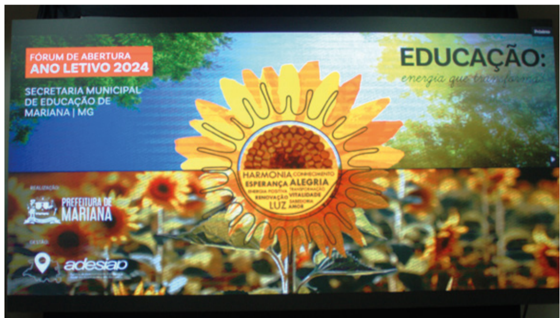
O encontro teve como título Educação: energia que transforma.

A cerimônia teve o intuito de aproximar os educadores, proporcionando a troca de ideias e o reencontro dos colegas após o recesso escolar. Vale ressaltar que este ano o programa Escola em Tempo Integral será inserido na rede municipal, oferecendo aulas de esporte, estudos orientados, arte e cultura e educação para vida. Este último, focado em assuntos como ética e cidadania, educação ambiental e educação afro-brasileira.