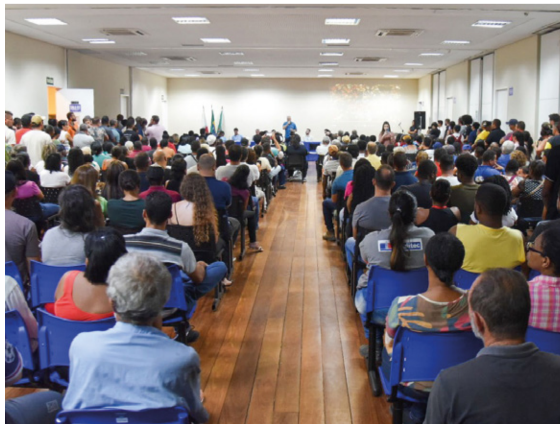
Essa iniciativa representa um passo importante para a regularização e valorização das moradias dos cidadãos marianenses.

Essa iniciativa representa um passo importante para a regularização e valorização das moradias dos cidadãos marianenses, garantindo-lhes segurança e reconhecimento legal, além de promover o desenvolvimento sustentável e a qualidade de vida em suas comunidades.