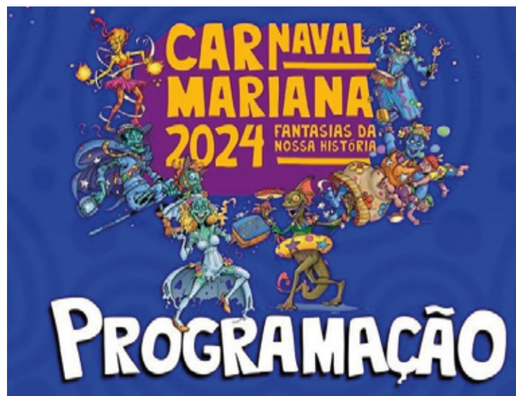
As ilustrações foram feitas pelo artista marianense, Camaleão.

No último dia de festa, serão 23 atrações entre grupos de dança, bandas musicais, artistas locais, blocos e cortejos. Na terça-feira, a programação vai de 13h às 00:30, finalizando o Carnaval que homenageia a cultura da cidade. Vale ressaltar que as atrações serão divididas entre as praças Gomes Freire (jardim), Praça da Sé e Praça Tancredo