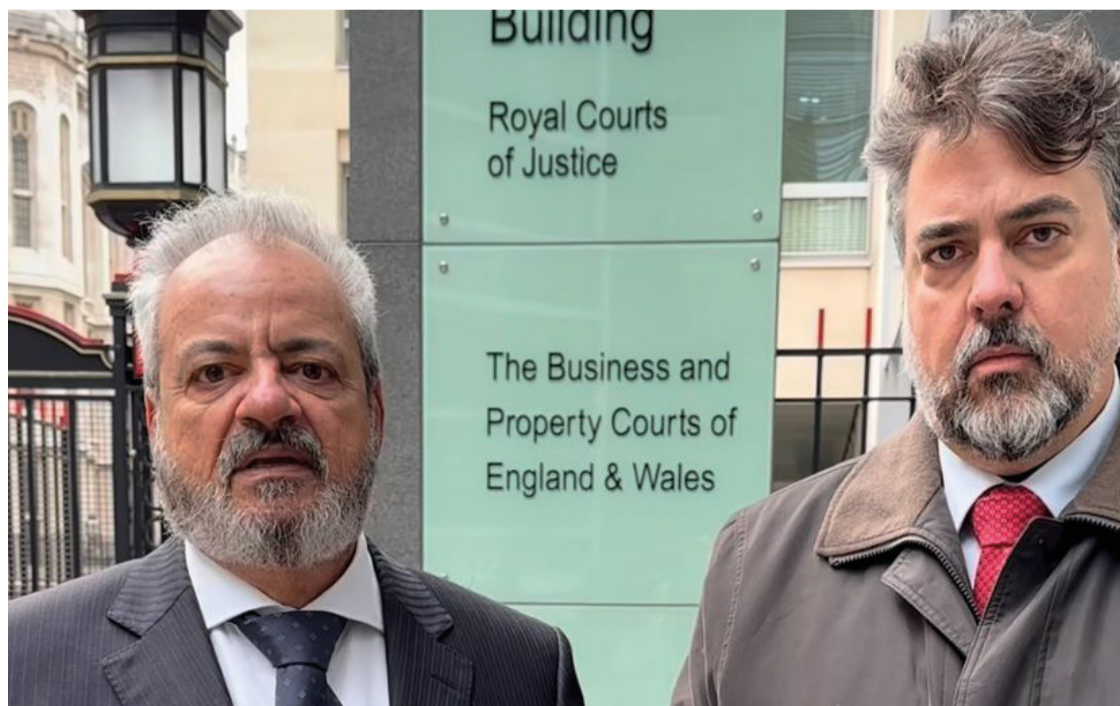
Durante as audiências, a Corte negou o pedido das empresas para adiar o início do julgamento.

Entenda o caso: Desde 2018, a BHP enfrenta na Inglaterra a maior ação coletiva ambiental do mundo relacionada ao rompimento da barragem do Fundão, em Mariana. A corte inglesa confirmou a jurisdição do caso em 2022. A Vale, por sua vez, também responderá pelo pagamento de eventual condenação, e as duas empresas deverão arcar com parte das indenizações, que atualmente somam R$ 230 bilhões (US$ 44 bilhões), incluindo juros.