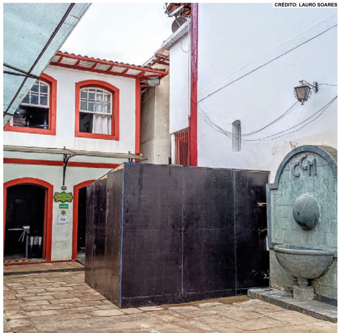
A caixa d'água será decorada com temas relacionados ao carnaval.

O SAAE destaca que, após o término das festividades de carnaval, a caixa d'água será prontamente removida, garantindo a preservação do patrimônio histórico e arquitetônico da região. A instalação provisória tem o objetivo de atender às necessidades de abastecimento de água somente durante o período festivo, sendo uma solução temporária para garantir o conforto dos foliões e visitantes.