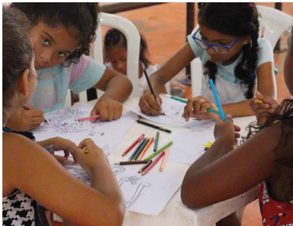
Cerca de 350 crianças e adolescentes, entre 6 e 17 anos, participaram.

A Colônia de Férias da Secretaria de Esportes ofereceu alternativas saudáveis e divertidas para crianças e adolescentes durante o período de recesso escolar, incentivando a prática esportiva e a socialização entre os participantes.