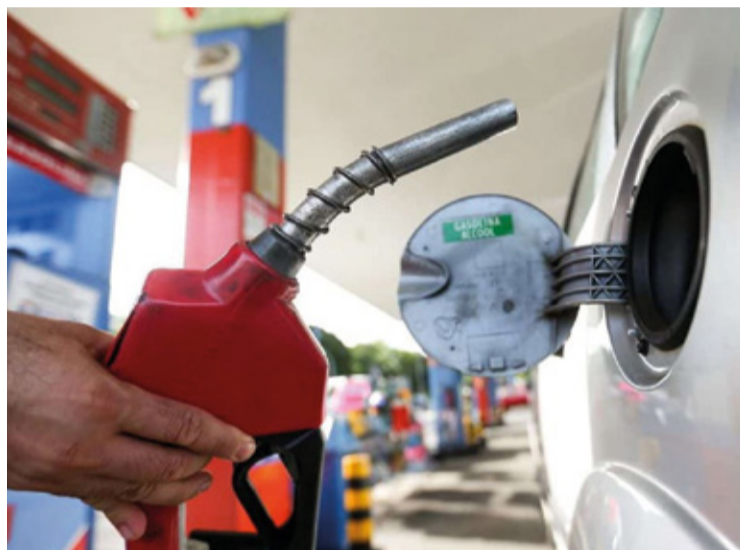
As alterações resultarão em aumentos nos preços da gasolina, do diesel e do botijão de gás.

gerar impactos no orçamento familiar, exigindo planejamento diante do cenário de constantes variações nos preços dos combustíveis e do gás de cozinha.