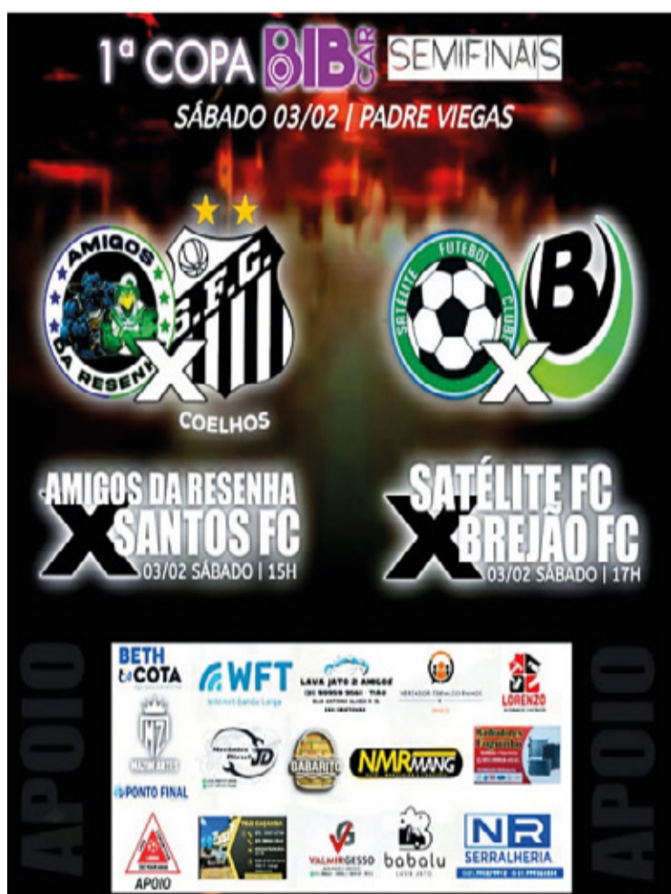
Os times classificados para a próxima fase da Copa.

FUTEBOL. Agora o torneio segue com a fase mata-mata; quem perder dá adeus ao campeonato.