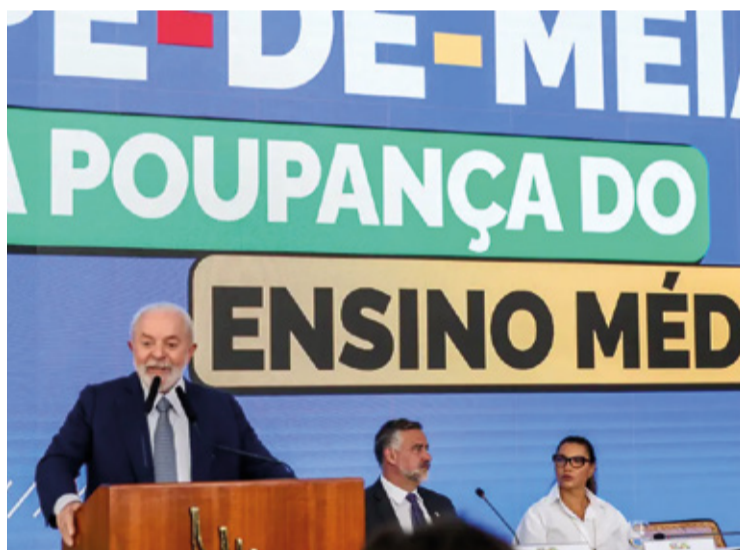
O Presidente Lula na apresentação do programa.

EDUCAÇÃO. A iniciativa visa a conclusão do ensino médio e diminuir a evasão escolar.