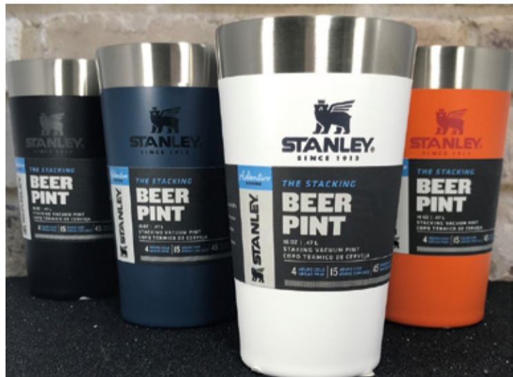
A Stanley, em nota, assegurou que a área onde o metal está presente é inacessível aos consumidores.