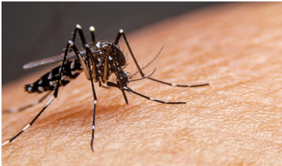
A rápida disseminação da doença levou o estado a decretar situação de emergência

Serão vacinados crianças e adolescentes de 10 a 14 anos, faixa etária que concentra um dos maiores números de hospitalizações por dengue. A primeira remessa, com cerca de 757 mil doses, chegou ao Brasil no último dia 20. O lote faz parte de um total de 1,32 milhão de doses fornecidas pela farmacêutica. Outra remessa, com mais de 568 mil doses, está com entrega prevista para fevereiro.