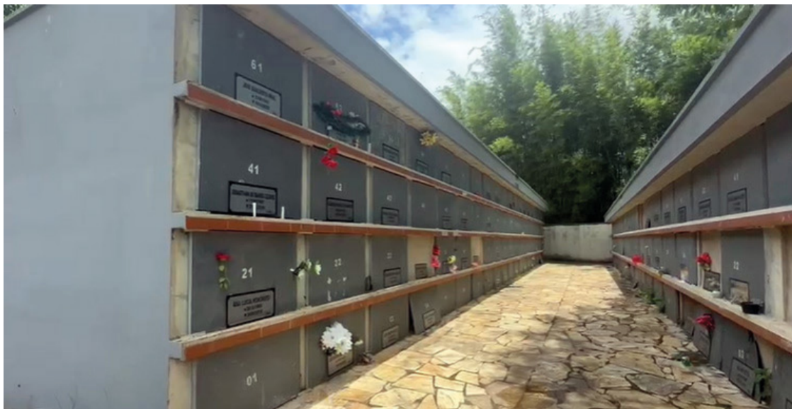
Em caso de não comparecimento de nenhum familiar dentro do prazo estipulado, os restos mortais serão sepultados no ossário coletivo localizado no próprio cemitério.

Para obter mais informações, os interessados podem entrar em contato pelo telefone 031 3558-5381.