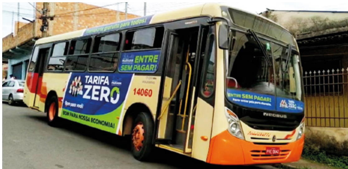
São 6 linhas urbanas e 13 distritais.

Na sessão para a votação da Lei, a prorrogação foi aprovada por unanimidade na Câmara Municipal, porém os(as) vereadores(as) enfatizaram