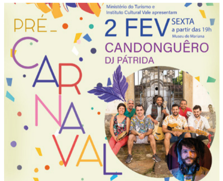
A celebração contará com a presença da banda Candonguêro, originada em Ouro Preto, e do DJ Pátrida.

No Museu Boulieu, a festa será ainda mais animada com a participação do Bloco do Mesclado, que, com seus 27 anos de tradição, traz uma proposta única para os amantes da boa música, fugindo dos ritmos carnavalescos tradicionais e promovendo uma celebração que mescla ritmos, culturas e emoções.