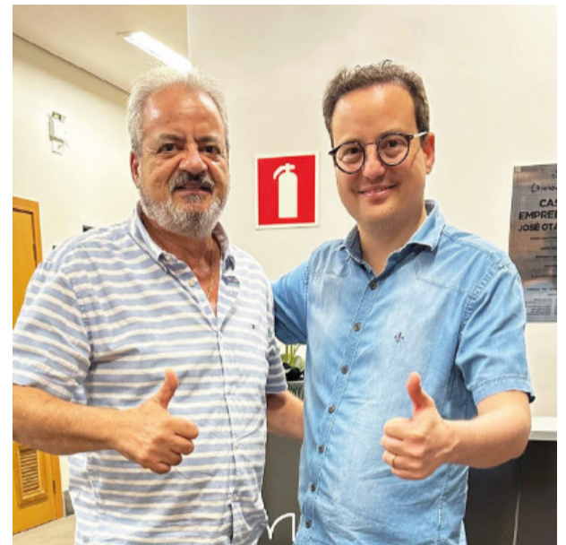
Vínculo sólido, comprometimento com Mariana. O Prefeito Celso Cota e o Deputado Estadual Thiago Cota, pai e filho, unem forças para promover o progresso e o bem-estar em nossa cidade.