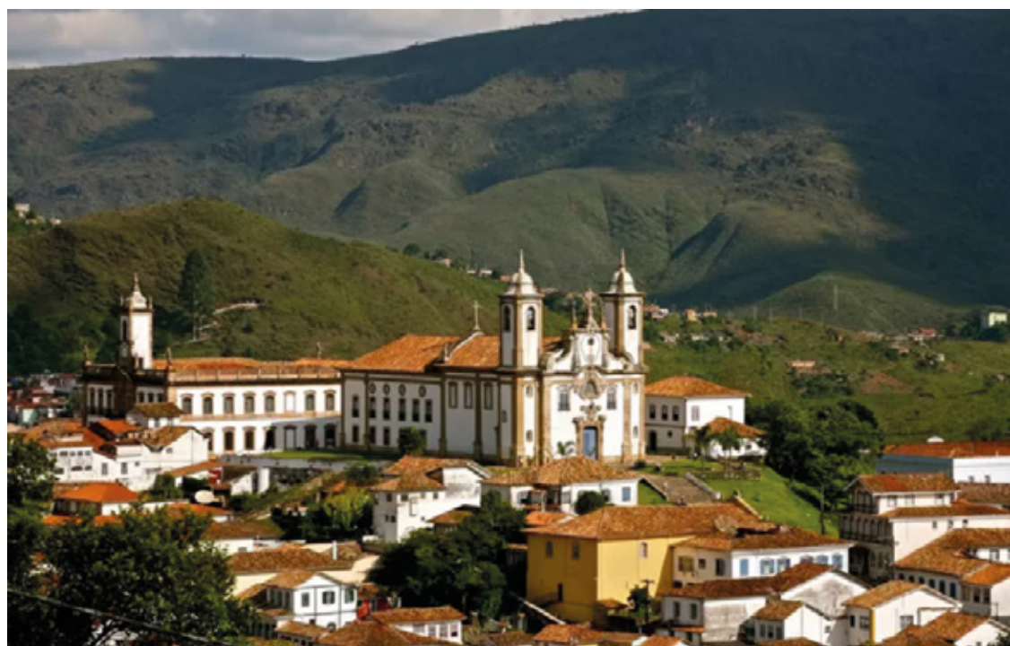
De acordo com a Secretaria de Estado de Cultura e Turismo (Secult-MG), esse crescimento impulsionou uma movimentação econômica de 34 bilhões em todo o Estado

O IBGE aponta que o crescimento nas atividades turísticas é resultado do aumento no volume de turistas utilizando serviços de empresas dos ramos de locação de automóveis, restaurantes, serviços de bufê, hotéis, agências de viagens, transporte aéreo e rodoviário ao longo de 2023. Em Minas, a ocupação hoteleira é uma evidência clara desses números positivos.