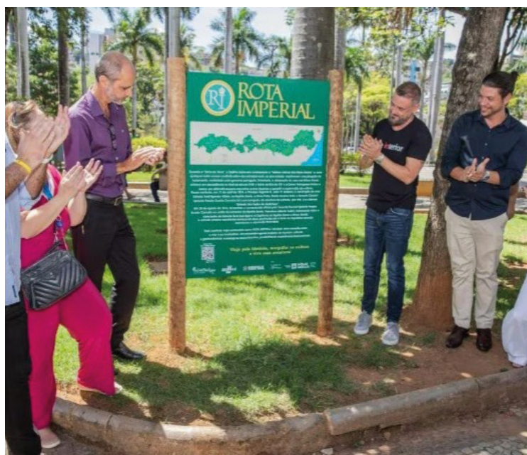
No passado foi trilhada pelo imperador Dom Pedro II.

RECONHECIMENTO. Sete municípios, e suas zonas rurais, receberão cerca de 400 placas de sinalização até o final de fevereiro.