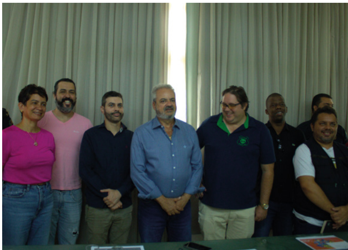
A coletiva foi no prédio da Prefeitura de Mariana, com a presença massiva da imprensa local.