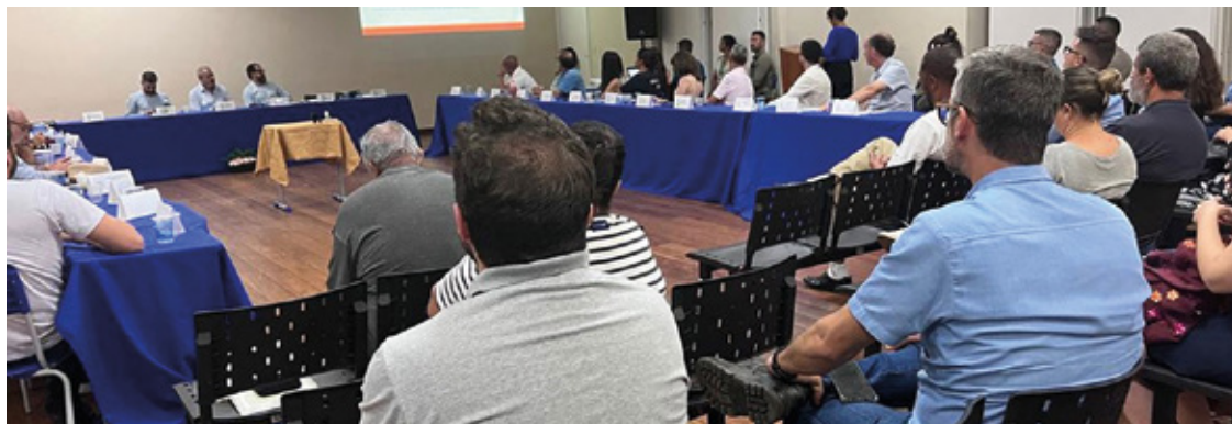
A votação da Declaração de Conformidade, responsabilidade do Codema, contou com 12 votos favoráveis, dos 14 proferidos.

O Compat, por sua vez, absteve-se de votar e planejou posicionar-se sobre o assunto em uma nova reunião. Entre as condicionalidades estabelecidas para garantir a segurança da atividade