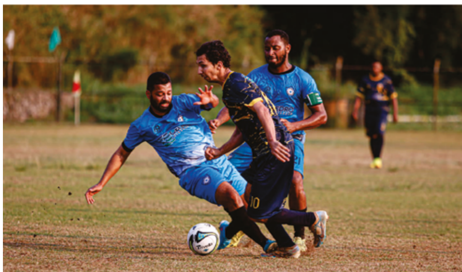
Todos os times da Série A de Mariana levam a marca da Cedro como apoiadora do campeonato

Mineradora é reconhecida por atuação na cidade e por patrocinar os uniformes de todos os 14 times da Série A do Campeonato Marianense