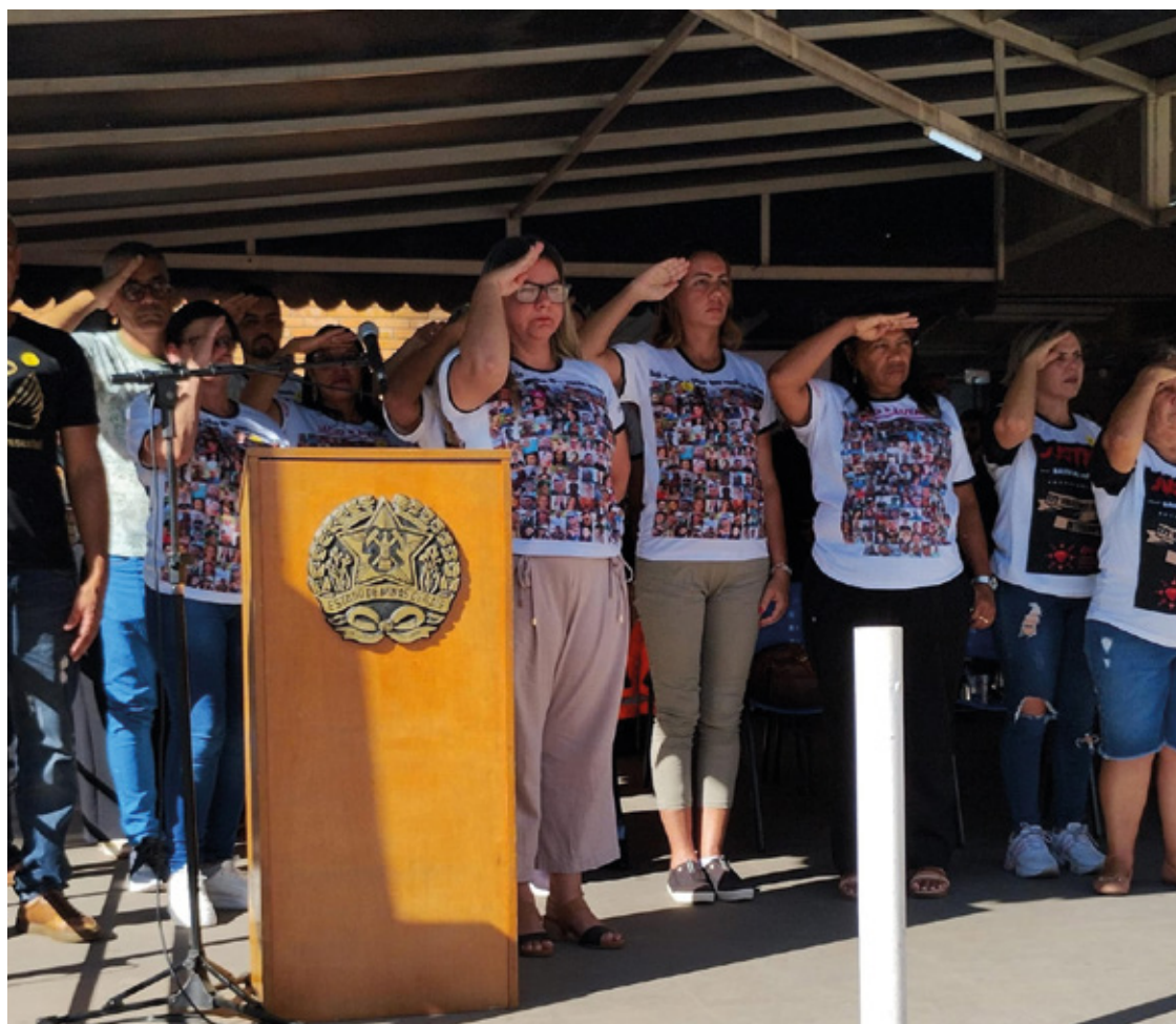
A cerimônia foi permeada por um tom de ressignificação da vida, destacando a busca por transformar a tragédia em ações que valorizem e preservem vidas.

A cerimônia foi permeada por um tom de ressignificação da vida, destacando a busca por transformar a tragédia em ações que valorizem e preservem vidas. Andresa e os demais familiares presentes prestaram uma emocionante continência aos bombeiros no final do evento, simbolizando respeito e gratidão à corporação que desempenhou um papel fundamental na resposta à tragédia.