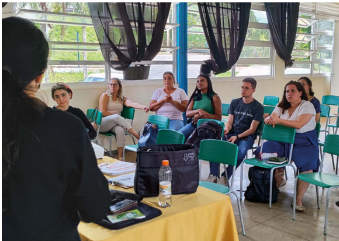
Ao longo dos dias 15 a 17 de janeiro, os cinco integrantes participaram de sessões de treinamento.

Os novos membros, eleitos por voto popular em 2023, assumiram oficialmente no último dia 10. As capacitações, que visam potencializar os serviços ao longo do ano, serão oferecidas de forma contínua, promovendo o desenvolvimento contínuo e aprimoramento das habilidades dos profissionais.