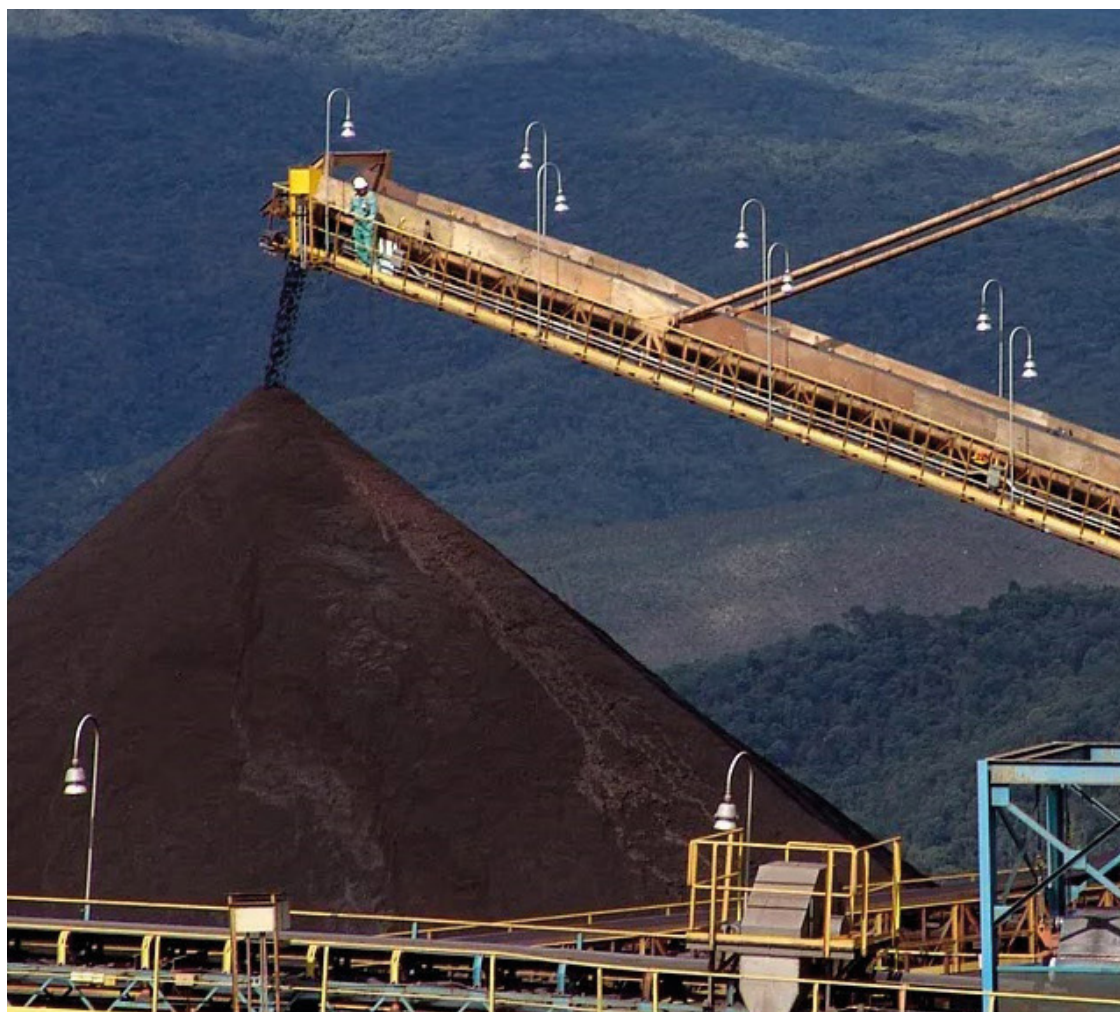
Minas Gerais recebeu R$ 39.634.981,42 correspondentes à cota-parte da Compensação Financeira pela Exploração Mineral (CFEM).

pela Constituição de 1988, representa uma contrapartida financeira paga pelas empresas mineradoras aos estados, Distrito Federal e municípios pela exploração econômica dos recursos minerais em seus territórios. Desde 2017, a CFEM é calculada com base no faturamento bruto das empresas que exploram minerais no Brasil, resultando em um aumento nos repasses para estados e municípios, crescendo de R$ 1,8 bilhão em 2017 para R$ 3 bilhões em 2022, conforme estudo da revista Brasil Mineral em parceria com o Brasil 61, divulgado em agosto deste ano.