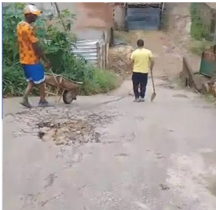
O ato dos moradores demonstra a frustração com a falta de atenção do poder público.