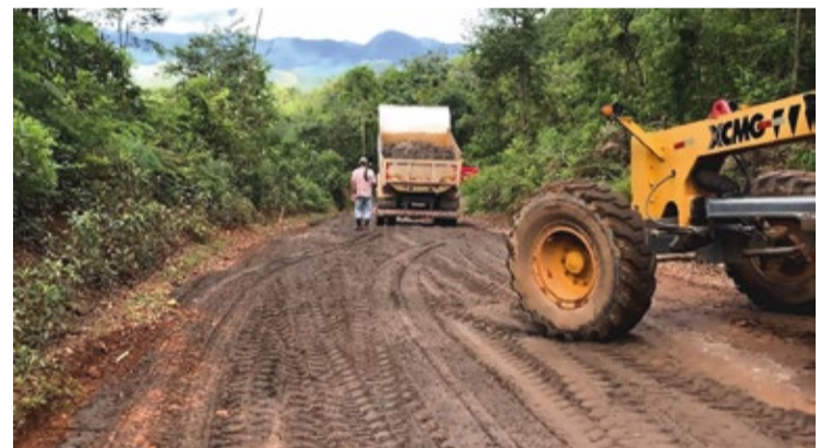
No último dia (5), foi concluída a manutenção em um trecho estratégico que liga os subdistritos de Mainart a Vargem.

No dia 5 de janeiro, foi concluída a manutenção em um trecho estratégico que liga os subdistritos de Mainart a Vargem, ambos pertencentes a Padre Viegas. Essa medida visa não apenas manter a trafegabilidade nessas áreas rurais, mas também garantir o acesso e a conectividade entre comunida-