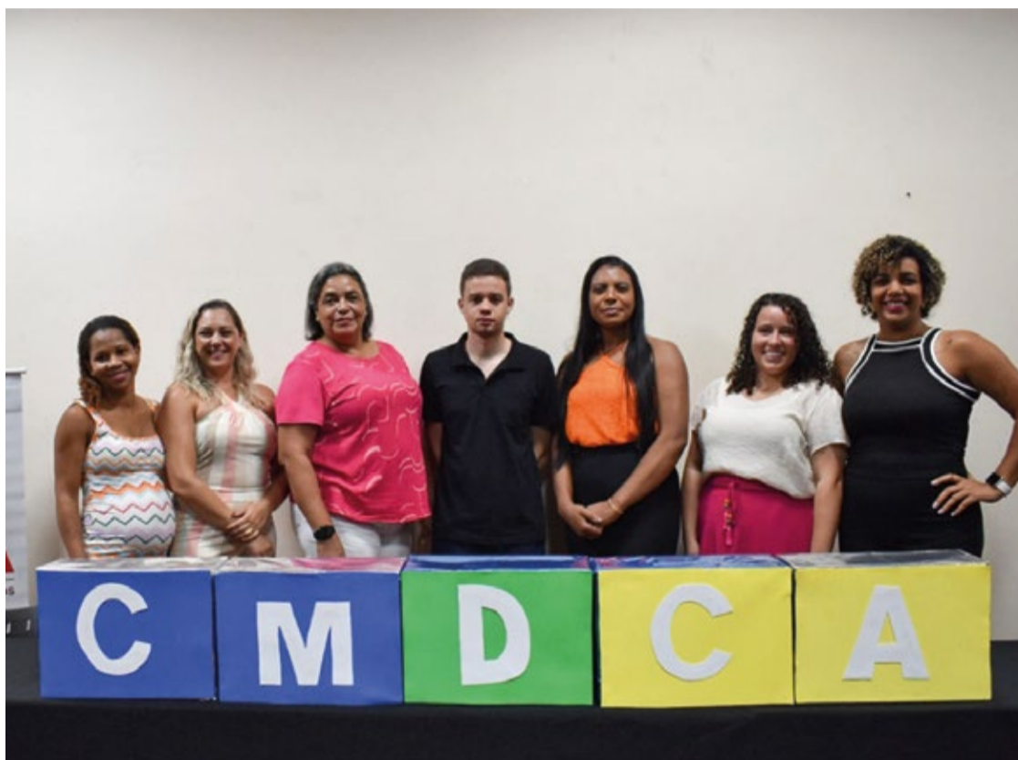
O Executivo Municipal conduziu a cerimônia de posse dos cinco novos conselheiros tutelares, realizada no Centro de Convenções.

Os trabalhos já começaram com um plano abrangente de capacitações para os novos conselheiros. No último mês, foram abordadas