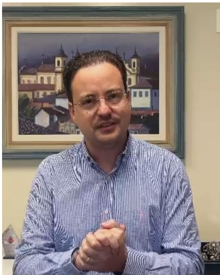
O Deputado Estadual Thiago Cota em resposta ao Jornal Ponto Final.

“No momento certo, nós iremos discutir as pré-candidaturas do nosso grupo. É um grupo forte! Um grupo repleto de companheiros que estão na Câmara. [...] Estarei sempre a serviço da nossa cidade, seja onde for. Por isso, no momento certo, estaremos discutindo qual será nossa posição”.