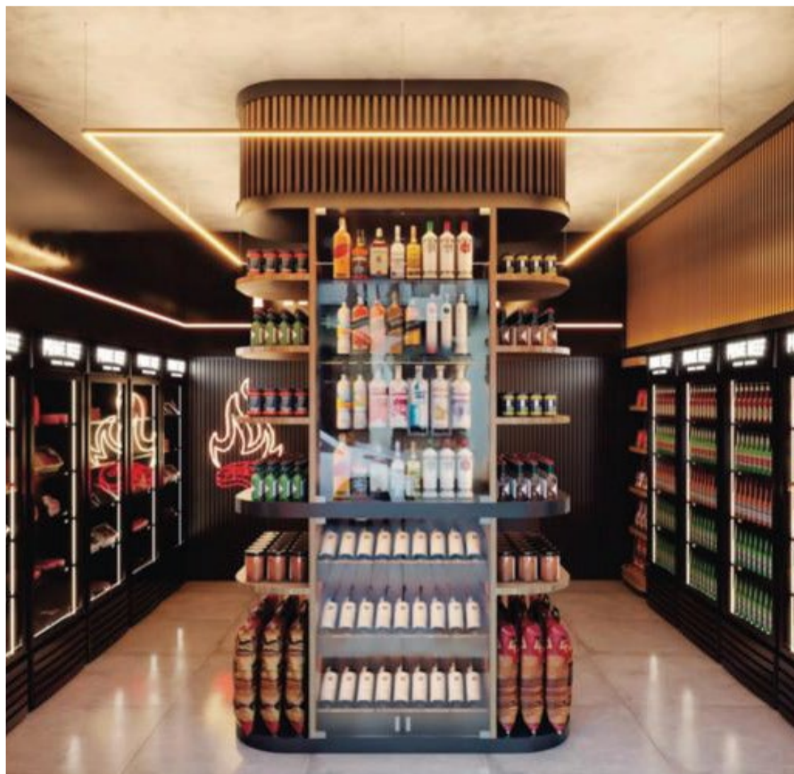
A inauguração está marcada para a próxima semana.

A Prime Beef espera proporcionar uma experiência única aos clientes, reforçando sua posição como referência no ramo de boutique de carnes na região. Com uma abordagem inovadora e determinação, a equipe está confiante de que a nova loja será um sucesso e continuará a conquistar paladares exigentes com a qualidade e sabor que já são marcas registradas da Prime Beef.