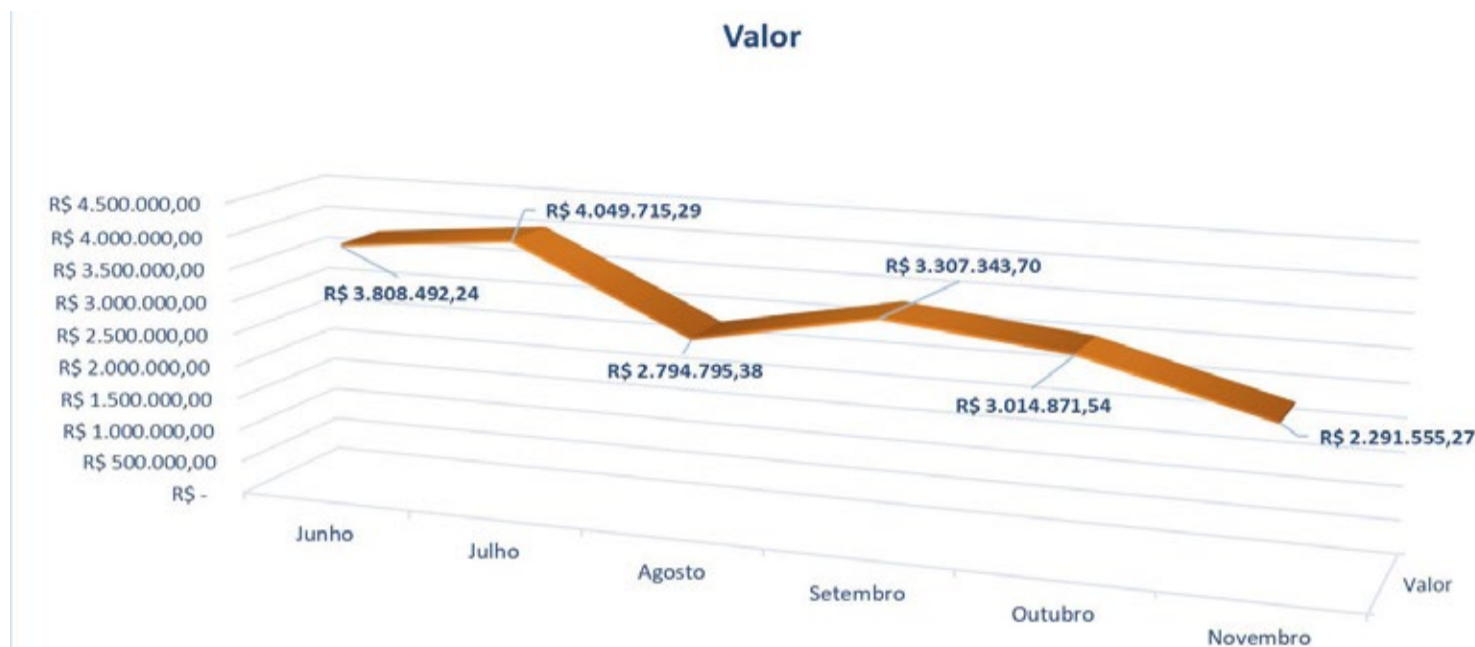
Tabela de gastos da cooperativa de transporte de junho a novembro de 2023.

PRESTAÇÃO DE CONTAS. Em comparação aos meses de junho e novembro a redução de gastos foi expressiva.