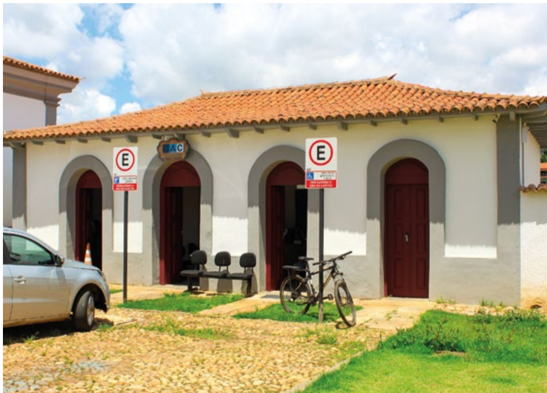
CAC fica localizado no anexo do prédio histórico da Câmara de Mariana.