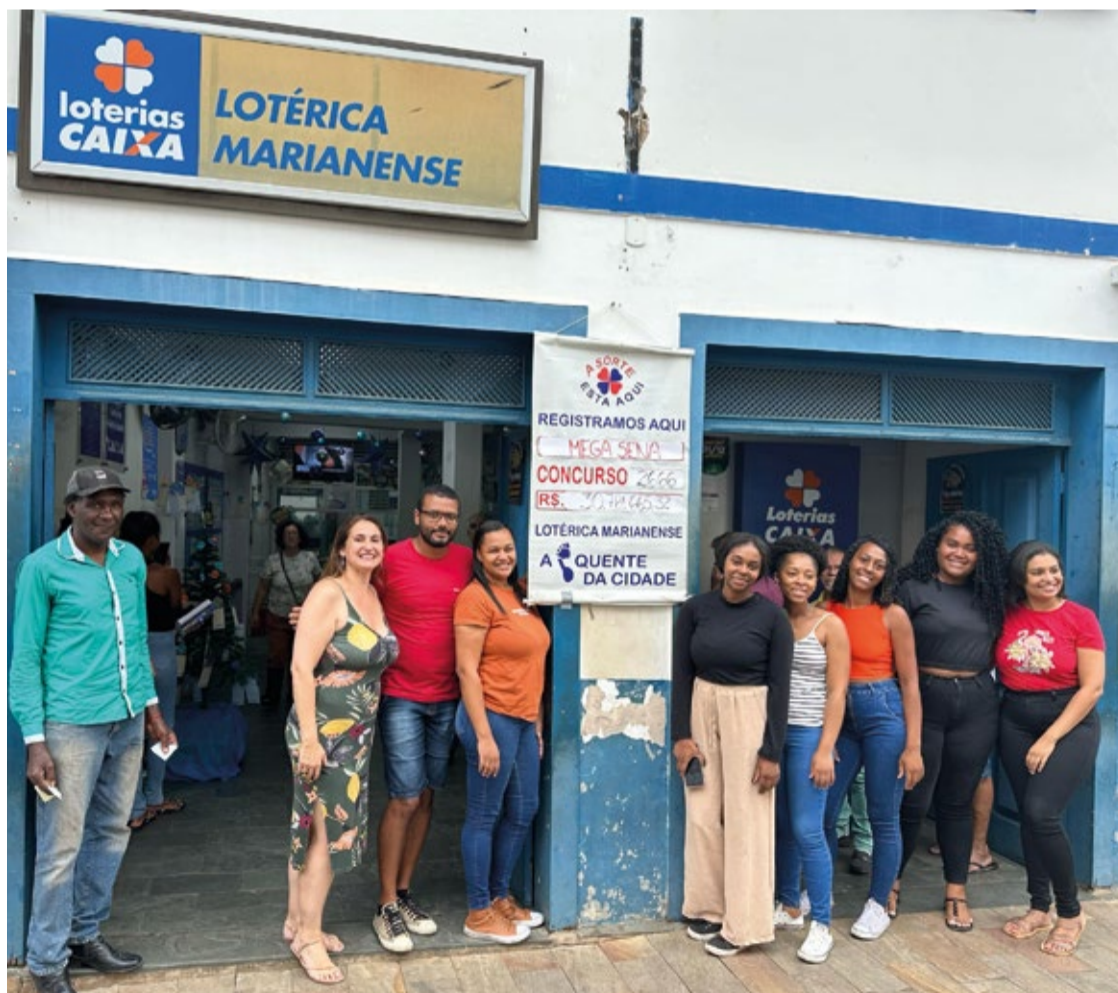
A equipe da Lotérica Marianense, em frente à loja.

“Cada modalidade tem um valor. A quina, jogo simples com 5 números, é R$ 2,50, e com 6 números, R$ 15,00. A mega, jogo simples com 6 números, sai a 5 reais e com 7 números, a trinta e cinco. Quando você faz um jogo com mais números, o valor do prêmio também é diferenciado. No caso da mega com 7 dezenas, se você acerta 4 números você recebe o valor de 3 quadras...E foi isto que aconteceu com o ganhador da quina, ele fez jogo combinado com 6 dezenas, aí ele recebeu valor maior.”