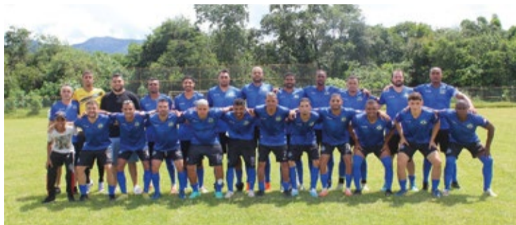
Equipe ouropretana Satélite, que aplicou uma goleada de 6x0.

A rodada inaugural da Primeira Copa Bib Car foi repleta de gols e com ambiente tranquilo para torcedores e famílias. Não deixem de prestigiar este campeonato que mostrou ter seriedade e emoção já em seu cartão de visitas.