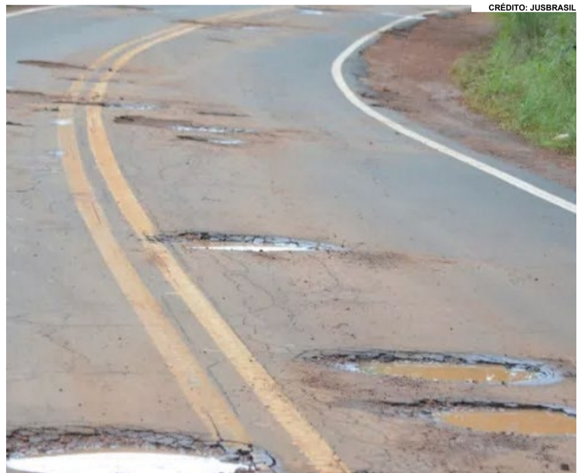
Buracos em toda extensão da rodovia.

Vale ressaltar que os pontos considerados críticos são: erosão, com 181 unidades; buracos grandes com 103; quedas de barreiras contabilizadas em 97 locais e pontes estreitas ou caídas, que juntas somam 14 casos.