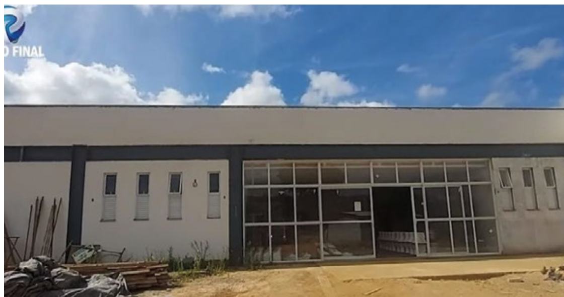
A UPA tem previsão de inauguração até abril de 2024.

EVOLUÇÃO. O Prefeito afirmou que o próximo ano será revolucionário para a saúde do município.