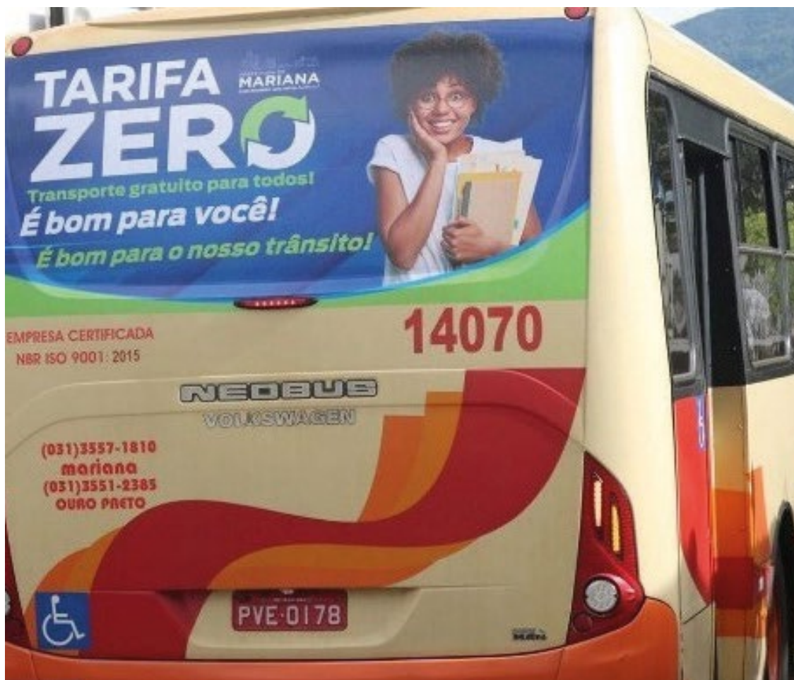
Uma das principais preocupações é a segurança, devido à superlotação causada pela procura aumentada.

A entrevista revelou que a implementação do Tarifa Zero não apenas impactou positivamente o transporte público, mas também influenciou outras formas de locomoção na cidade, como o crescimento dos aplicativos de carros.