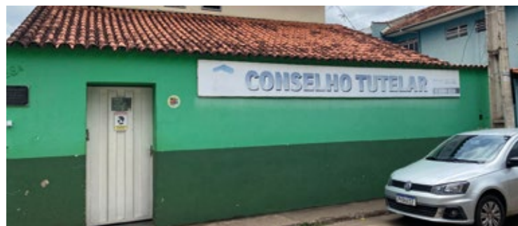
O Conselho Tutelar não atua em questões de guarda, ações alimentícias, busca de crianças desaparecidas, ou atos infracionais por adolescentes.

Articulação com Outros Equipamentos Sociais: O Conselho Tutelar integra um sistema amplo na efetivação e garantia de direitos, não sendo o único responsável pela proteção da criança e do adolescente. Outros equipamentos sociais, como escolas, unidades de saúde e CRAS, também desempenham papéis fundamentais. Cada um atua em sua esfera