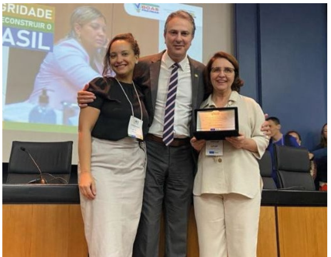
A premiação aconteceu na abertura do 1º Seminário Anual de Controle Interno do MEC.

Na cerimônia, o Ministro de Estado da Educação, Camilo Santana, parabenizou todos os vencedores das 12 iniciativas — do MEC e de autarquias, empresas públicas, universidades e institutos federais. “A educação é feita por todos nós, do esforço de cada profissional na universidade, no instituto, no município e no estado. Cada agente público dentro do seu estado, do seu espaço, enfrentando as limitações e desafios, tem o potencial de fazer melhor, promover a qualidade e tornar o processo educativo cada vez mais aprimorado, para que a educação seja o que o Brasil deseja e precisa”, afirmou