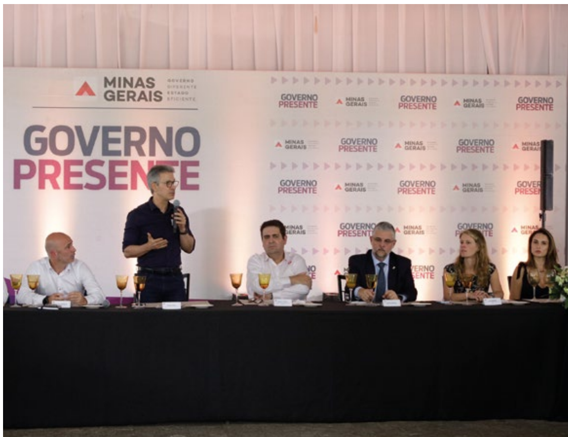
O secretário de Estado de Governo, Gustavo Valadares, pediu a união dos prefeitos para o sucesso da renegociação.

Valadares garantiu que as promoções e progressões na carreira dos servidores já foram previstas no plano enviado ao Tesouro Nacional e reforçou a continuidade dos avanços dos funcionários públicos, além da possibilidade de concursos no futuro.