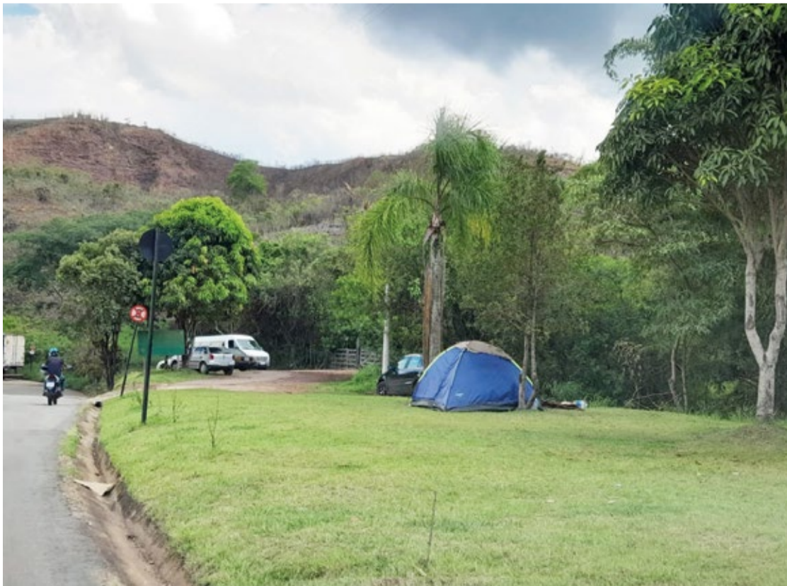
Muitas pessoas de várias regiões do país estão vindo para a cidade com esperança de emprego, e quando não encontram passam a viver em situações precárias.

O Requerimento 344/2023 está programado para ser debatido em uma reunião na Câmara Municipal nas próximas semanas, e as expectativas são de que as autoridades, possam colaborar na busca de medidas eficazes para enfrentar a situação do aumento de moradores de rua na cidade.