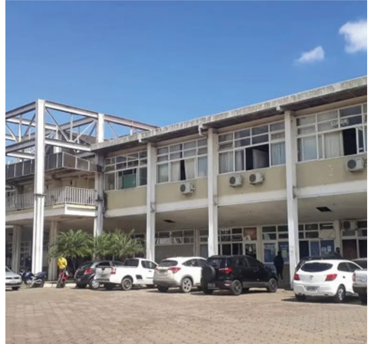
O Jornal Ponto Final não obteve resposta da Prefeitura até o fechamento desta matéria.

• Origem dos fundos: A arrecadação de 75 milhões de reais no mês de outubro inclui impostos, taxas, doações ou outras fontes de receita?