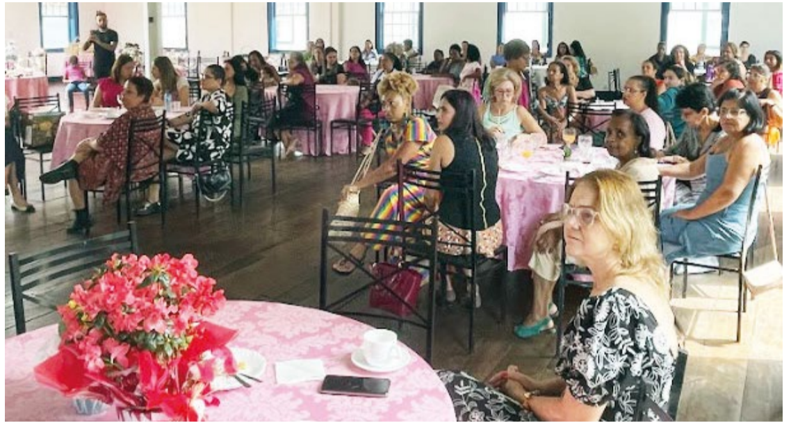
Um grupo de 70 mulheres se reuniu para celebrar a vida, criar soluções de negócios e consolidar com sucesso o Outubro Rosa.