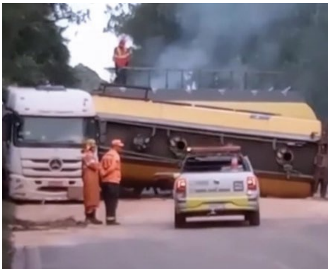
A carreta envolvida transportava 15 mil litros de óleo diesel, de acordo com informações do Corpo de Bombeiros.

Com o tráfego finalmente fluindo novamente, as autoridades continuam monitorando a situação na BR-040 para garantir a segurança de todos os motoristas e passageiros. A ocorrência serve como um lembrete da importância da prudência nas estradas e da necessidade de medidas adequadas para enfrentar situações de emergência como essa.