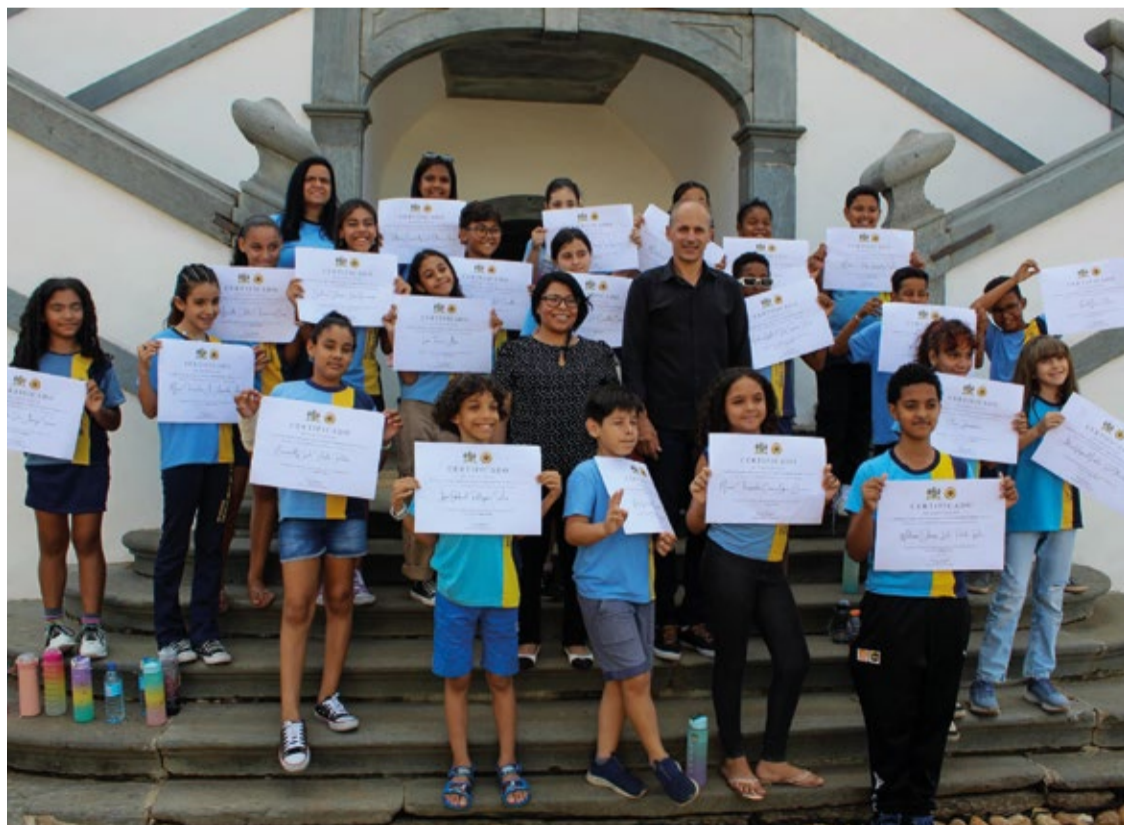
Os jovens legisladores apresentaram sugestões destinadas a despoluir o Ribeirão do Carmo, garantindo sua preservação para as gerações vindouras.

Os alunos da Escola Estadual Doutor Gomes Freire estão demonstrando que a preservação ambiental é uma causa de todos, independentemente da idade, e estão inspirando a comunidade a agir em prol do Ribeirão que tem um lugar especial no coração de Mariana.