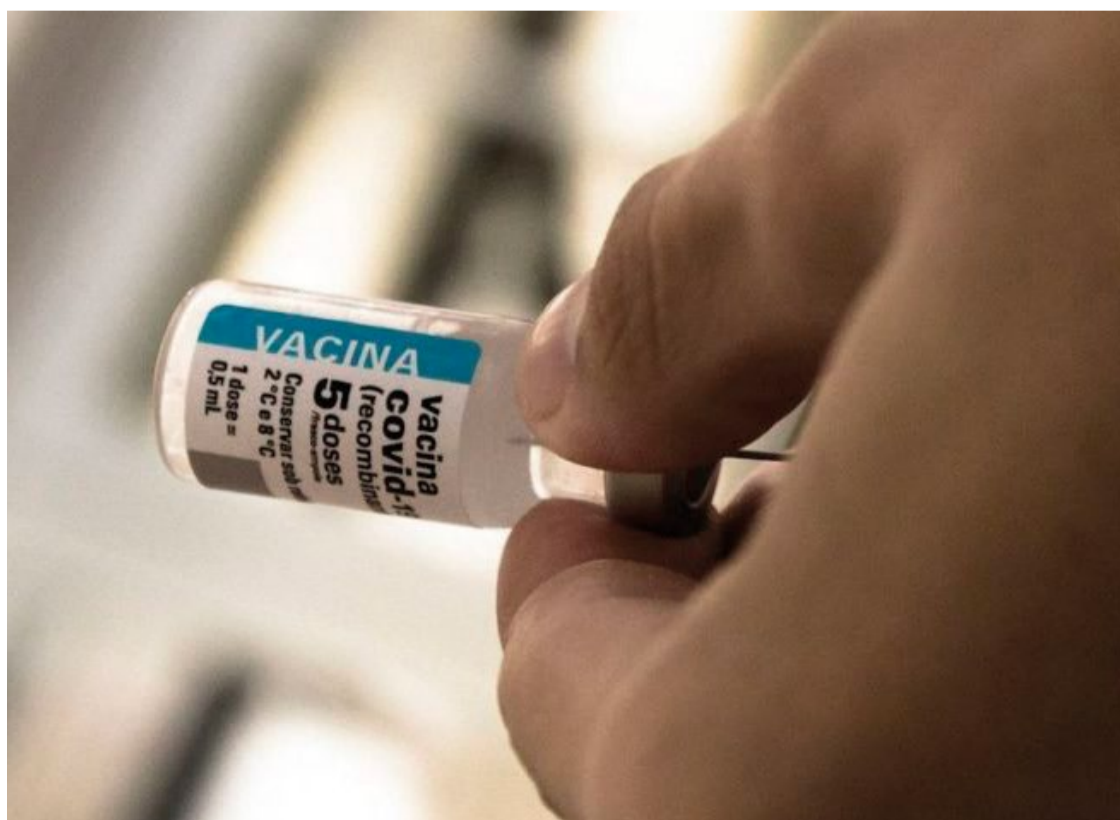
Essa decisão representa um marco importante na luta contínua contra a pandemia da Covid-19.

A inclusão da vacina contra a Covid-19 no Calendário Nacional de Vacinação é um passo importante na estratégia de enfrentamento da pandemia e uma demonstração do compromisso do Brasil em proteger a saúde de sua população. Com isso, o país se prepara para garantir que a imunização continue sendo uma ferramenta eficaz na preservação da saúde pública.