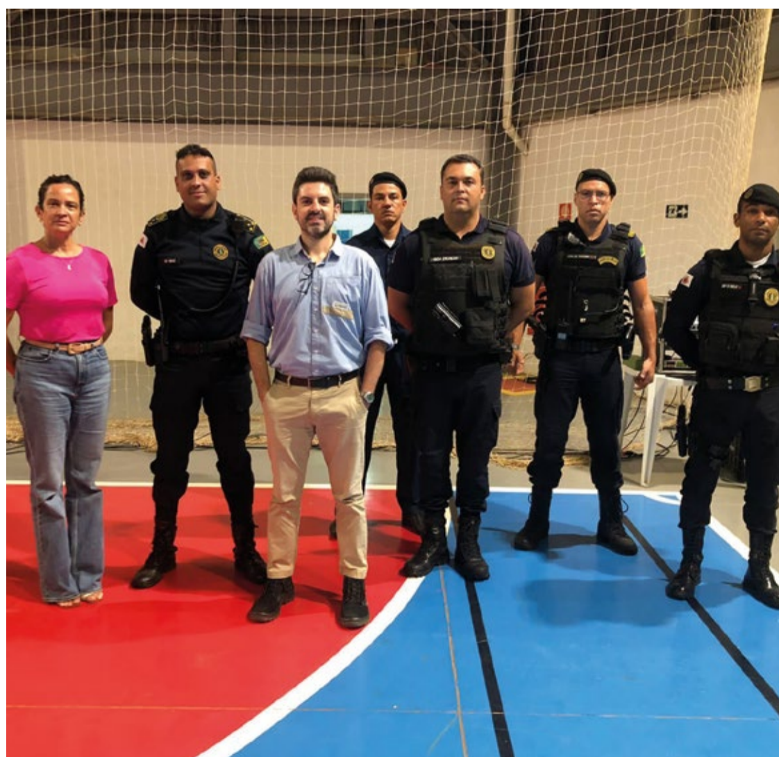
Essas reuniões estratégicas têm como objetivo envolver as famílias afetadas e o poder público na busca por soluções.

Novos encontros estão programados para ocorrer para que possa dar continuidade das discussões e a busca conjunta por alternativas que garantam o bem-estar da população de Bento Rodrigues durante a transição para os serviços públicos. A parceria entre a Fundação Renova, o município de Mariana e a comunidade é fundamental para garantir um processo de reassentamento tranquilo e bem-sucedido.