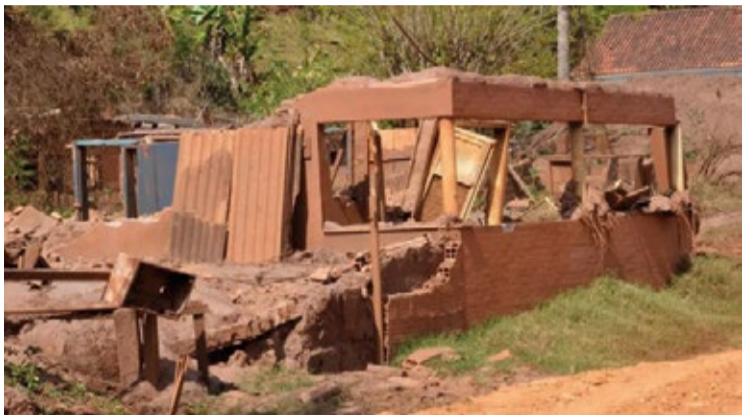
A Samarco reafirmou seu compromisso com as indenizações integrais dos danos causados.

ANTECIPAÇÃO. Seis instituições pedem julgamento antecipado do mérito em busca de solução para danos causados pelo rompimento da Barragem de Fundão.