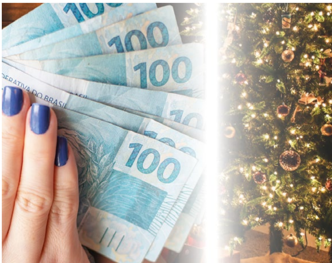
As despesas decorrentes dessa iniciativa já está previsto no orçamento vigente da Câmara Municipal.

Para garantir que essa concessão de benefícios seja realizada dentro das diretrizes orçamentárias do Município de Mariana, a Lei estabelece que o valor correspondente às despesas decorrentes dessa iniciativa já está previsto no orçamento vigente da Câmara Municipal.