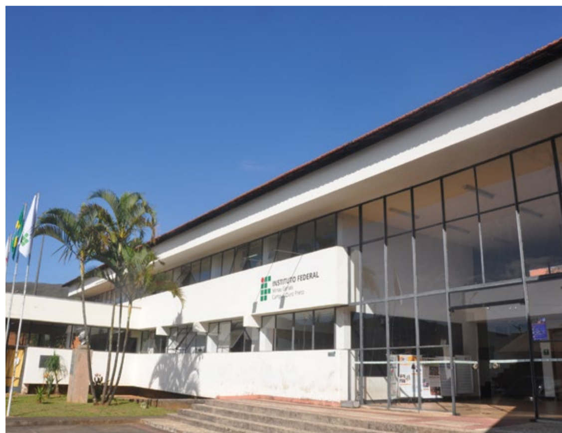
As aulas estão previstas para começar em 4 de abril de 2024.

Para mais detalhes sobre o processo seletivo, acesse o Edital nº 57/2023 no site www.ifmg.edu.br/ouropreto .