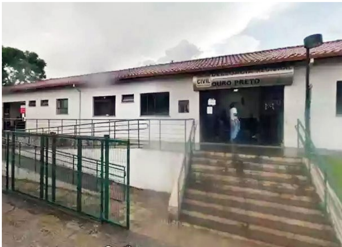
As investigações permanecem em curso, evoluindo uma investigação mais precisa do ocorrido.

Entretanto, as investigações permanecem em curso, evoluindo uma investigação mais precisa do ocorrido. O advogado enfatizou que só se pronunciará sobre o caso após a conclusão das investigações, com o intuito de evitar precipitações injustas.