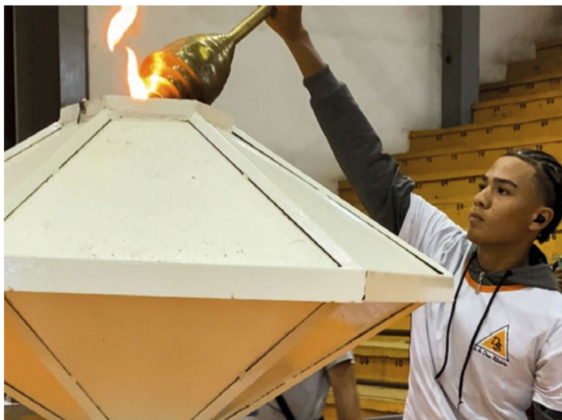
A cada ano, os Jogos Escolares de Mariana crescem, envolvendo mais escolas e mais alunos.