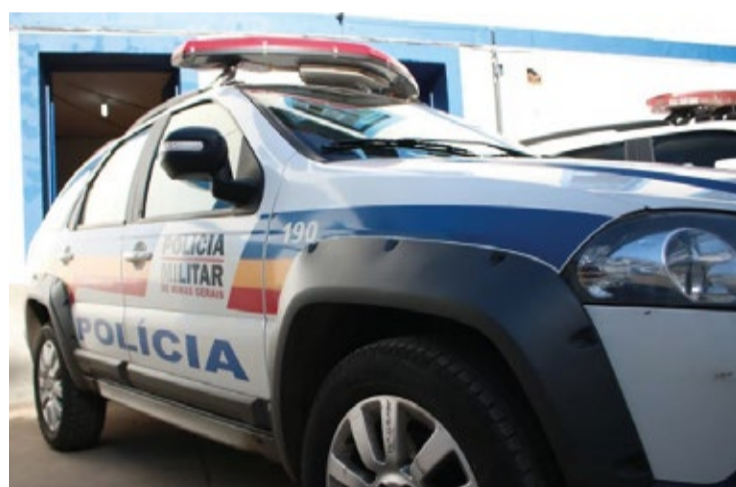
Ao ser abordado pelos policiais, o homem de 24 anos foi encaminhado a uma busca pessoal.

Além das drogas, os agentes verificaram a situação abordada em sistemas informatizados e constataram que havia um mandado de prisão preventiva em seu desfavor. Diante disso, o suspeito