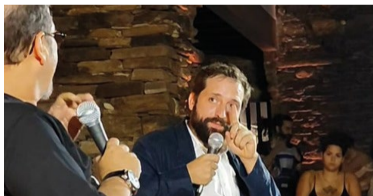
O Programa Sílabas e Sons tem se destacado por oferecer ao público a oportunidade de interagir com artistas renomados.