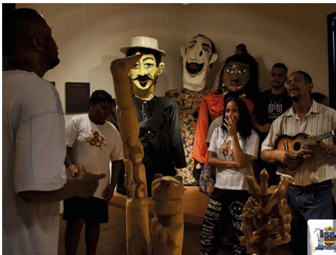
A iniciativa promove a valorização do patrimônio cultural.

HISTÓRIA. O espaço oferece uma rica imersão na história de Mariana, permitindo que os visitantes conheçam o passado da cidade.