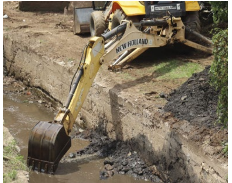
Profissionais capacitados estão dedicando seus esforços diariamente para atender às demandas da cidade.

cronograma de limpeza previamente estipulados pelos secretários responsáveis e continuam seguindo de maneira sistemática. A Prefeitura de Mariana incentiva a comunidade a acompanhar seus canais