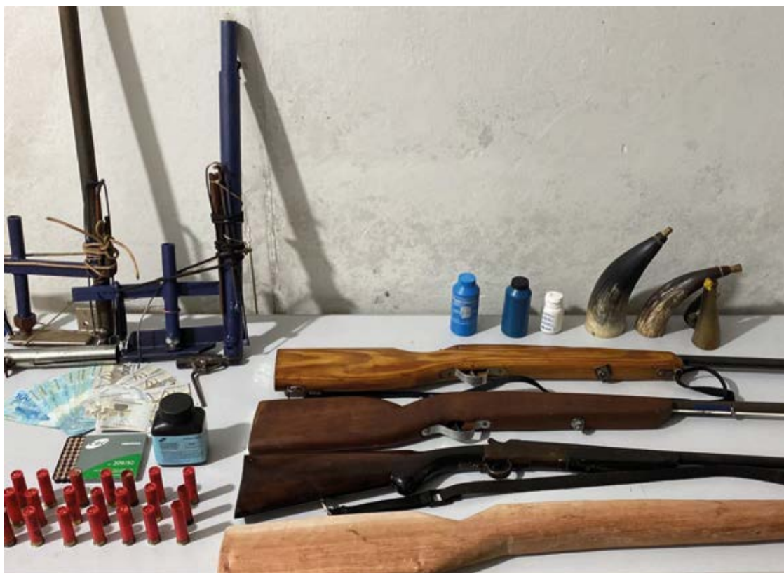
Segundo a denúncia, o local era utilizado para fabricação e venda de armas de fogo, além de abrigar aves silvestres em gaiolas.

Essa ação é mais um exemplo da importância das denúncias anônimas na luta contra o crime e na proteção do meio ambiente. A polícia reforça que a colaboração da população é fundamental para garantir a segurança e preservação da fauna e flora. Caso tenha informações sobre atividades ilícitas, denuncie através do 190, e contribua para um ambiente mais seguro e sustentável para todos.