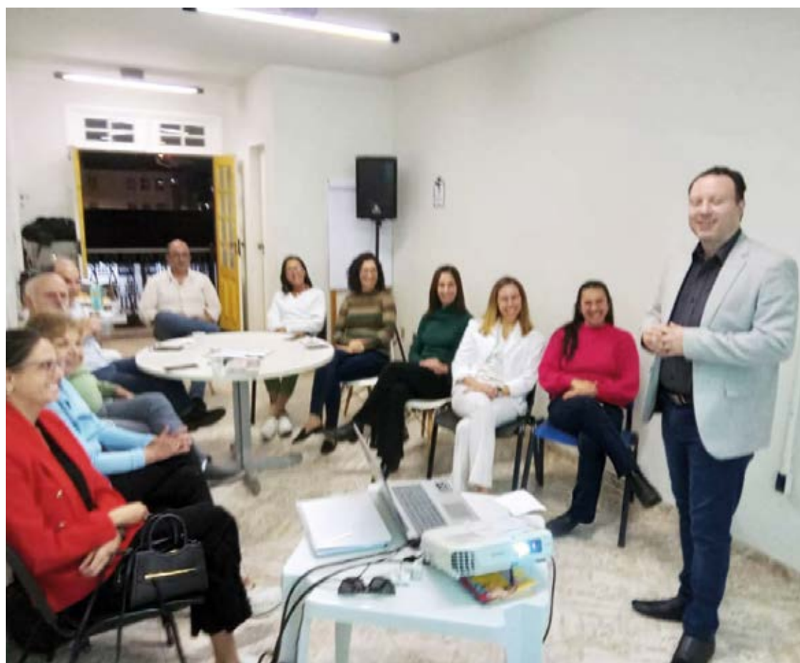
O encontro na ACIAM Mariana foi uma oportunidade para a diretoria conhecer de perto os detalhes do projeto e como ele pode contribuir para o cenário empreendedor da região.

Com a discussão de temas como Investimento Anjo, inovação e diversificação da economia, a ACIAM/CDL Mariana busca se posicionar como um ambiente propício para o crescimento das empresas e promoção da tecnologia na região, visando o progresso sustentável e o fortalecimento do mercado mineiro.