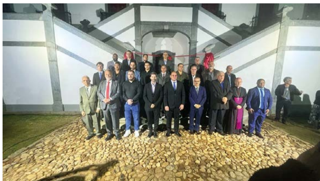
A cerimônia de reabertura da Câmara de Mariana, contou com a presença das autoridades local.

A reinauguração da Casa de Câmara e Cadeia de Mariana foi um momento de celebração e reafirmação do compromisso com a preservação da história e da cultura da cidade. O prédio histórico, agora restaurado e valorizado, escreve mais um capítulo importante na trajetória da região, mantendo-se vivo como um patrimônio a ser apreciado pelas gerações futuras.