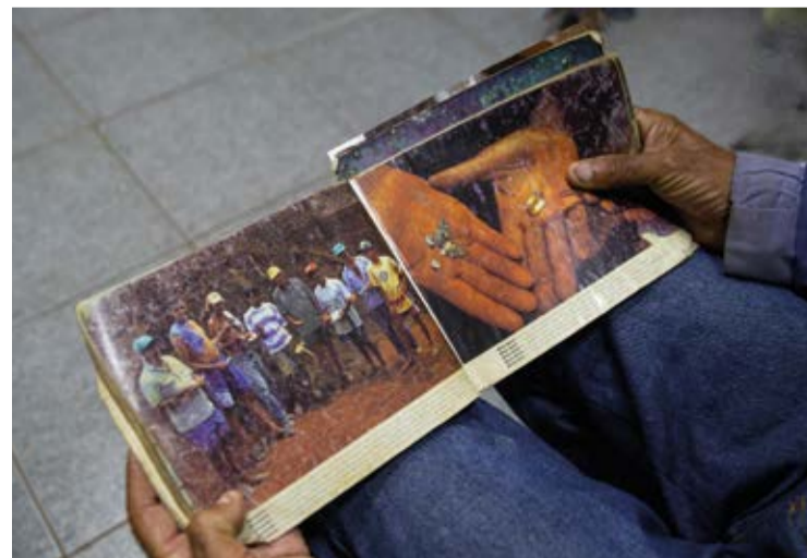
A busca por justiça e a preservação do território do Alto Rio Doce ganham força com essa demanda.