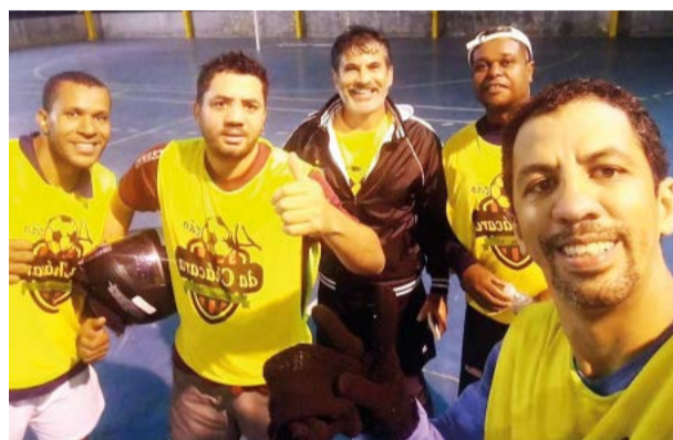
Quem tem batido um bolão, é o time Os Quarentões da Chácara. Será que tem bom de bola aí mesmo?! rrsrs...