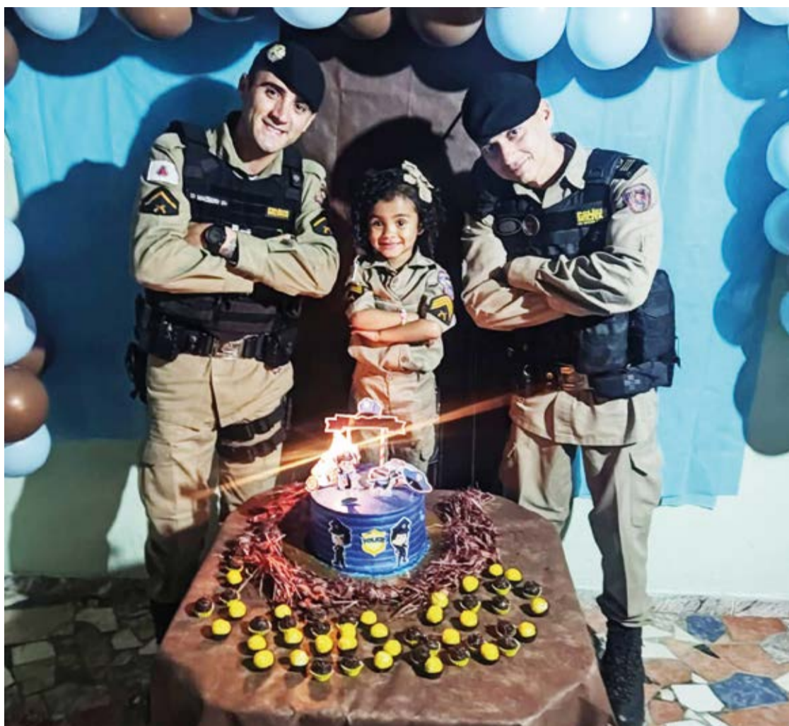
A menina se divertiu tirando fotos com os policiais.