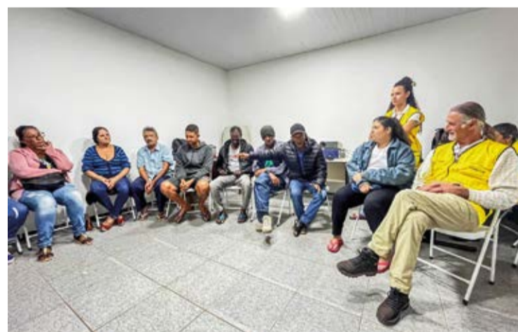
A reunião para a entrega da carta ocorreu na última quinta-feira (27), e a comunidade garimpeira de Antônio Pereira

nidade e tem um papel importante na geração de renda familiar e subsistência há centenas de anos. O Instituto Guaicuy atua como Assessoria Técnica Independente das pessoas atingidas pelas obras de descomissionamento da Barragem Doutor desde dezembro de 2022, apoiando os garimpeiros tradicionais de Antônio Pereira na elaboração do documento entregue à CT-IPCT.