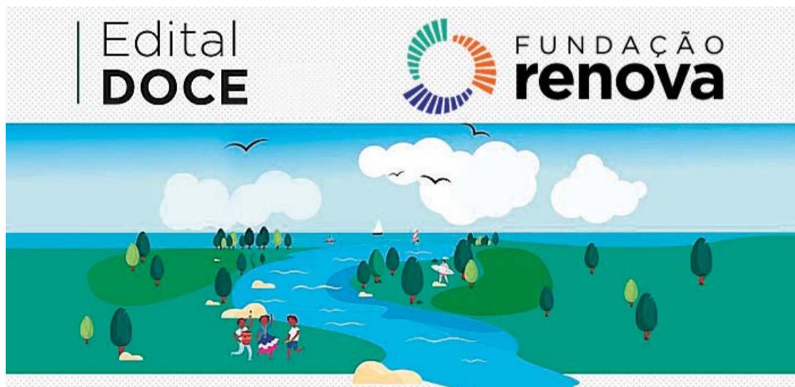
A Fundação Renova, responsável pelo edital, destinará até R$ 25 mil para pessoas físicas, R$ 60 mil para coletivos informais e até R$ 200 mil para os demais projetos.

A 1ª edição do Edital Doce, lançada em 2020, apoiou 228 projetos com um orçamento de R$ 13,5 milhões. Já a 2ª edição, lançada em 2022, contemplou 263 projetos com um orçamento de R$ 22,12 milhões. Atualmente, há projetos em andamento em Minas Gerais e Espírito Santo provenientes dessas edições anteriores.