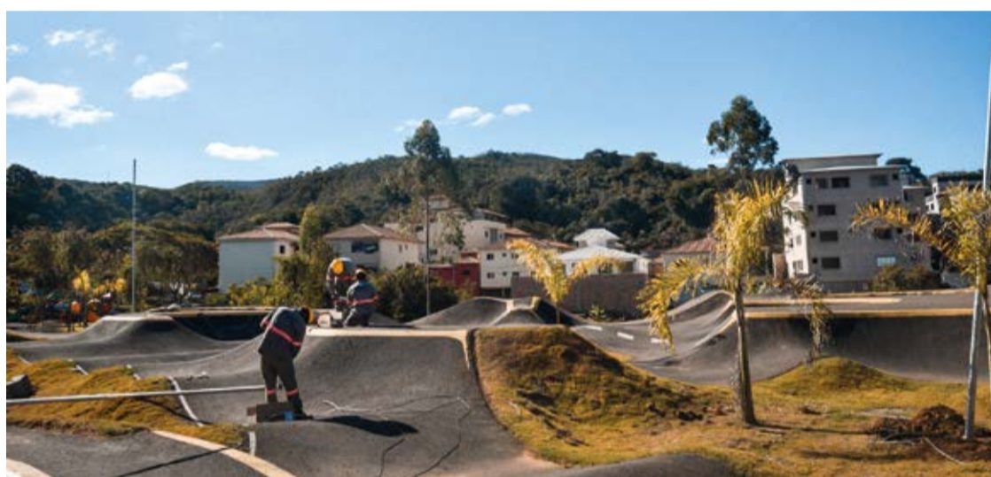
Foram instalados 16 postes e 21 luminárias, atendendo a uma demanda muito solicitada pelos praticantes do esporte.

da população no combate ao furto e vandalismo das luminárias, que são bens públicos e devem ser preservados. Para obter informações sobre o andamento dos pedidos e esclarecer dúvidas, a população pode entrar em contato pelo WhatsApp: (31) 99808-3027, no Departamento de Elétrica.