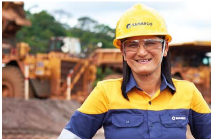
O programa é destinado a mulheres que residem em Mariana, Ouro Preto, Antônio Pereira, Santa Rita Durão.

O Programa Trainee Operadoras de Equipamento está entre as ações desenvolvidas no âmbito do Programa de Diversidade, Equidade e Inclusão (DE&I), criado no ano passado. A ação está alinhada ao propósito de fazer uma mineração diferente e atrelada à agenda ESG (sigla em inglês para ambiental, social e governança).