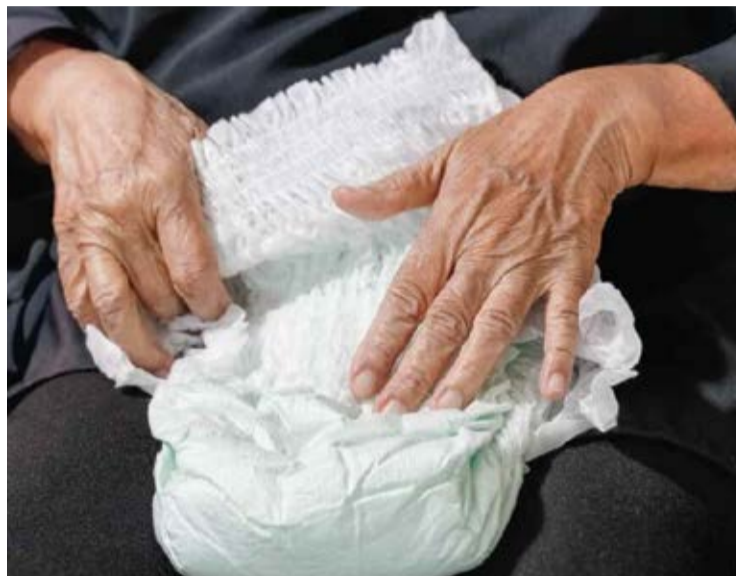
Os critérios para determinar a quantidade de fraldas geriátricas que cada pessoa deve receber normalmente são de 4 fraldas por dia.

É essencial garantir que todas as pessoas que necessitam desses produtos tenham acesso adequado e contínuo, levando em consideração suas condições de saúde e bem-estar. A população espera que o fornecimento seja regularizado dentro do prazo estabelecido pelo Secretário de Saúde, para assegurar que todos os usuários recebam a quantidade necessária de fraldas para sua higiene e conforto.