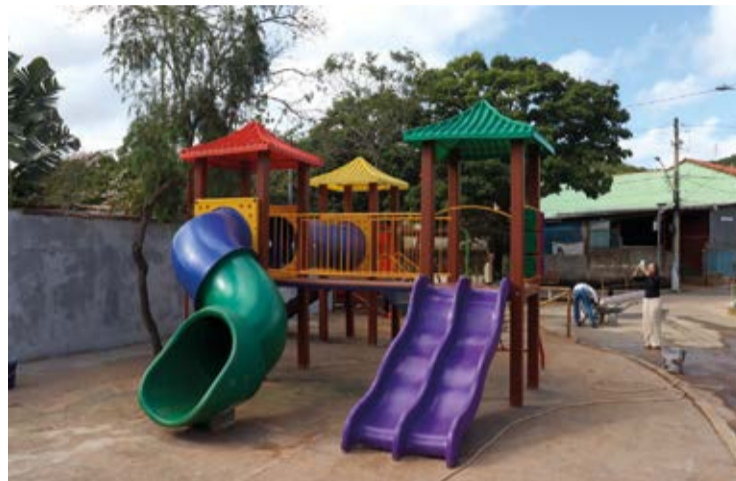
Entre os serviços executados, destaca-se a concretagem do novo piso e a instalação completa do playground.

Os funcionários estão empenhados em atender diariamente as demandas do cronograma, incluindo aquelas recebidas através do WhatsApp: (31) 99684-0783, onde os moradores podem enviar fotos e vídeos para facilitar a identificação das necessidades. Com base nas demandas, incluindo sugestões da população, é elaborado um cronograma que prioriza as ações a serem realizadas diariamente pelos profissionais em diferentes pontos do distrito.