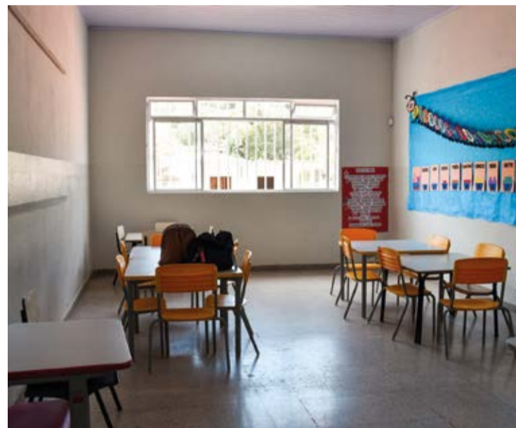
As reformas abrangeram diversas áreas dos ambientes

UPGRADE. Três instituições passaram por significativas alterações, visando proporcionar maior conforto e bem-estar para toda a comunidade escolar.