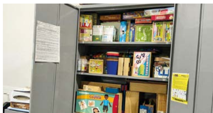
Através do Atendimento Educacional Especializado (AE), estratégias são elaboradas para promover a inclusão

Com um total de 180 alunos beneficiados, o Município de Mariana vem se destacando nessa modalidade educacional. Os segmentos do Atendimento Educacional Especializado incluem a Sala de Recursos, onde alunos com deficiência, TGD ou altas habilidades realizam atividades complementares ou suplementares ao horário regular das aulas. Na Sala de Recursos, os alunos têm a oportunidade de fortalecer habilidades como memória, atenção e concentração. Além disso, são oferecidos estímulos precoces e trabalhos na área sensorial para estudantes com Transtorno do Espectro Autista