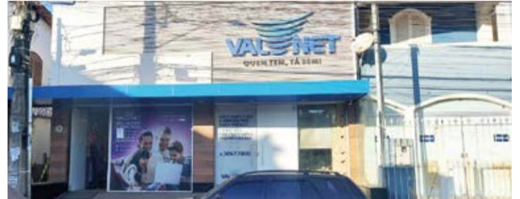
De acordo com relatos dos consumidores, a Vale Net não tem atendido adequadamente às demandas da população.

O Código de Defesa do Consumidor é uma ferramenta fundamental nesse contexto, garantindo os direitos dos consumidores e exigindo que as empresas forneçam serviços de qualidade. É imprescindível que a ValeNet e outras empresas do setor reconheçam a importância de fornecer uma conexão de internet confiável e eficiente, assumindo a responsabilidade pelo produto ofertado. A de-