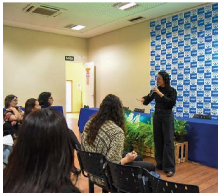
Durante a cerimônia de lançamento, o plano do programa foi apresentado, destacando sua importância como guia para a gestão da Secretaria de Saúde.

Durante a cerimônia de lançamento, o plano do programa foi apresentado, desta-