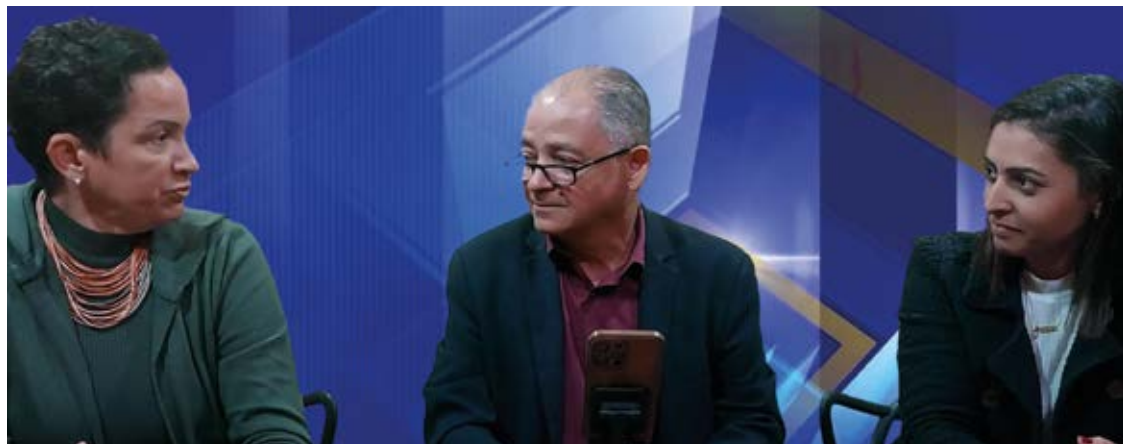
A entrevista completa pode ser conferida no canal do YouTube do Jornal Ponto Final.

Além disso, a falta de vagas para estacionamento no centro da cidade foi mencionada durante a entrevista. A questão das vagas de cargas e descargas também foi pontuada, devido aos transtornos causados pela