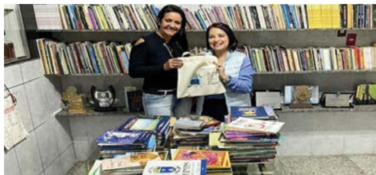
O Centro de Referência da Infância e Adolescência (CRIA) oferece atividades socioeducativas, recreativas, esportivas e culturais.

O CRIA passou por diversas melhorias recentemente, desde a revitalização do espaço