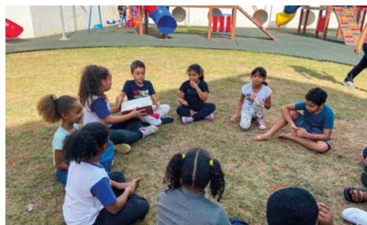
O projeto consiste na troca de cartas entre os alunos das 15 escolas que oferecem essa modalidade de ensino.