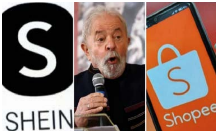
De acordo com o ministro, o presidente Luiz Inácio Lula da Silva (PT) determinou que a regra não seja modificada.

FISCALIZAÇÃO. Haddad confirmou que Lula pediu que combate ao contrabando por empresas asiáticas no comércio eletrônico se dê apenas por meio de fiscalização mais ampla.