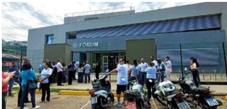
O julgamento aconteceu na última terça-feira (18), no Fórum de Mariana e durou cerca de 14 horas.

JUSTIÇA. Após pouco mais de um ano que o crime foi cometido, o autor foi julgado e condenado.