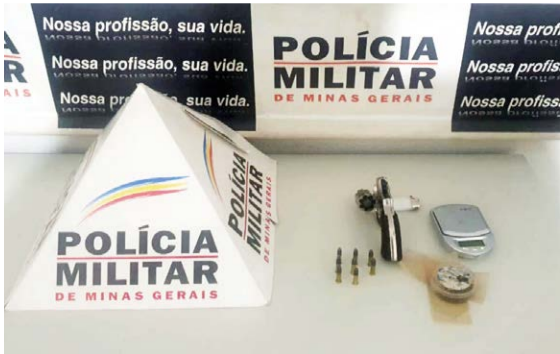
Como autor foram apreendidos 1 revólver e 8 munições do calibre 1,22 balança de precisão e 1 frasco contendo maconha.

VIOLÊNCIA. A jovem, de 25 anos, havia sido agredida pelo companheiro, que portava uma arma de fogo e estava sendo impedida de deixar sua residência.