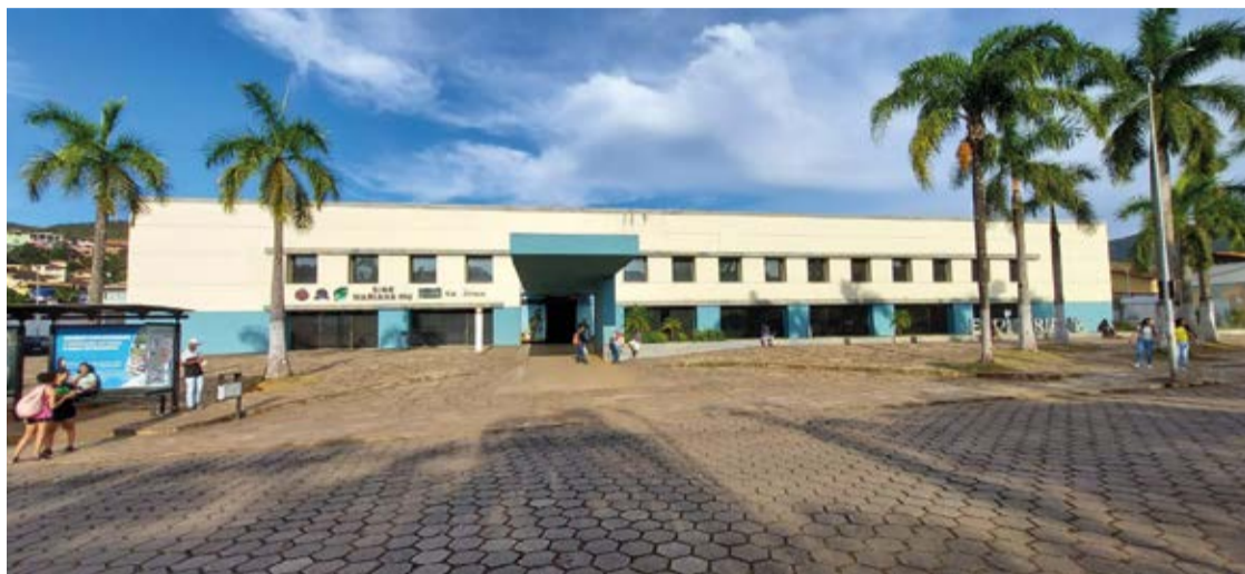
Atualmente no Centro de Convenções funciona várias secretárias, SINE, Empresa ÁPA, Vigilância Patrimonial dentre outras.