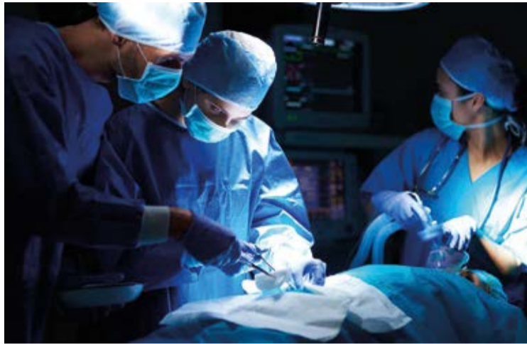
O Programa Opera Mais, Minas Gerais é único e tem critérios bem claros, pactuados com o prestador e o gestor municipal.

GARANTIA. Investimento do governo estadual garante a continuidade do programa Opera Mais, Minas Gerais, lançado em 2021.