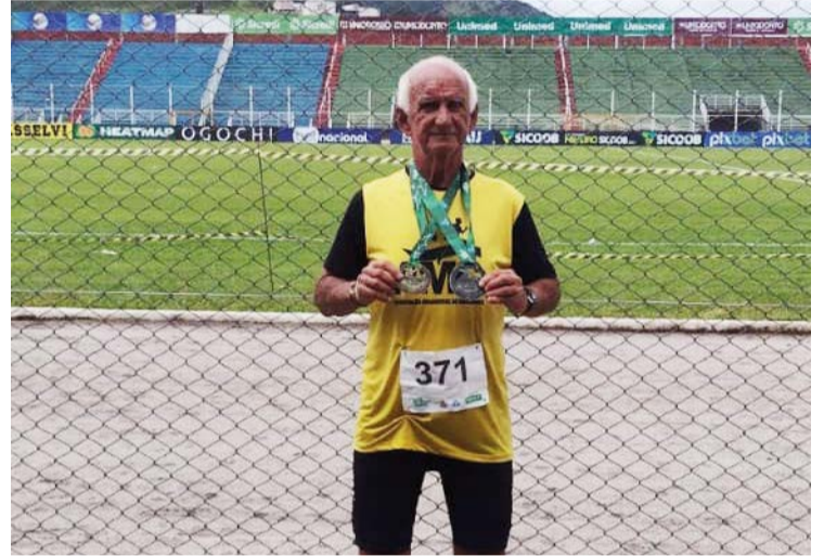
Sua conquista mais recente foi no último dia (29), na Volta ao Cristo em Poços de Caldas.