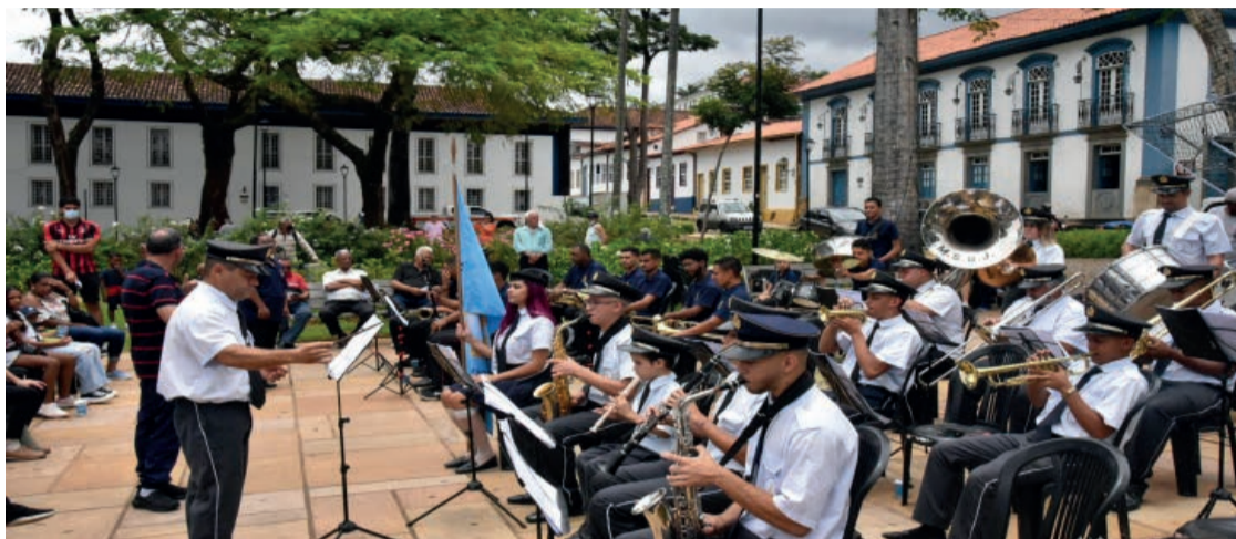
Duas bandas trouxeram muita música, arte e alegria para todos os moradores e visitantes da Primaz de Minas.

O Banda na Praça, promovido pela Prefeitura de Mariana, por meio da Secretaria de Patrimônio Histórico, Cultura, Turismo e Lazer, proporciona um momento muito importante e significativo para a cidade que respira cultura.