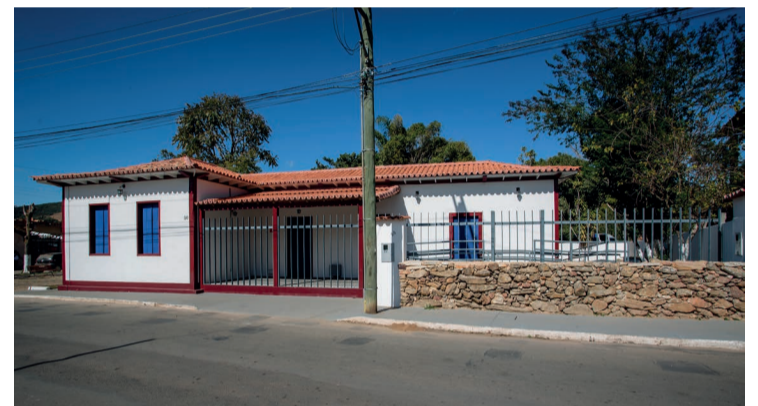
Após as intervenções, executadas pela Fundação Renova, o espaço irá abrigar parte do acervo musical marianense

O imóvel histórico possui cerca de 100 metros quadrados de área construída