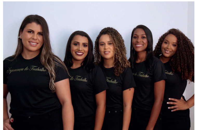
Parte dos formandos do Curso Técnico em Segurança do Trabalho

A escola formou neste ano de 2022 uma turma no curso Técnico de Segurança do trabalho, com 15 alunos, o curso busca habilitar profissionais para desempenhar atividades de prevenção a acidentes de trabalho, como forma de salvaguardar a integridade física do trabalhador, atender à demanda desses profissionais pelo