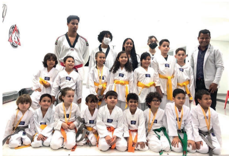
Parte do grupo que participou da troca de faixas.