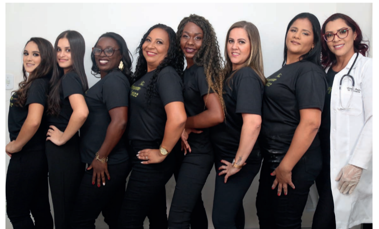
Parte dos formandos do Curso Técnico em Enfermagem.

setor produtivo e contribuir para a melhoria da qualidade de vida do trabalhador.