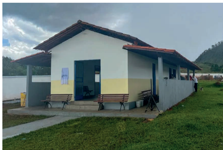
Para oferecer maior conforto e segurança às famílias que utilizam o local, foram realizados diversos reparos.

Durante o processo de reforma, diversas equipes foram mobilizadas, envolvendo áreas, como: carpintaria, hidráulica, elétrica, solda e alvenaria. O trabalho de mais de três meses foi entregue com qualidade e segurança, atendendo os desejos da população e levando mais melhorias ao Distrito de Santa Rita Durão.