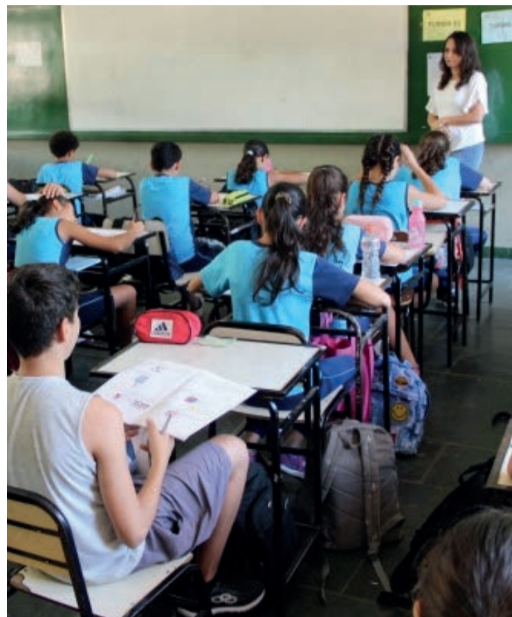
O recurso é liberado de acordo com o tamanho da escola.

● Em prevenção aos possíveis danos causados pela grande quantidade de chuvas neste período do ano, o Governo de Minas, por meio da Secretaria de Estado de Educação de Minas Gerais (SEE/MG), liberou um aditivo no recurso de Manutenção e Custeio Predial a todas as 3.461 unidades escolares da rede. O recurso é destinado a pequenos e médios reparos na infraestrutura dos prédios. A verba, já liberada aos gestores, soma R$ 41,7 milhões. A liberação desse recurso emergencial tem o objetivo de manter as escolas com dinheiro em caixa para eventuais sinistros causados pelas chuvas, ventos fortes e outras intempéries climáticas. “A iniciativa possibilita aos diretores escolares agirem de forma mais rápida e pontual nos problemas tão logo eles ocorram por consequência das fortes chuvas ou vendavais”, detalha o superintendente de Infraes-