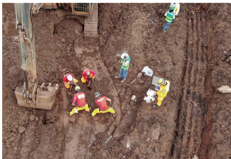
O rompimento da barragem da Vale S.A. em Brumadinho, em 25 de janeiro de 2019, tirou a vida de 272 pessoas.

TRISTEZA. Neste ano, a PCMG identificou três pessoas que perderam a vida na tragédia.