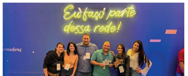
Representantes da Secretária de Desenvolvimento Econômico de Mariana recebendo o prêmio.

● A equipe da Sala Mineira, responsável pelo atendimento ao Microempreendedor Individual (MEI), pertencente à Secretaria de Desenvolvimento Econômico, no dia 07 de dezembro, participou do Encontro Estadual de Agentes de Atendimento do Sebrae, no Minascentro, localizado em Belo Horizonte. Ao todo, participaram 215 salas do Estado de Minas Gerais avaliadas pelo Sebrae, onde Mariana recebeu o Prêmio Bronze da sua Regional, durante o 3º encontro da Rede de Atendimento “Aqui tem Sebrae”. A cidade foi reconhecida pelo prêmio