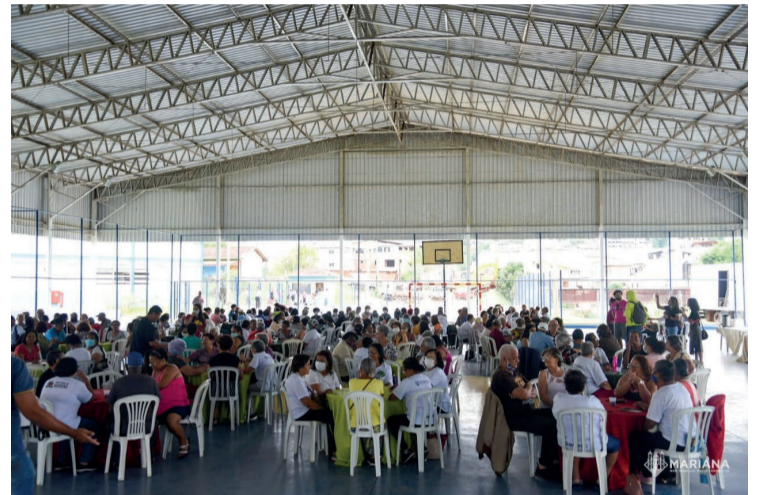
As comemorações tiveram início na segunda-feira (12), com a apresentação musical da Academia Musical Orquestra Show - Polícia Militar (AMOS)

A quarta-feira (14) foi o dia do Bingo, no espaço da quadra do CRIA. Uma manhã de muitas emoções e prêmios para os