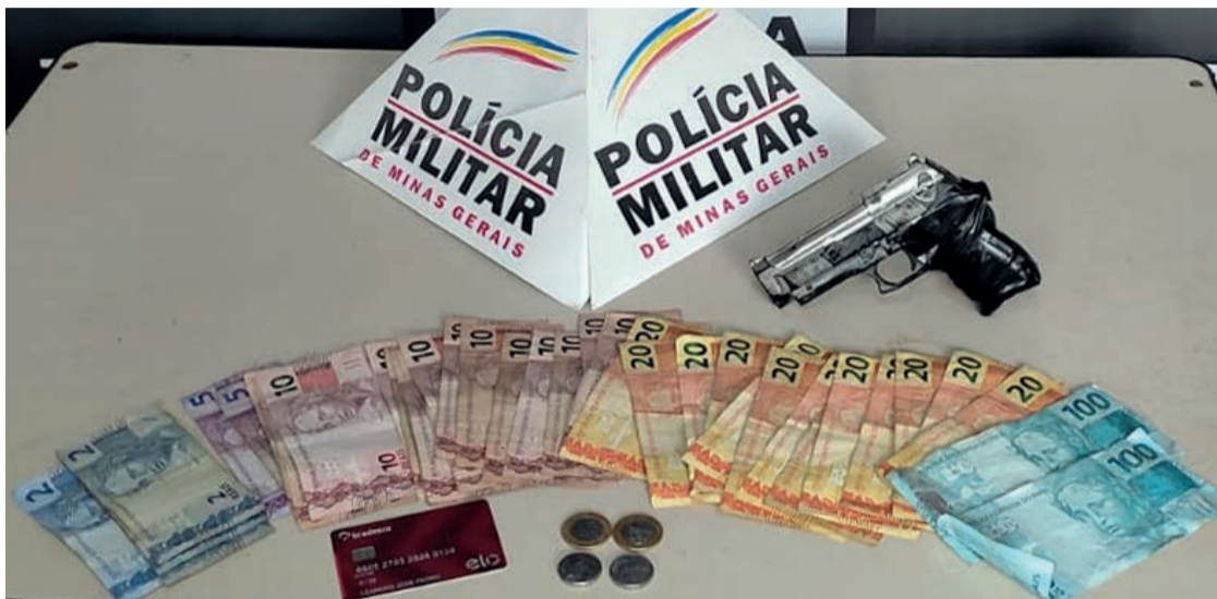
Foi apreendido 1 (um) simulacro de arma de fogo, e com o autor foi recuperada a quantia de R$687,00$ (seiscentos e oitenta e sete reais).

O autor, de 33 anos, foi conduzido para a Delegacia de Polícia Civil, junto aos materiais apreendidos pela Polícia Militar. A rápida prisão do autor gerou grande repercussão positiva em redes sociais, com diversos elogios referentes à ação da Polícia Militar.