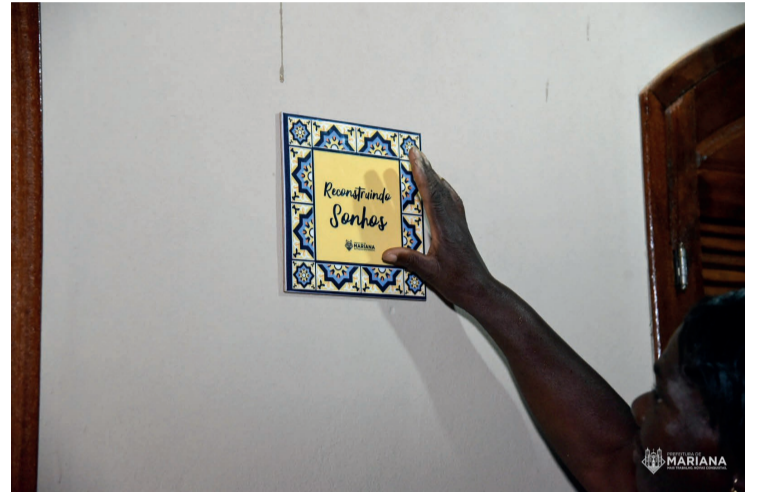
Para dona Maria, seu filho e sua neta o Programa é uma oportunidade de recomeçar.W

O Programa é direcionado às famílias que fazem parte do Projeto Aluguel Social e tem por objetivo transformar a vida de pessoas que vivem em situação de risco e vulnerabilidade. Após a avaliação do Departamento de Defesa Civil sobre as condições da moradia, a reforma é iniciada, proporcionando melhores condições de vida e mais dignidade para as pessoas contempladas.