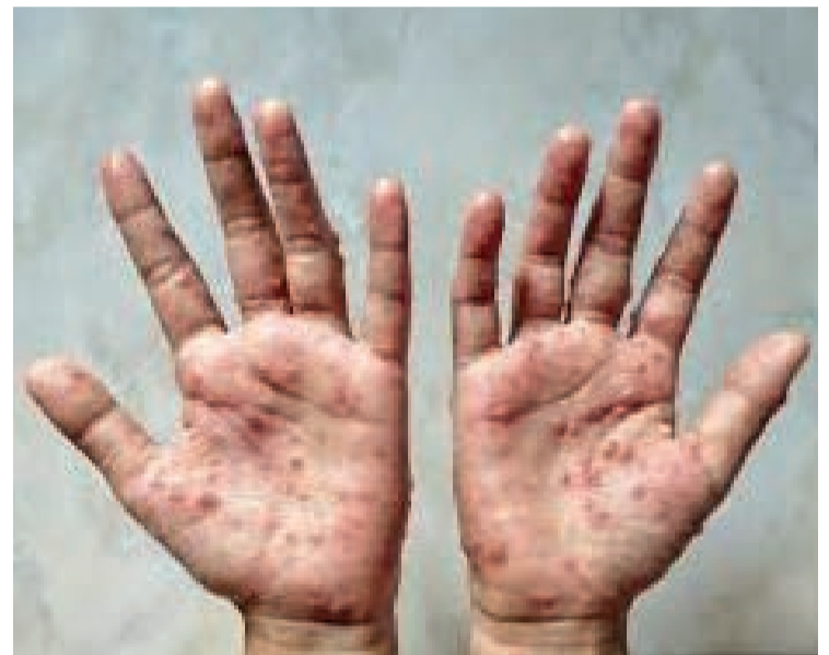
A morte confirmada em Pouso Alegre é a segunda registrada em Minas Gerais e a quarta no país.

Atualmente, no município, há 4 casos confirmados (sendo um deles o