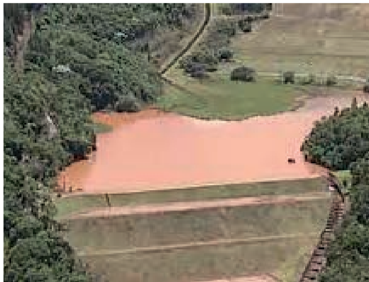
A provável causa, segundo a pasta, são as obras de reforço que estavam ocorrendo na estrutura. Todas foram paralisadas

Na noite do último sábado (8), a AngloGold confirmou que são duas trincas adjacentes, com a mesma origem. Em nota, a Agência Nacional de Mineração (ANM) afirmou que, após ter sido informada pela empresa da anomalia ocorrida, deslocou uma equipe de técnicos para averiguar a situação, na manhã de