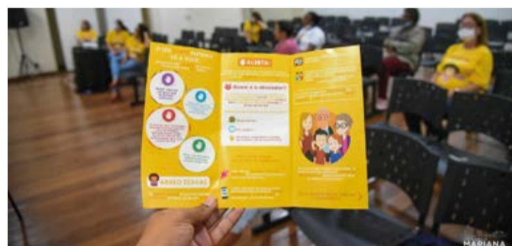
As mulheres tiveram a oportunidade de conhecerem mais sobre como identificar possíveis casos de exploração sexual.

Enquanto os integrantes do programa ProJovem participaram de uma sessão de cinema, as mulheres do Inclusão Produtiva da Mulher participaram de uma palestra sobre o assunto. No CineTeatro, os jovens foram convidados a assistirem o