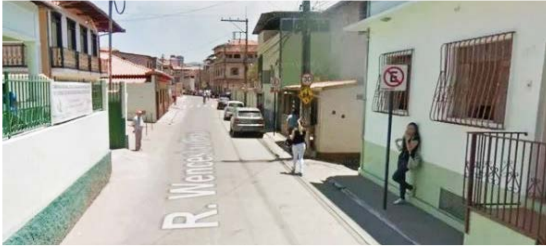
A vítima foi transferida para Belo Horizonte e não foi informado o estado de saúde da paciente.