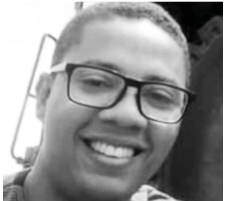
Em nota a Vale lamentou a morte do funcionário e informou que irá investigar a causa do acidente.

Em nota a Vale lamentou a morte do funcionário e informou que será feita uma apuração rigorosa para descobrir as causas do acidente. “A Vale lamenta profundamente a morte de seu empregado e dará todo