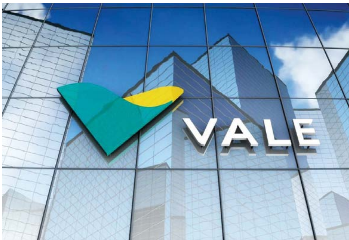
O Complexo de Mariana está com a produção suspensa.

A Vale afirma que segue acompanhando o cenário de chuvas em Minas Gerais e monitorando suas barragens, 24 horas por dia, em tempo real, por meio dos Centros de Monitoramento Geotécnicos. Ressalta-se que não houve alteração do nível de emergência em nenhuma de suas estruturas, que são acompanhadas permanentemente por inspeções, manutenções, radares, estações robóticas, câmeras de vídeo e instrumentos, como piezômetros manuais e automáticos.