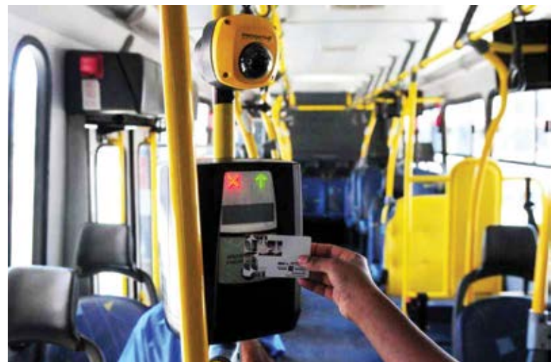
Os estudantes já podem solicitar os auxílios por meio de processo (PRO).

Para realizar a inscrição é necessário levar os seguintes documentos: - Documentos pessoais de todos os membros do grupo familiar, tais como: RG, CPF, título de eleitor (maiores de 18 anos) e carteira