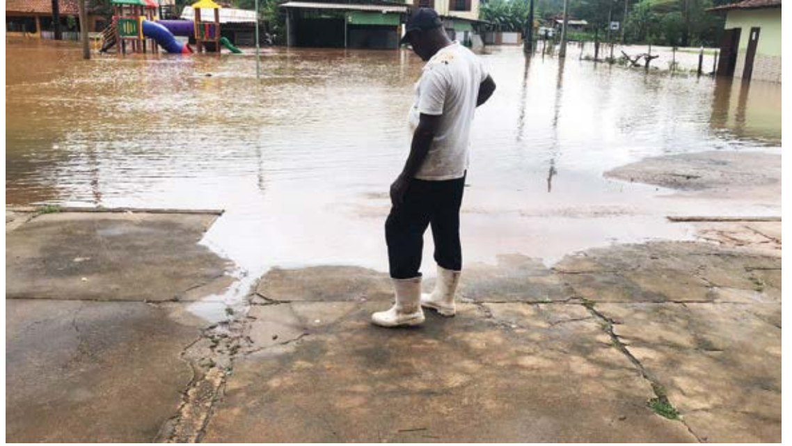
Em épocas de chuva, mais do que em outras épocas do ano, o cuidado deve ser redobrado.