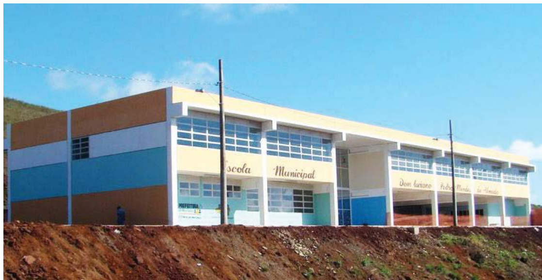
Os recursos financeiros do PDDE serão repassados em duas parcelas anuais.