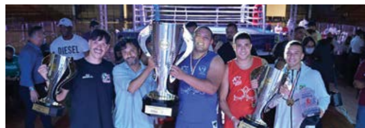
O evento contou com a presença de personalidades dos esportes de combate.

dos necessários e dessa forma foram convidados os feirantes da Feira Noturna (Associação dos Atingidos de Bento Rodrigues) para que ficasse responsabilizados pela venda de alimentação no evento. Todos os dias as entradas foram rea-