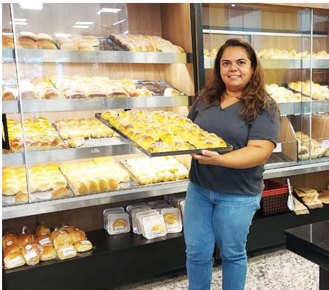
Do total de empresários entrevistados, apenas 7% pretendem realizar contratações temporárias neste final de ano.

Segundo a analista, esse pessimismo é resultado das expectativas de queda na demanda, já que os consumidores tendem a conter os gastos em função do aumento do custo de vida. “Vale lembrar que a maioria dos negócios de pequeno porte ainda enfrentam dificuldades em equilibrar as finanças. A 12ª edição da pesquisa O Impacto da Pandemia nos Pequenos Negócios, divulgada pelo Sebrae no início de setembro, mostrava que 70% das empresas do segmento em Minas Gerais ainda registravam queda no faturamento mensal.