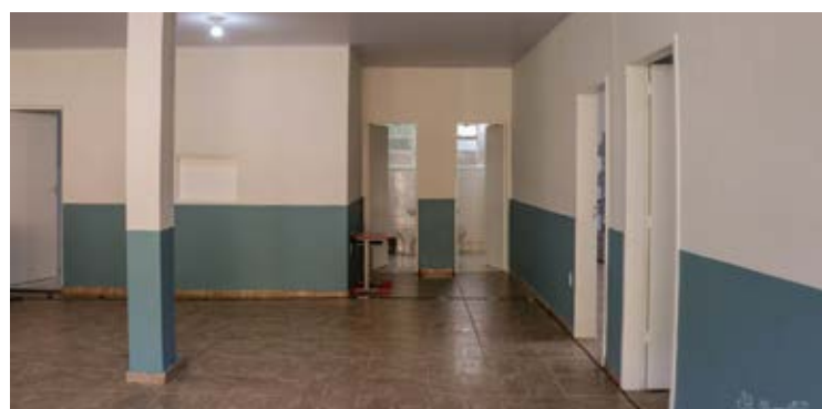
A ação faz parte de uma série de investimentos que a Prefeitura de Mariana tem realizado no município,

outros espaços para realizar reuniões, então foi muito gratificante receber essa reforma que vai ser muito útil para a população”, pontua.