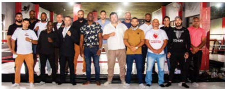
Se acordo com Sindicaro, a Federação de Pugilismo das Minas Gerais veio para mudar o cenário dos esportes de combate em todo o estado

O Sindicato Metabase Mariana, reforçou seu compromisso com todas as causas que diretamente beneficiem a sociedade. “Um Sindicato forte e consolidado é fruta da sua participação!”.