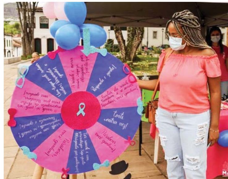
A ação educativa e de divulgação da Casa Rosa promoveu roda de bate papo sobre autocuidado para os homens e mulheres.

veu roda de bate papo sobre autocuidado para os homens e mulheres e contou com a participação de especialistas. Além disso, foram disponibilizados preservativos, materiais infor-