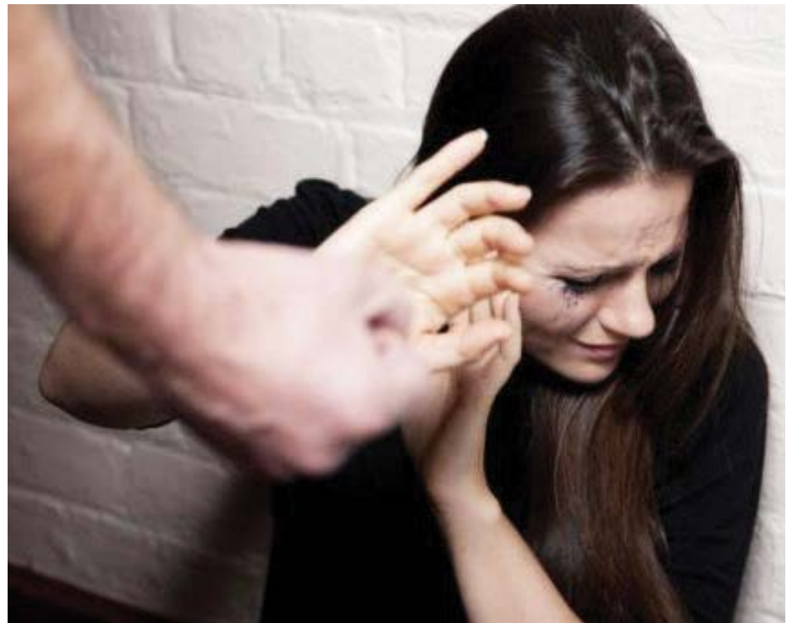
O número de vítimas de feminicídio foi recorde em 2020.