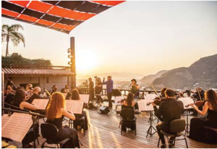
O repertório revive clássicos do cancionário de Alceu emoldurados pela música de concerto.

RECONHECIMENTO. Programa é sucesso de visualizações e recebe mensalmente grandes nomes da música brasileira.