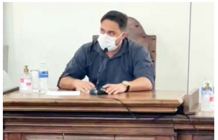
A indicação foi aprovada por unanimidade na reunião de Câmara da última segunda-feira (8).