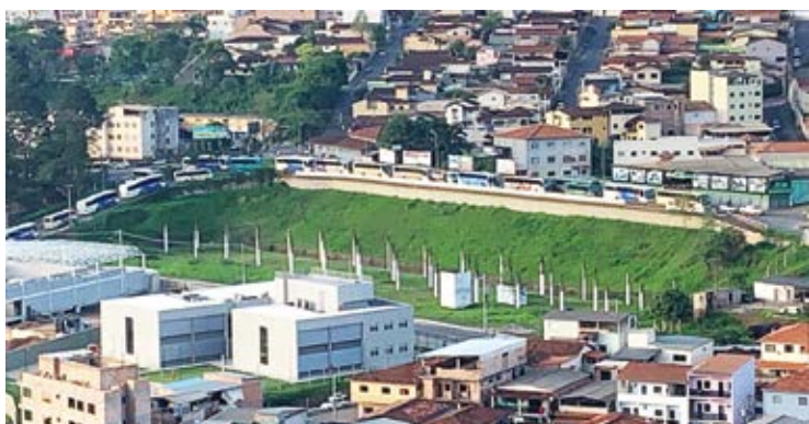
As manifestações começaram por volta das cinco da manhã.

UNIÃO. Mobilização contou com a presença de familiares de mortos no rompimento da barragem de Brumadinho.