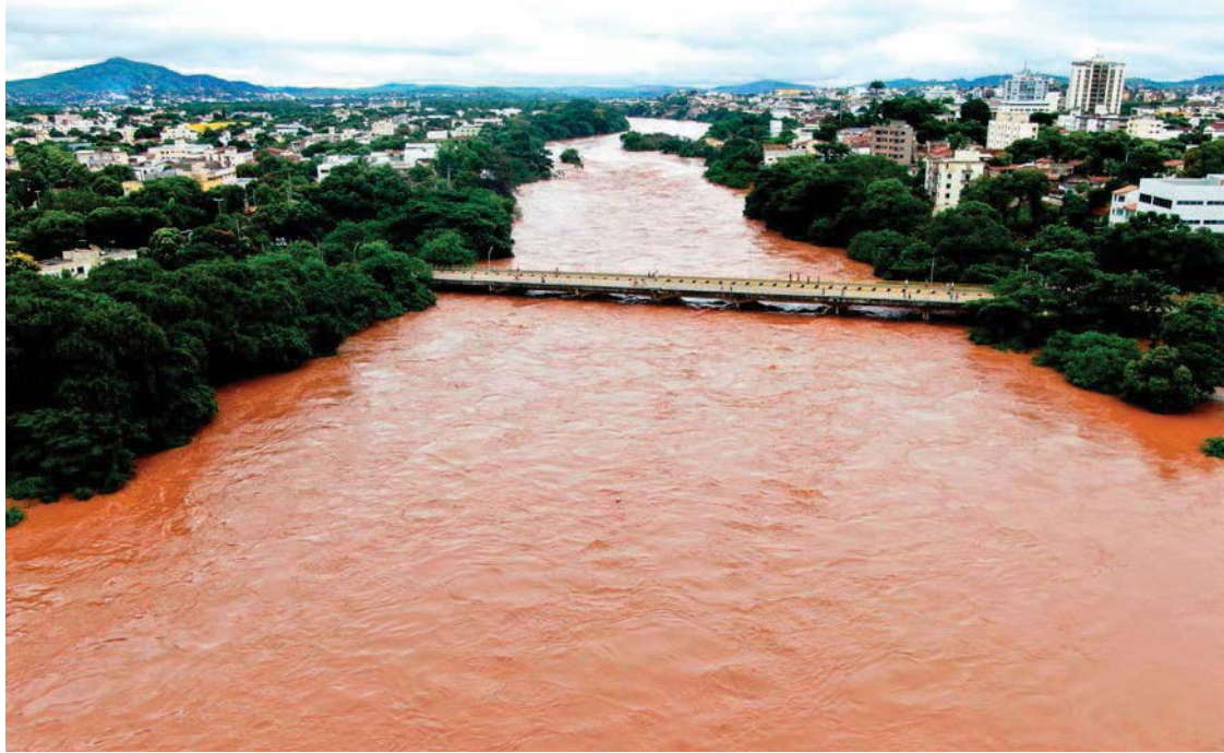
O TTAC foi celebrado entre Samarco, suas acionistas Vale e BHP.