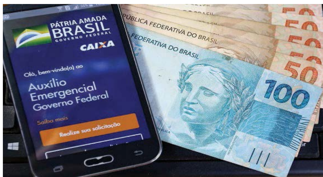
O Auxílio Emergencial foi liberado para mais de 68 milhões de trabalhadores.

Na segunda-feira (8), o presidente Jair Bolsonaro disse estar “negociando” o tema com ministros, e o presidente do Senado Federal, Rodrigo Pacheco, afirmou ver “expectativa positiva” de um anúncio ainda nesta semana. Já o ministro da Economia, Paulo Guedes, declarou, na semana passada, que o auxílio emergencial pode voltar a ser pago para cerca de 32 milhões de pessoas, metade dos beneficiários de 2020.