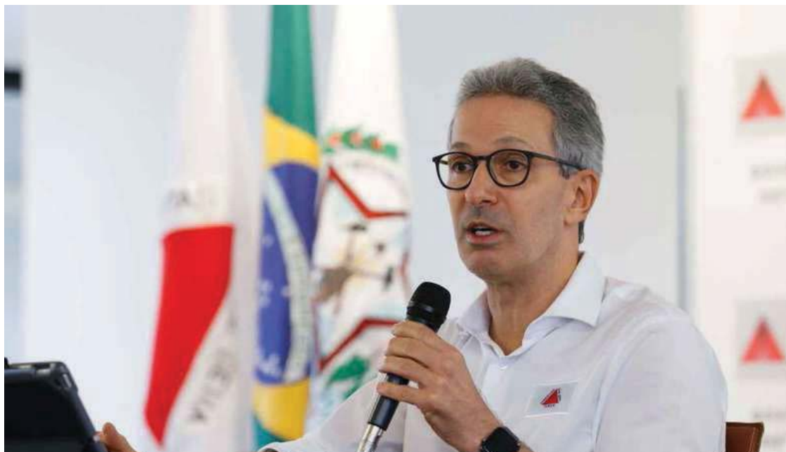
O governador afirmou que todos os entes públicos estão mobilizados para fazer algo em relação à atuação da fundação.