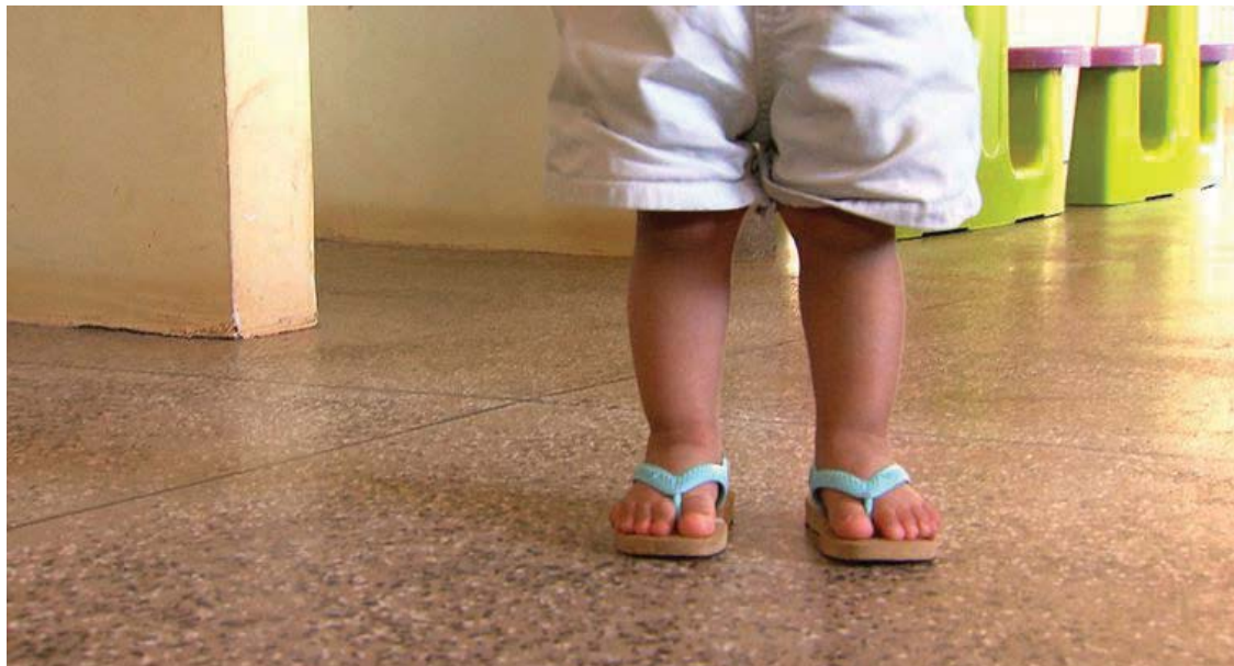
BH registra morte de 4 anos - Belo Horizonte registrou em menos de uma semana duas mortes de crianças abaixo de 4 anos.

início da pandemia na cidade, e 2.435 pessoas perderam a vida.