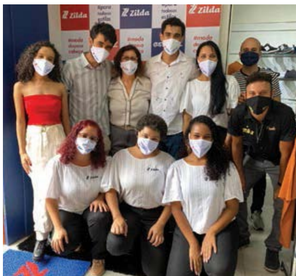
Essa é a equipe da loja Zilda e Estilo Z. A sua nova loja de roupas e calçados. Vale a pena conhecer!