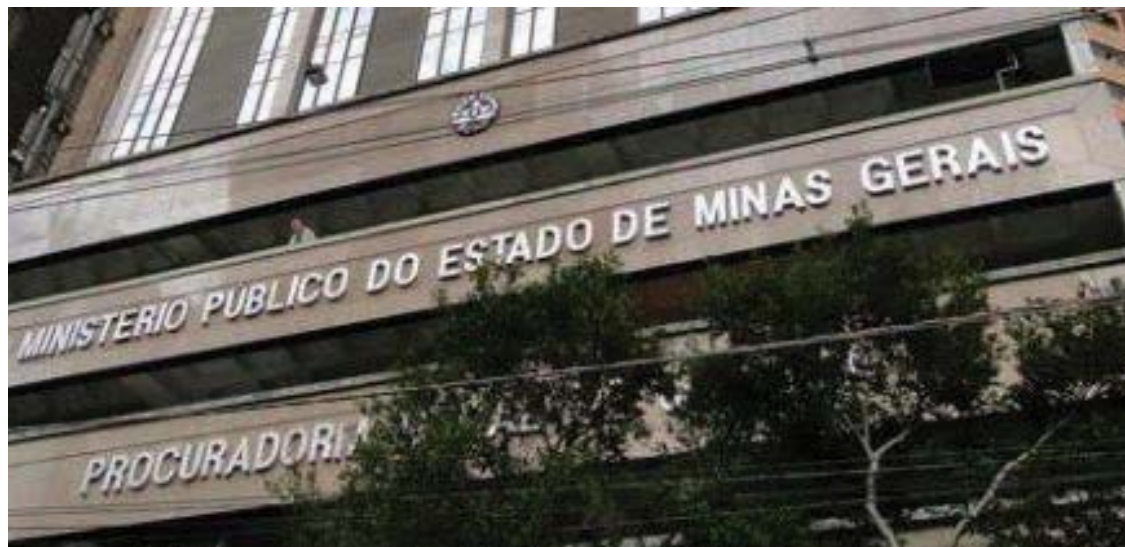
Segundo o MPF, foi requerida a designação, com a máxima urgência.

Para o MPF, a realização virtual dos atos de instrução do processo não prejudicam as “garantias constitucionais da ampla defesa e do contraditório, e, na verdade, até garantem outros direitos constitucionais, como o da garantia de duração razoável do processo judicial.”