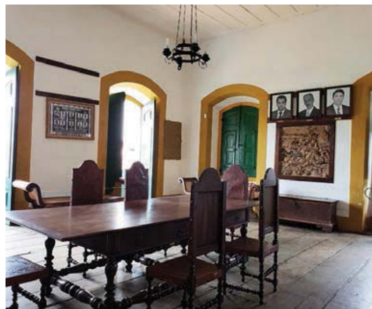
Cada vereador possui um veículo à disposição assim como imóvel alugado.

A Câmara respondeu às perguntas enviadas pelo jornal, que cada vereador possui à sua disposição um veículo alugado, cota de combustível mensal, aluguel de imóvel além de uma verba indenizatória que ultrapassa 7 mil, “o vereador em