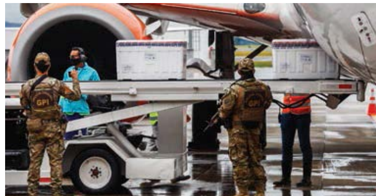
A maior operação para campanha de vacinação na história de Minas Gerais começou no dia 18 de janeiro

A distribuição das doses de vacinas e o número