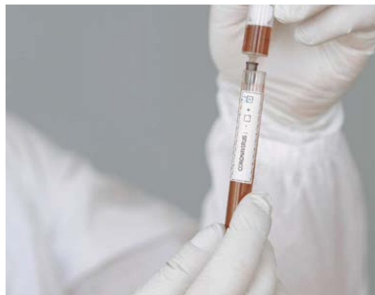
A política do Estado para realização de teste pelo método RT-PCR segue a recomendação do Ministério da Saúde (MS).

A política do Estado para realização de teste pelo método RT-PCR segue a recomendação do Ministério da Saúde (MS). A testagem é feita, por exemplo, em casos de Síndrome Respira-