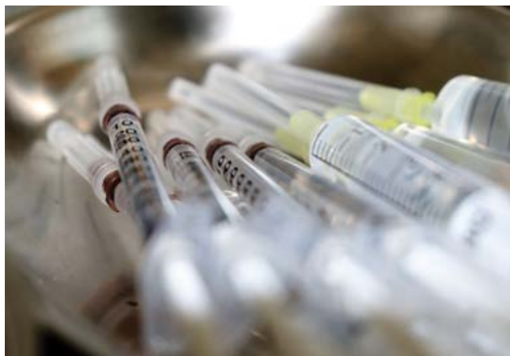
Em Minas Gerais, a campanha adota o slogan “Cartão em dia, saúde protegida”.

O público-alvo da campanha contra poliomielite são crianças de 1 ano a menores de 5 anos, que devem receber a Vacina Oral de Poliomielite (VOP), desde que já tenham recebido as três doses da Vacina Inativada de Poliomielite (VIP), do