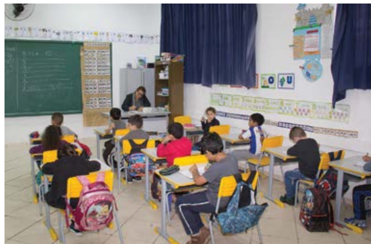
O retorno estava planejado para o dia 5 de outubro.

o desembargador Bitencourt Marcondes, além de suspender o retorno, requereu ao governo do estado que apresentasse em até no máximo 10 dias um planejamento que comprove que o protocolo sanitário será adotado. Bitencourt pede também a comprovação de que o estado irá fornecer EPIs a todos os servidores e alunos e também fará acompanhamento via questionário diário sobre sintomas em alunos e servidores.