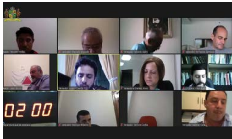
Durante a mesma reunião a Câmara reconheceu como entidade de Utilidade Pública a Associação Grupo Escoteiros de Mariana – AGEMAR

Durante a mesma reunião remota desta segunda-feira, os vereadores aprovaram, por unanimidade, o Projeto de Lei 60/2020, que reconheceu como entidade de Utilidade Pública a Associação Grupo Escoteiros de Mariana – AGE-MAR.