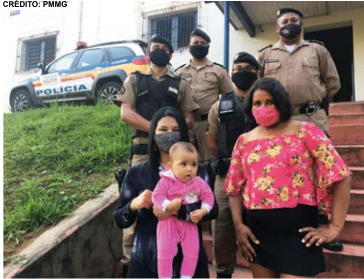
Na ocasião, a mãe da bebê agradeceu novamente, emocionada, aos policiais militares pelo socorrimto de sua filha.