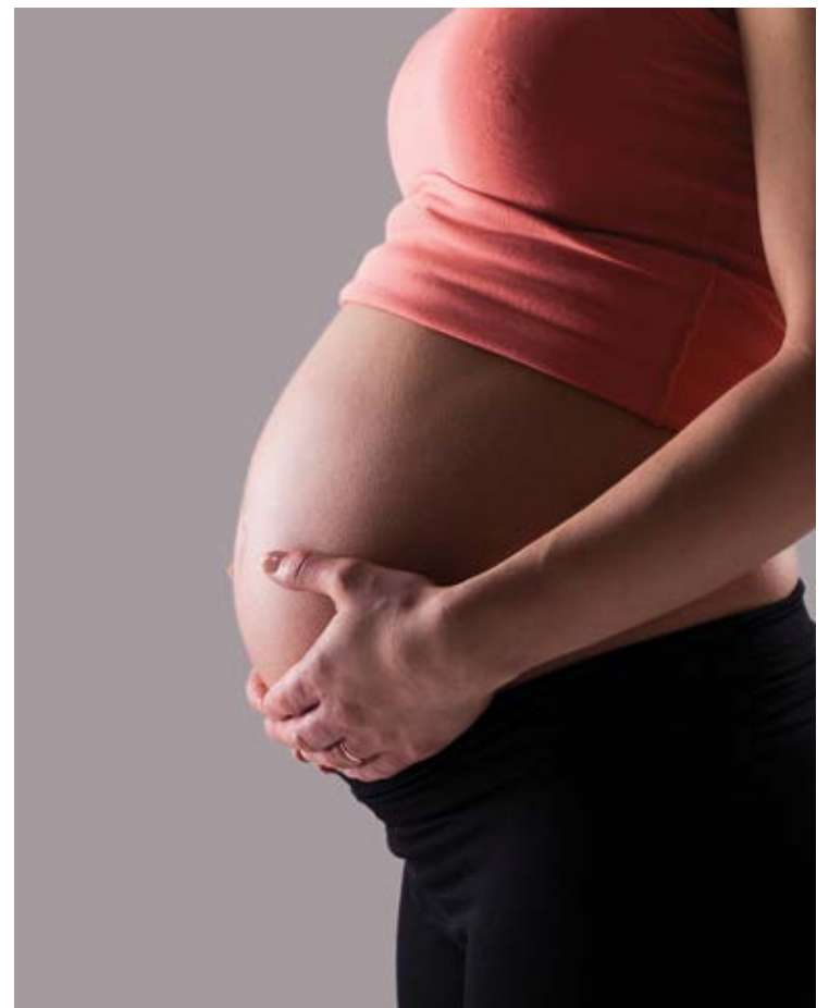
Em Minas Gerais, até 17 de agosto, sete mulheres nessas condições (puérperas ou gestantes) morreram em decorrência da covid-19.

As ações do planejamento reprodutivo são executadas na Atenção Primária à Saúde