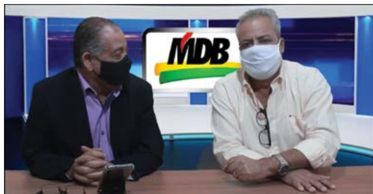
O ex-prefeito encerrou a entrevista ressaltando que será muito atacado agora, após lançar sua pré-candidatura.

ACESSE. Ex-prefeito e atual pré-candidato a prefeito de Mariana cedeu entrevista à TV Ponto Final.