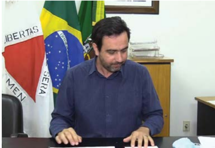
A expectativa é de que por volta do dia 10 de setembro o rotativo deva estar funcionando.

DIGITAL. A implementação foi feita gratuitamente pela empresa responsável e os tickets para o uso das vagas serão comercializados pelos estabelecimentos locais e via aplicativo.