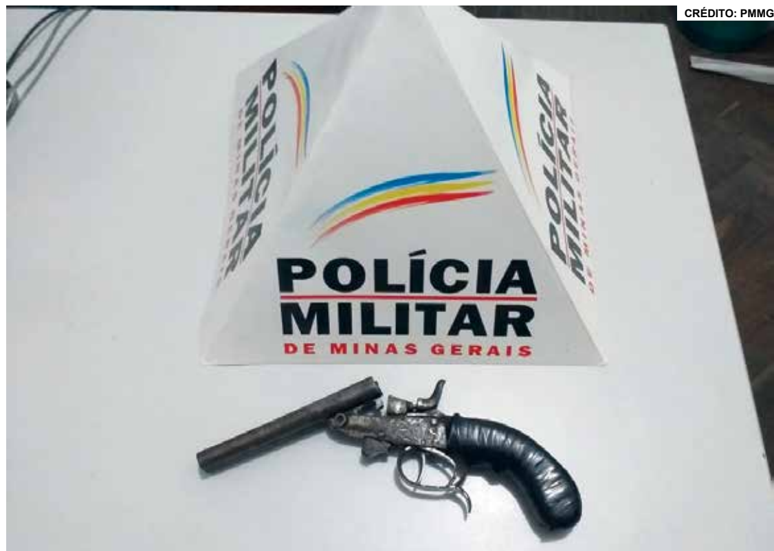
A arma estava atrás de uma árvore as margens da rodovia MG-326.