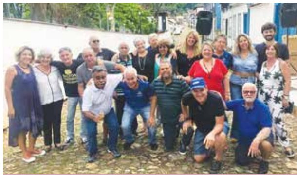
Encontro de amigas e amigos fundadores, familiares - Associação Atlética JUMA - que no mês de outubro completará 55 anos!