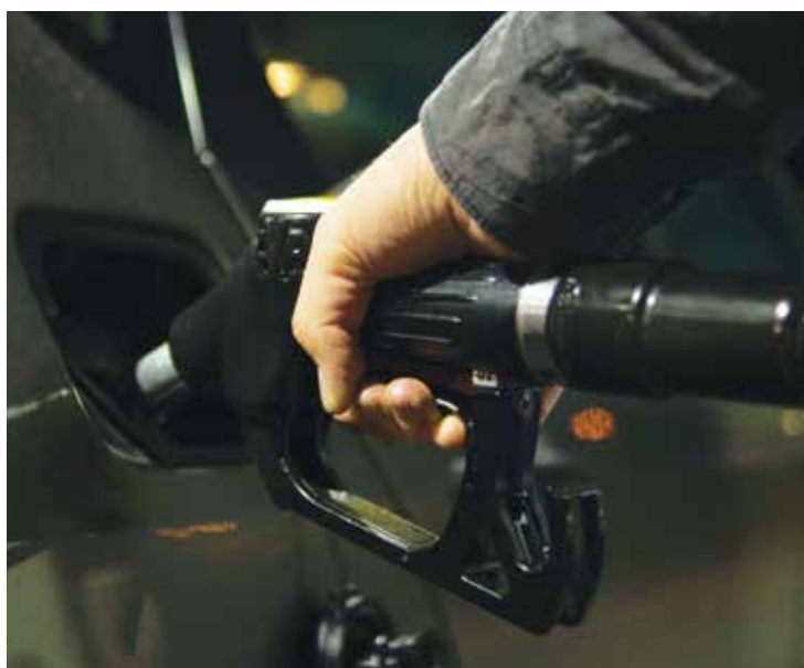
Mariana aparece na lista sendo a oitava cidade com a gasolina mais cara do país.

FONTE. A empresa de gestão de frotas ValeCard efetuou uma pesquisa com base nos registros das transações feitas com o cartão de abastecimento da própria empresa.