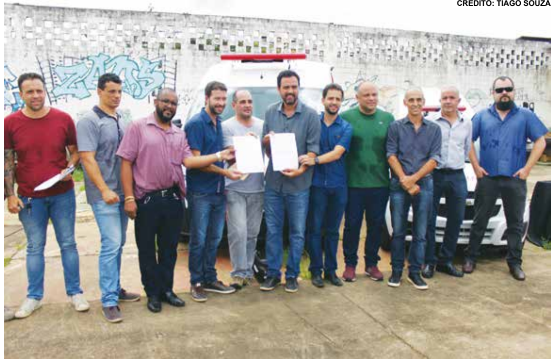
A inauguração do prédio está prevista para 2020.