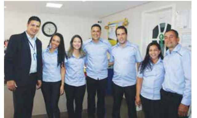
Pensem em uma equipe top... assim é essa turma da Funerária São José, que todo ano fazem o sorteio Show de Prêmios da Assistência Familiar São José. Sucesso sempre para vocês!