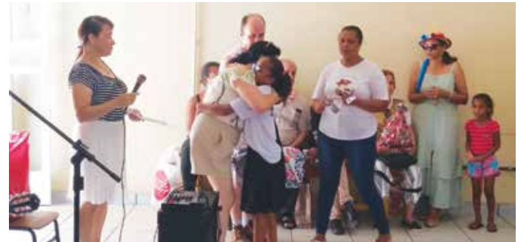
A entrega dos presentes alegrou a criançanda.

O Grupo Teatral "Cítara de Davi" da cidade de Barbacena, através de seus membros com muita alegria chegaram na comunidade alegrando a todos cantando suas músicas folcló-