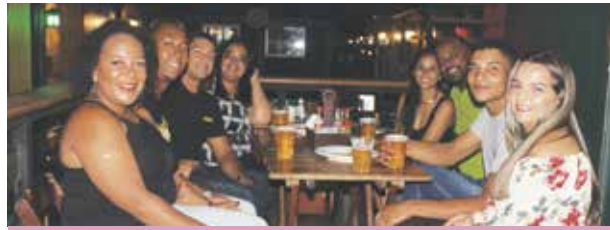
A Mercenaria São José em confraternização com toda a sua equipe. Abraços para vocês!