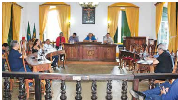
A mudança deverá acontecer ainda este ano e será divulgada à população.