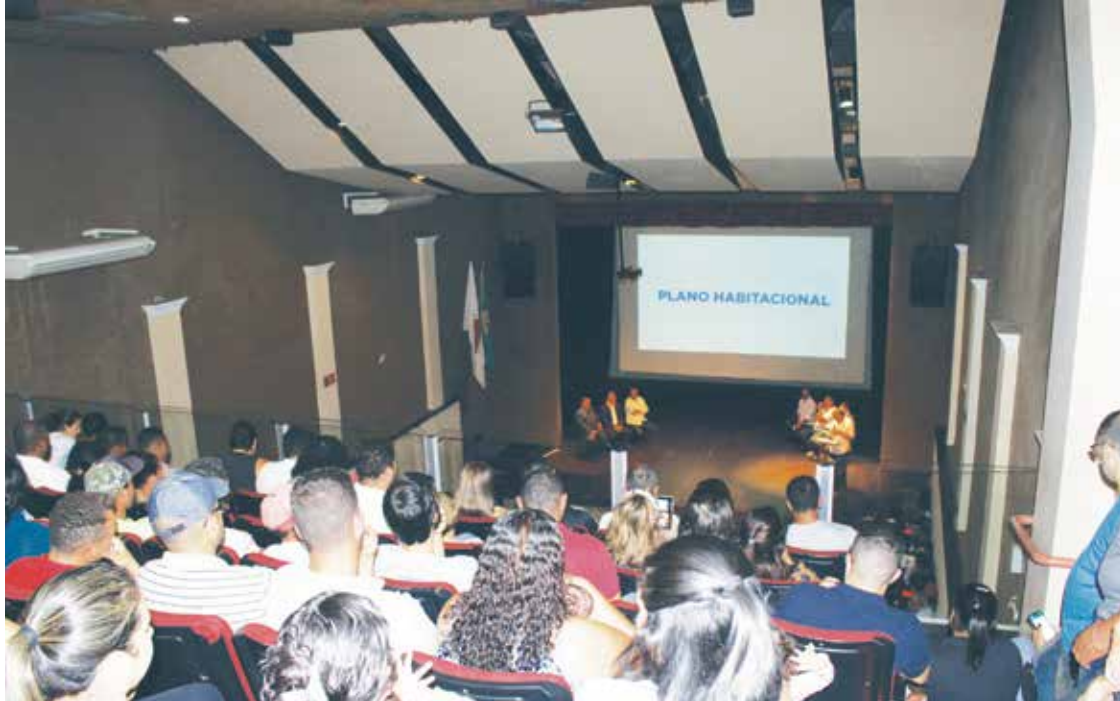
Os apartamentos, que serão compostos de três quartos, sala/copa, cozinha, área de serviço, banheiro e uma vaga de garagem, terão 47m 2 .