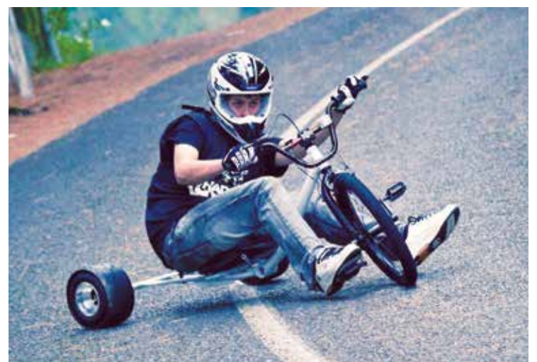
Drift Trike é uma mistura divertida entre o carrinho de rolimã, o triciclo infantil e a bicicleta.

O campeonato será dividido nas categorias: slide (manobras radicais) e speed (alta velocidade). Além disso, teremos também a produção de um porco no rolete na praça principal do distrito. O evento é gratuito