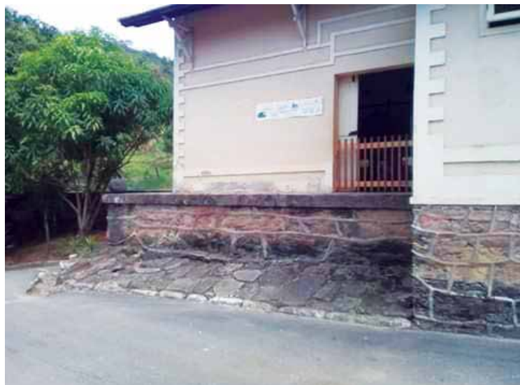
A Prefeitura afirma que os alunos foram remanejados para a estação ferroviária de Furquim a pedido da própria comunidade.

RECLAMAÇÃO. Em contato com o Jornal, o pai de um dos alunos disse que o local não tem a estrutura necessária para dar segurança aos alunos.