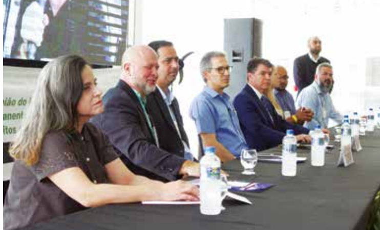
A 9ª reunião técnica do Fórum Permanente será realizada no mês de fevereiro de 2020, na cidade de Periquito (MG).