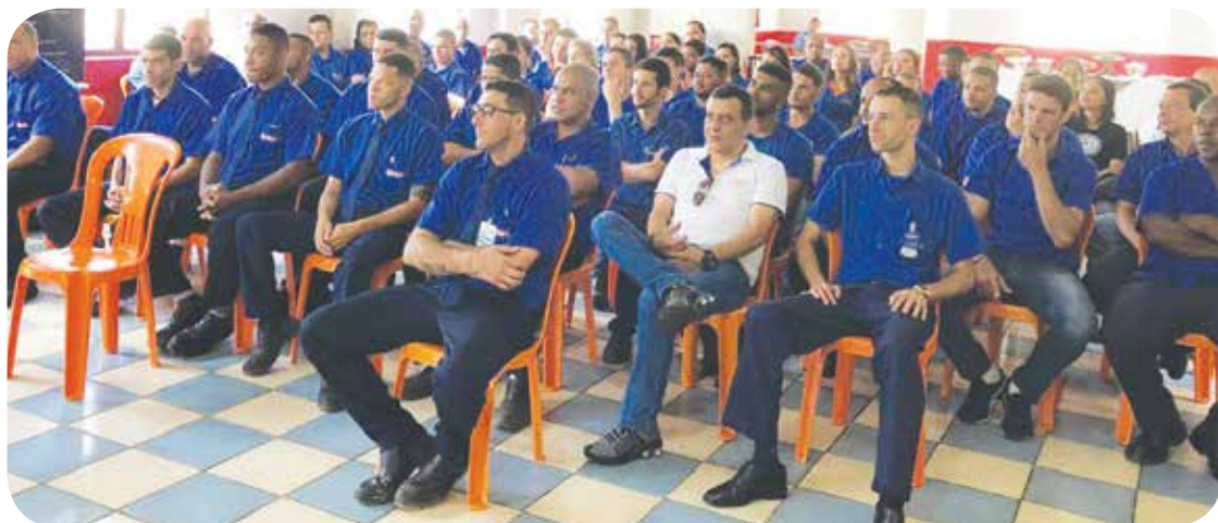
Colaboradores da Indaiá.