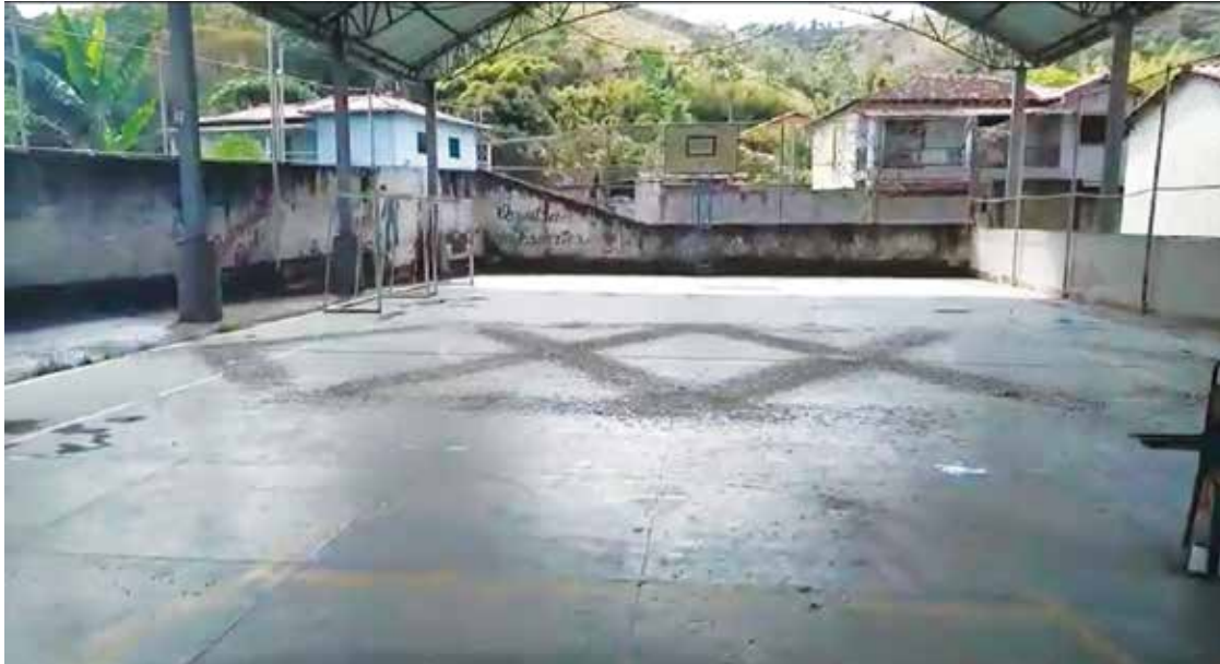
As imagens foram feitas pelo pai de um dos alunos da escola.

O Jornal entrou em contato com a Prefeitura, o executivo afirma que periodicamente as escolas recebem materiais para limpeza e no dia 11 de setembro, mais de 23 itens de