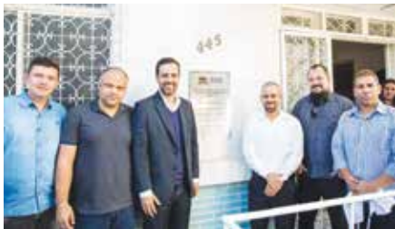
Prefeito Duarte Júnior e representantes políticos em Belo Horizonte na inauguração da Casa de Apoio para os marianenses. Parabéns administração pela iniciativa!