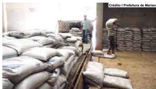
Crédito | Prefeitura de Mariana

atendeu mais de 110 produtores, adquirindo um total de 1827 sacos de insumos. A Secretaria é localizada no Centro de Convenções - Praça JK, sem n°. O Telefone para contato é (31) 3558-4173.