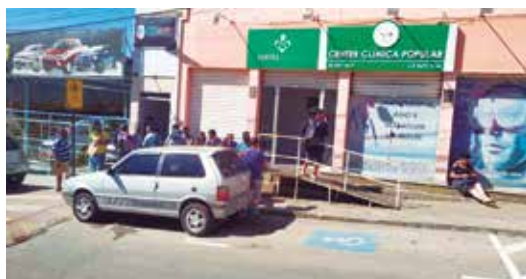
Clínica lamenta o ocorrido e alega que não são recorrentes os atrasos e foi uma situação atípica.

Também em resposta ao Jornal, a Clínica lamenta o ocorrido e alega que não são recorrentes os atrasos e foi uma situação atípica. “Desta forma, pedimos