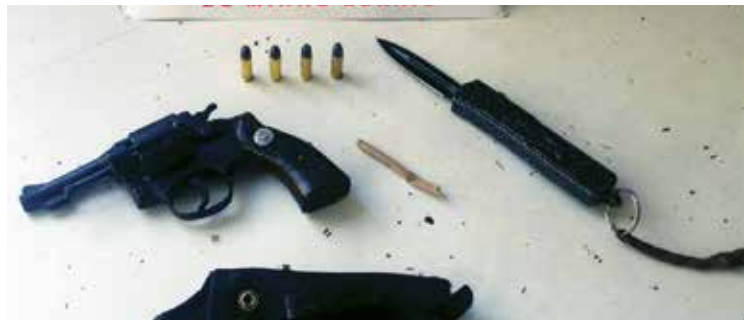
Foram encontrados: 4 munições do calibre 32, 1 canivete e 1 cigarro de maconha.

APREENSÃO. O suspeito, de 24 anos, foi preso e conduzido para a Delegacia de Polícia Civil.