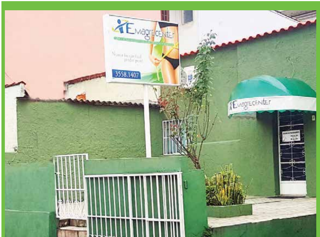
Emagrecenter completa 10 anos de emagrecimento saudável em Mariana Página 7