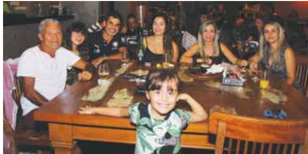
Família ENGELIG também presente no Quintal!