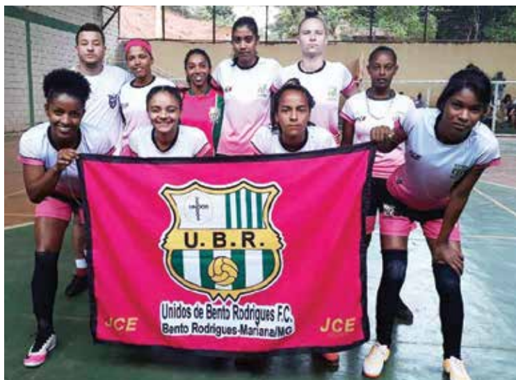
São Bento de Mariana é uma das equipes marianenses.

ACOMPANHE. A próxima etapa será na cidade de Ponte Nova.