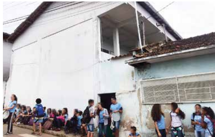
Segundo Jarbas, a falta dos materiais está prejudicando o funcionamento da escola.

Em vídeo publicado em suas redes sociais, o vereador falou também sobre a falta das merendas e material de limpeza. Segundo Jarbas, a falta dos materiais está prejudicando o funcionamento da escola.