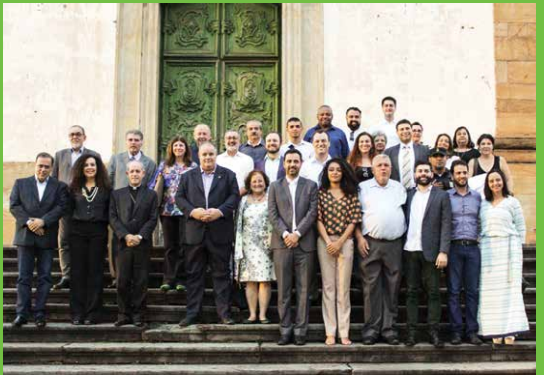
Início das obras de restauro do patrimônio histórico é assinado.