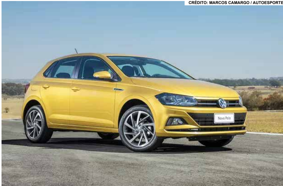
VOLKSWAGEN POLO 1.0 TSI HIGHLINE HOME.