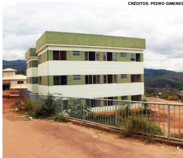
CRÉDITOS: PEDRO GIMENES

ATRASO. Data prevista para final de janeiro não foi cumprida e continua sem prazo para divulgação.