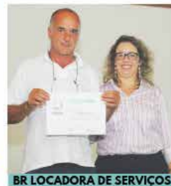
BR LOCADORA DE SERVIÇOS