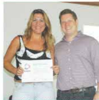
MURICI MATERIAIS DE CONSTRUÇÃO