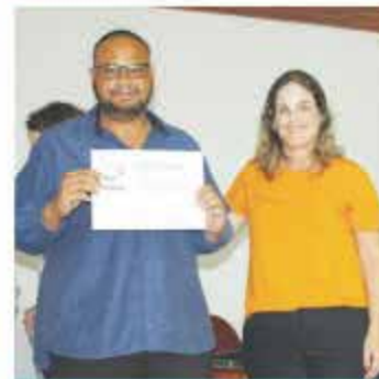
OSW MANUTENÇÃO E OBRAS CIVIS