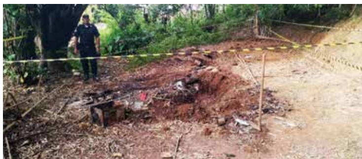
O cadáver foi encontrado em uma cova rasa na rua Santana.

A perícia técnica da Polícia Civil e um investigador estiveram no local, e o corpo foi levado ao Instituto Médico Legal (IML) para exame de DNA. Há uma suspeita de que a vítima seja um homem desaparecido desde 15 de janeiro.