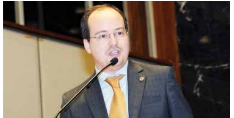
Thiago Cota se posicionou afirmando que essa informação é falsa e esclareceu que em 2017 ele teria sido relator desse projeto.

O deputado Thiago Cota se posicionou afirmando que essa informação é falsa e esclareceu que em 2017 ele teria sido relator desse projeto na Comissão de Meio Ambiente e Desenvol-