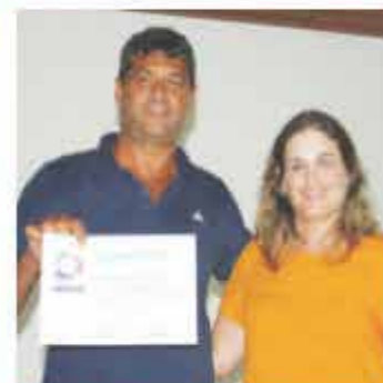
CONSTRUTORA CASTRO E PAIXÃO