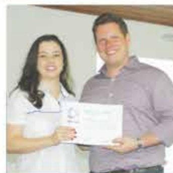
HD LOCAÇÃO DE VEÍCULOS