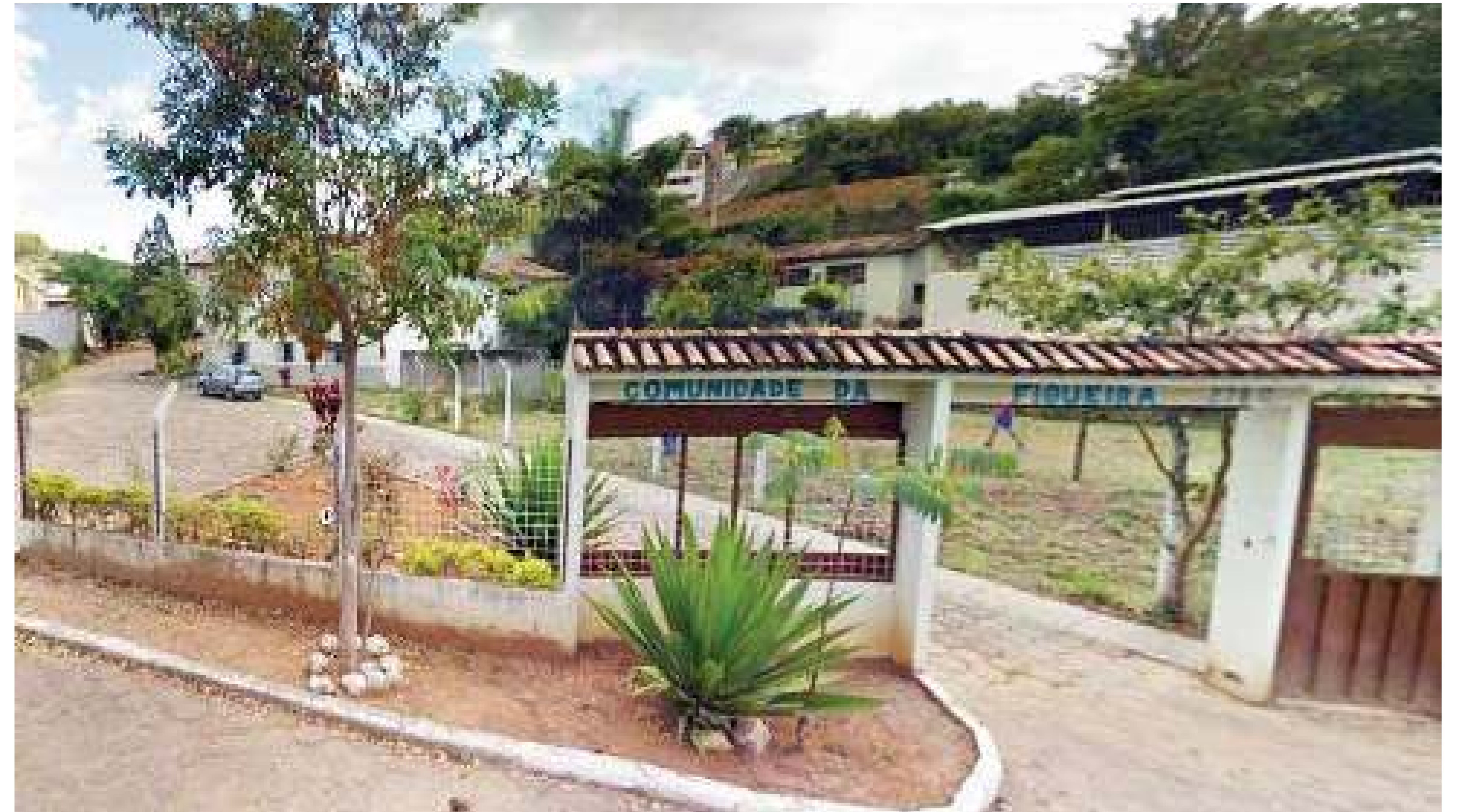
A entidade se localiza na Rua Cônego Amando, 278 B, bairro São José em Mariana.

TRABALHO. A casa realiza trabalhos de acolhimento às Pessoas com Deficiência (PcDs) de Mariana.