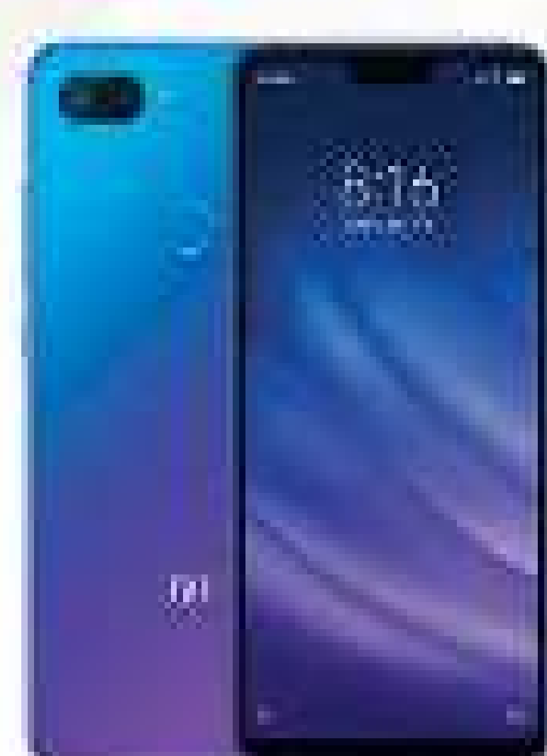
XIAOMI MI 8 LITE