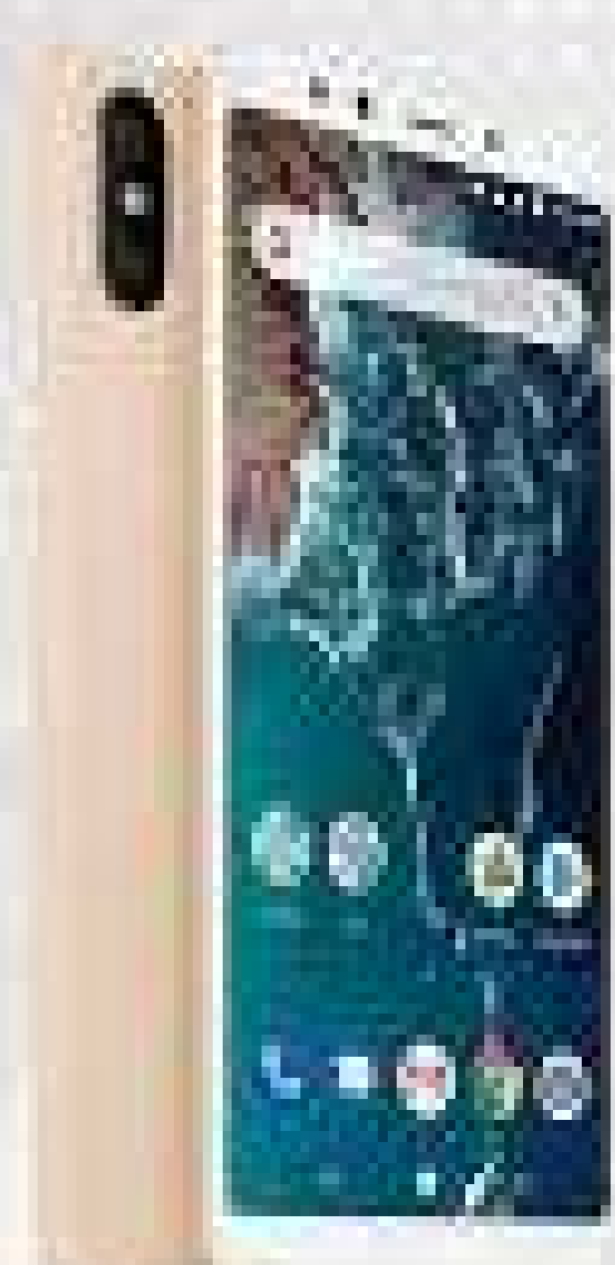
XIAOMI MI A2