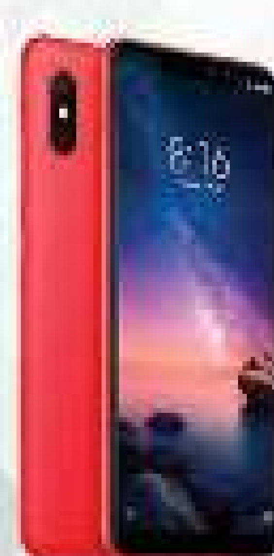
XIAOMI NOTE 6 PRO