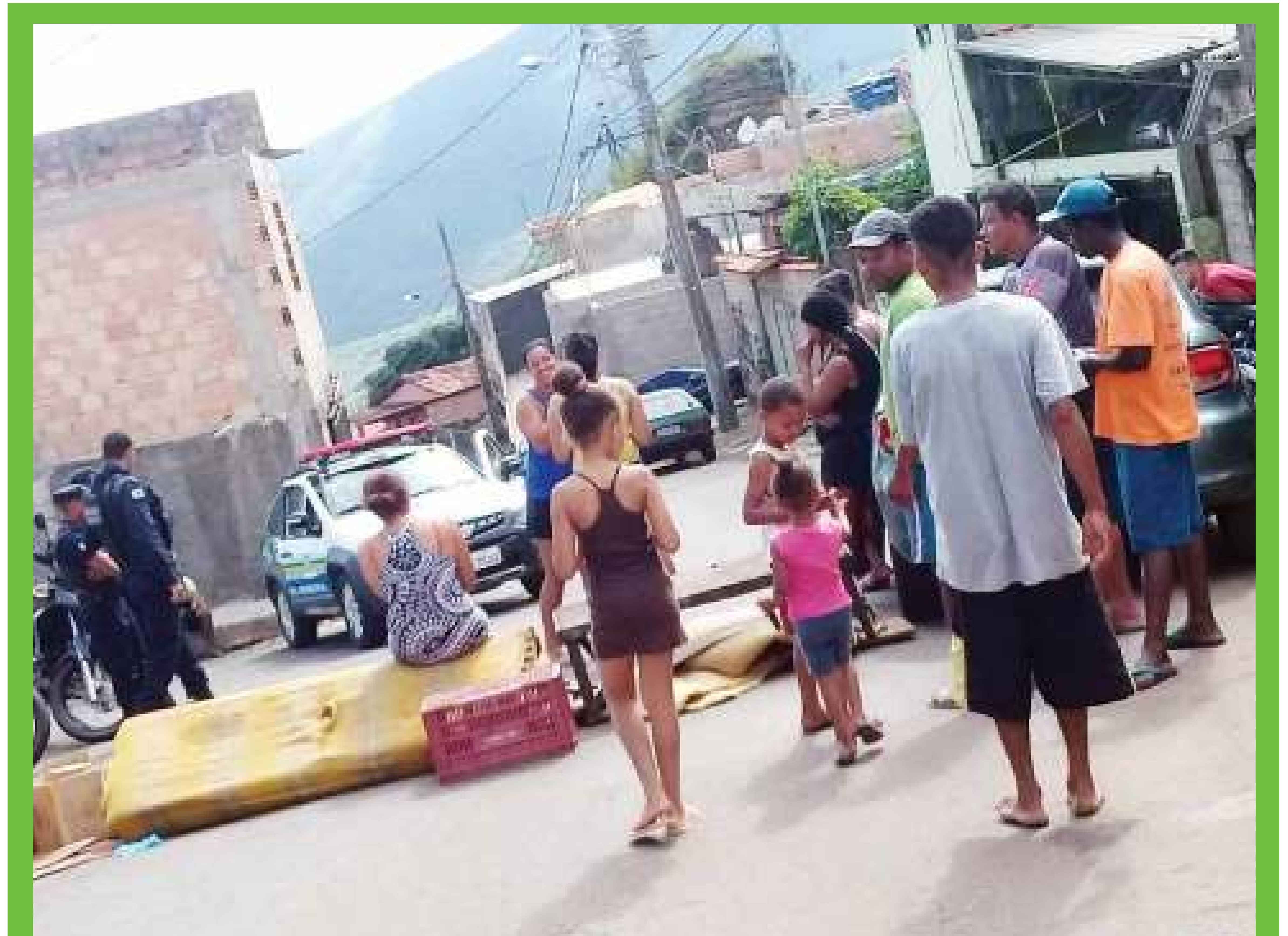
Moradores interditam rua por falta de água do bairro Santa Rita de Cássia.