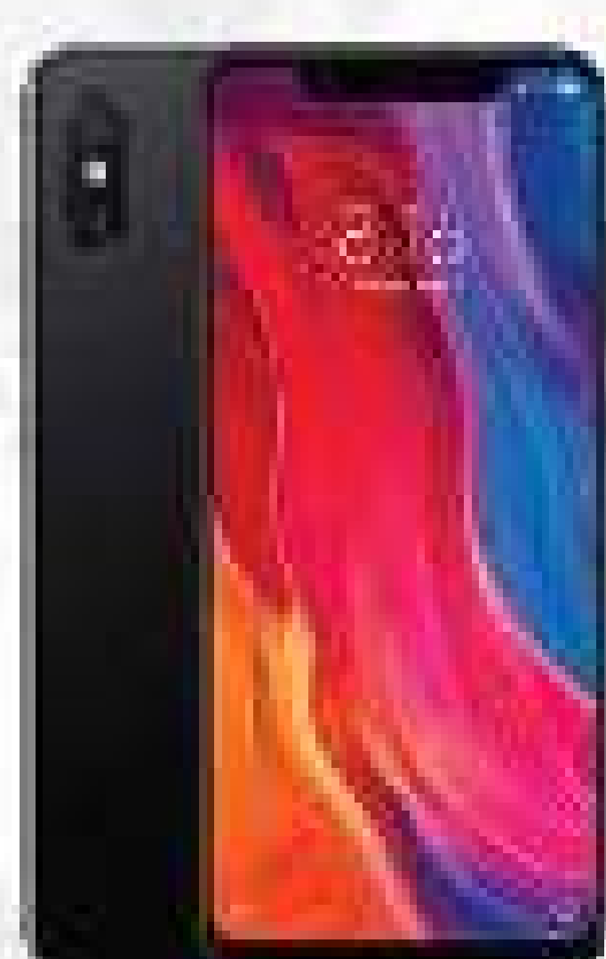
XIAOMI MI 8