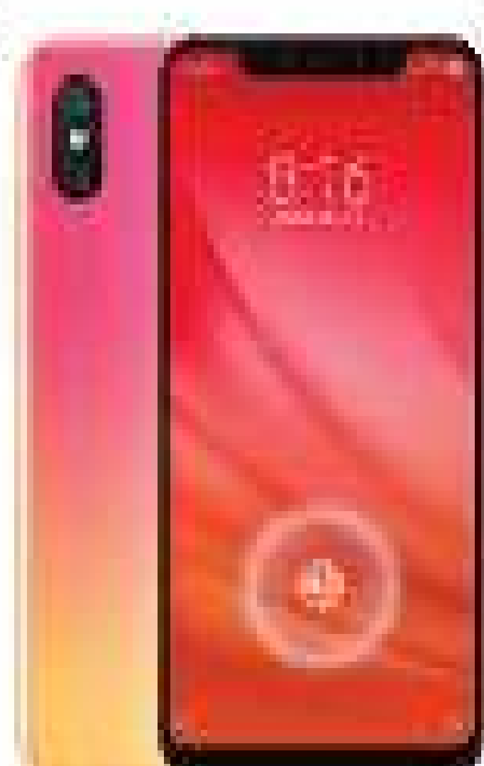
XIAOMI MI 8 PRO