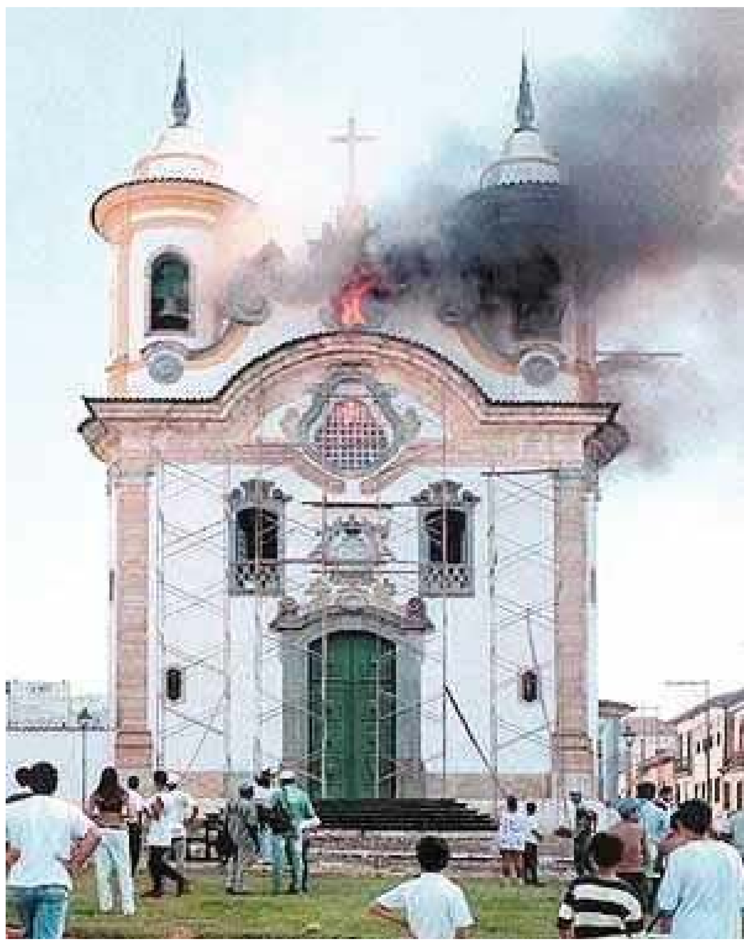
O Santuário de Nossa Senhora do Carmo foi reaberto no dia 27 de janeiro de 2002.

LEMBRANÇA. O templo passava por um processo de retirada dos cupins na época.