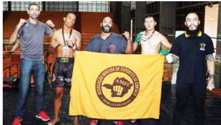
O campeonato foi dividido em categorias por peso, tempo de treino e idade.

A modalidade disputada foi o basquete 3x3, recentemente incluída como um esporte olímpico. Os jogos possuem 10 minutos ou duram até o primeiro time atingir a marca de 21 pontos ou mais. As regras são pensadas para tornar o jogo mais rápido e empolgante. A atmosfera com muita música e cultura urbana ajuda a atrair o público jovem que se fez presente nas disputas. As arquibancadas estavam lotadas e a animação era garantida. O principal objetivo do encontro foi diversificar o esporte e pro-