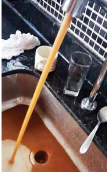
A água estava completamente barrenta e cheia de minério.

IRREGULARIDADE. A água que encontrada nos reservatórios estava completamente barrenta e cheia de minério.