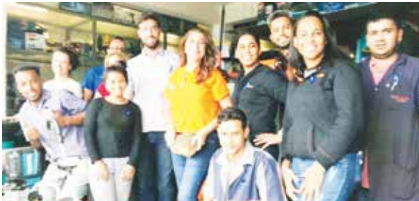
Essa grande equipe é da empresa Murici. Profissionais qualificados para melhor atender seus clientes.