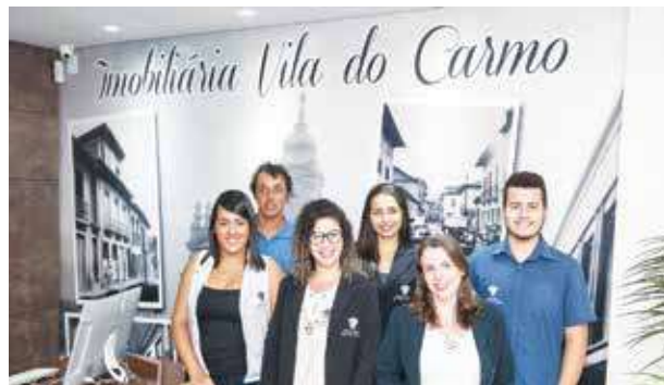
Essa é a equipe da Imobiliária Vila do Carmo sempre pronta para melhor atender vocês. Essa turma é fera demais.