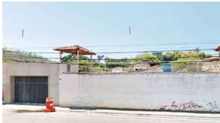
O aparelho foi encontrado em uma cela do Presídio de Mariana.