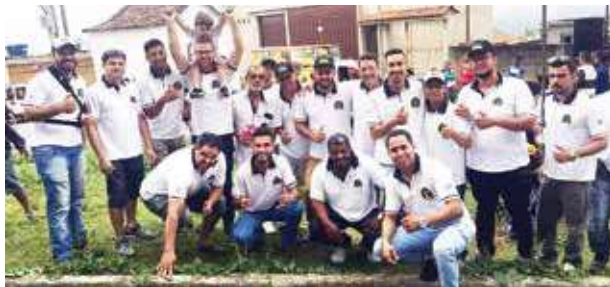
Todo dia 12 de outubro, a Confraria Capim Canela, realiza algumas ações solidárias e neste ano foi realizado novamente nas cidades de Ouro Preto e Mariana as distribuições de balas, pipocas e chips para a criançada. Parabéns pela iniciativa!