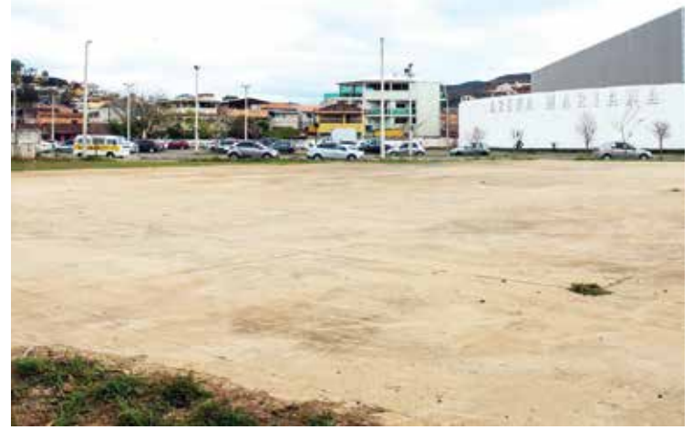
A área da construção faz parte do complexo onde hoje está a Arena Mariana.

A ordem de serviço, segundo o secretário, será assinada no próximo dia 3.