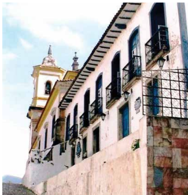
Segundo a assessoria, os restauros terão início após os serviços de reforma.

Os representantes do BNDES comparecerão na cidade no próximo mês para assinatura do termo de convênio e diretrizes para o início das obras. Em relação ao prazo de duração dos restauros, estimam-se aproximadamente dois anos para a conclusão das obras.