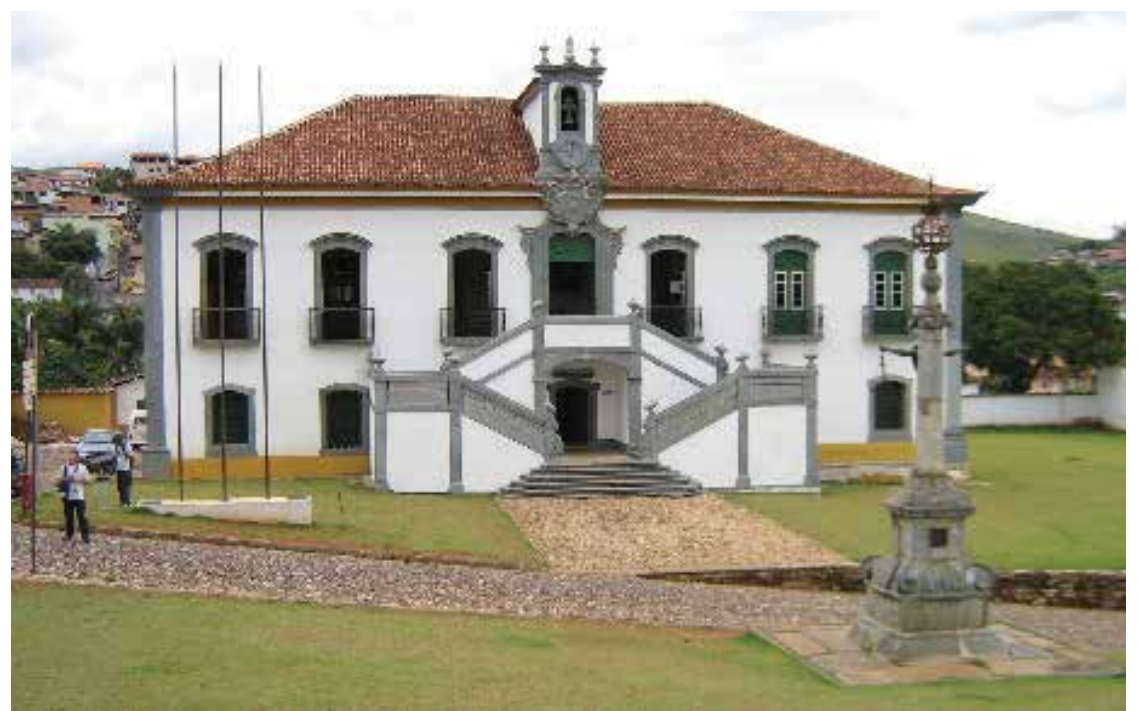
A Câmara Municipal de Mariana diz que não haverá manifestação sobre o assunto.

ESCLARECIMENTO. Viana diz que a Resolução da Câmara de Mariana é ilegal porque estabelece pagamento de valores indevidos a vereadores.