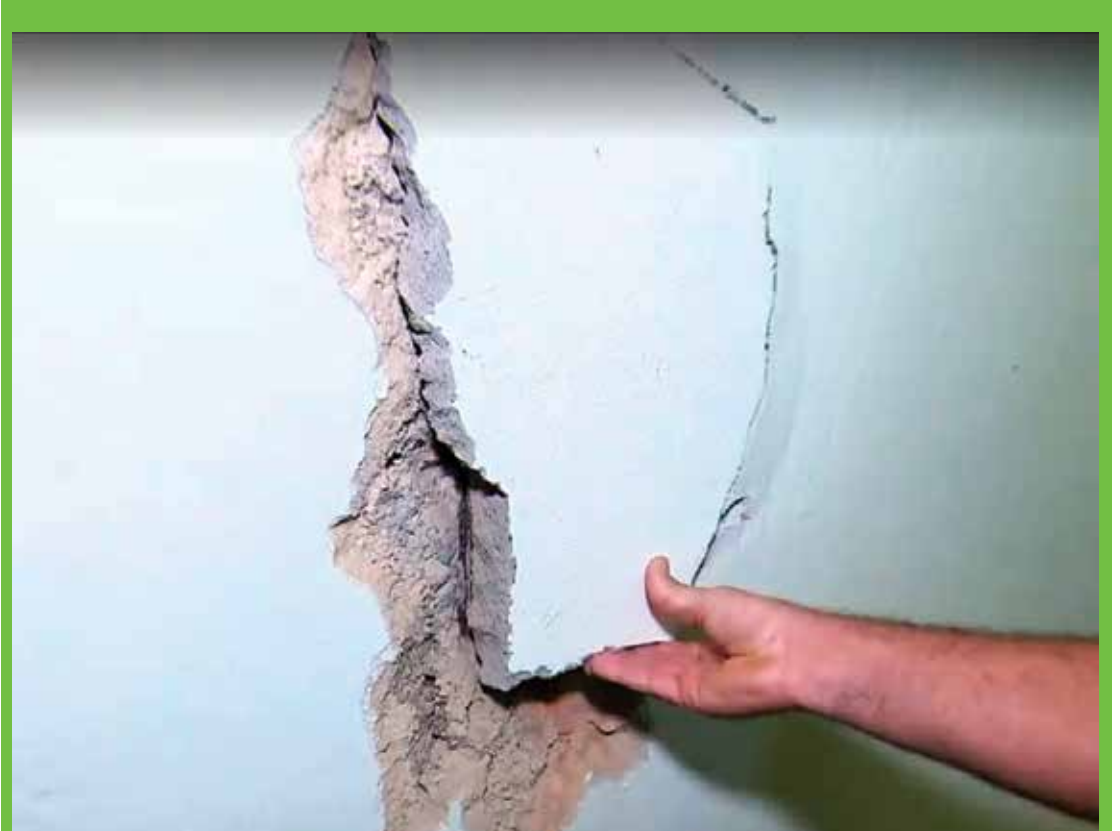
Obras de recuperação deixam rachaduras nas casas de moradores.