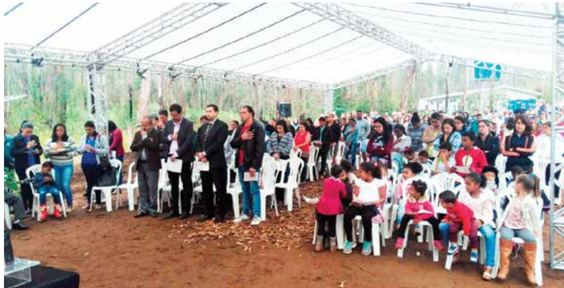
A celebração reuniu famílias de Bento Rodrigues, religiosos e diversas autoridades no terreno da Lavoura.