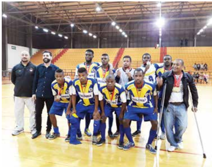
Três distritos de Mariana também participaram do campeonato.