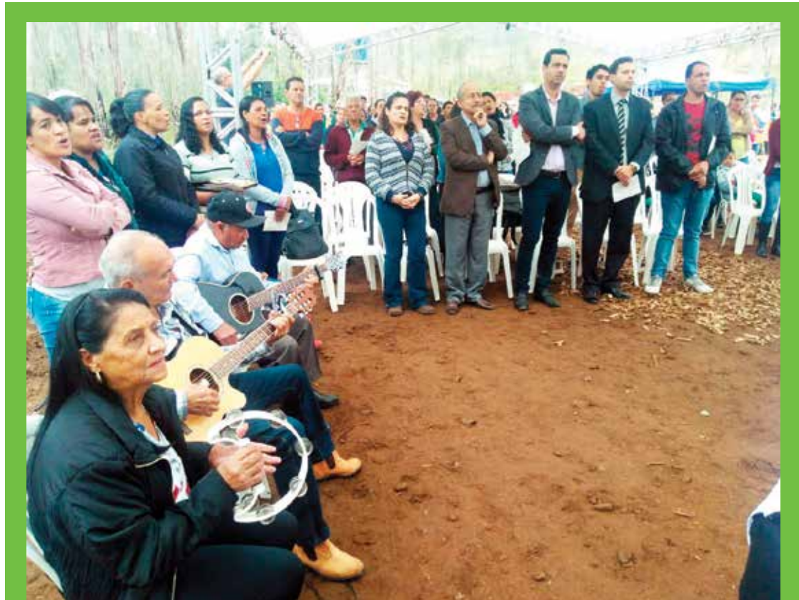
Celebração marca início das obras de Bento Rodrigues