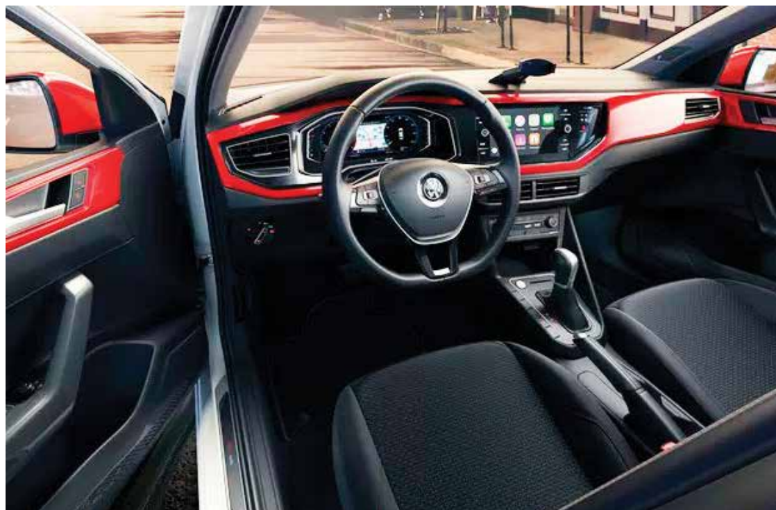
VOLKSWAGEN POLO BEATS.