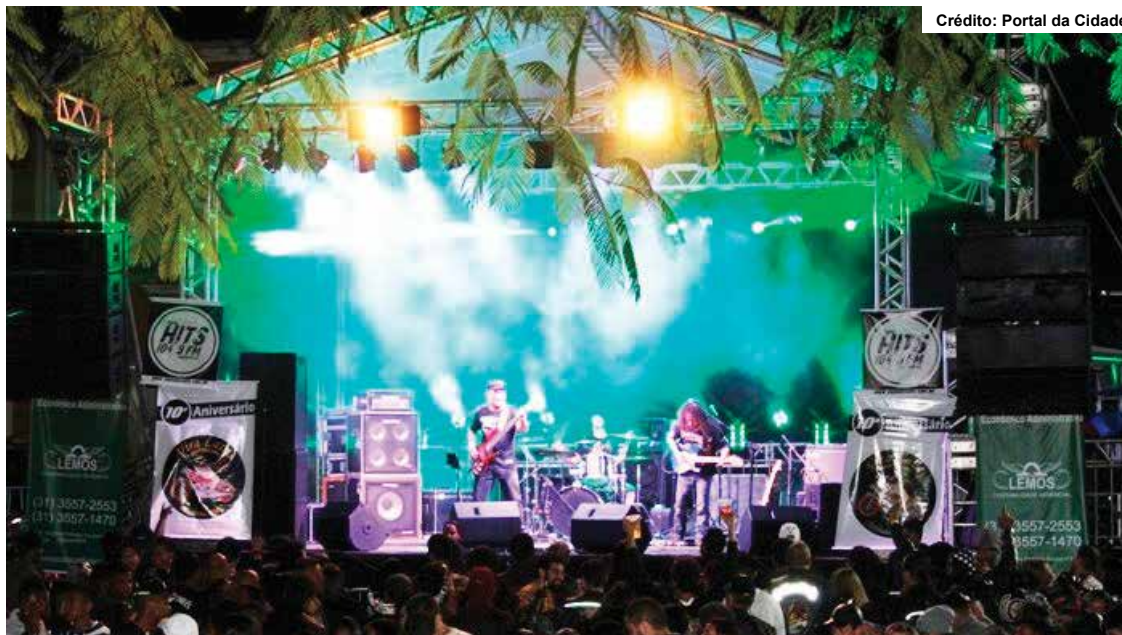
Uma das atrações do Encontro Nacional de Motociclista no ano passado.

PRESENÇA. A expectativa é de que mais de 270 Moto Clubes participem.