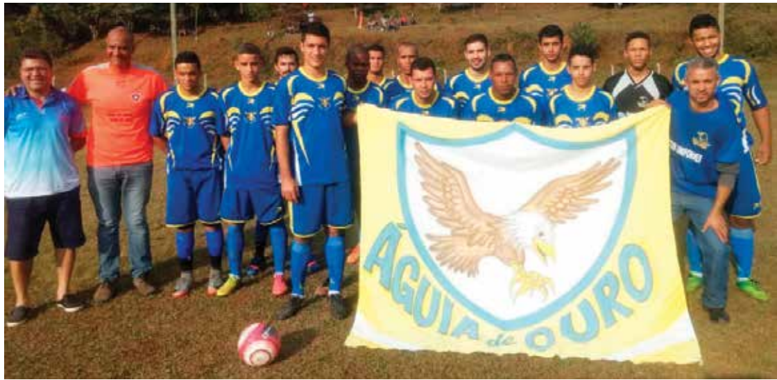
A Copa Sinhá Olímpica contou com a participação de 22 equipes.