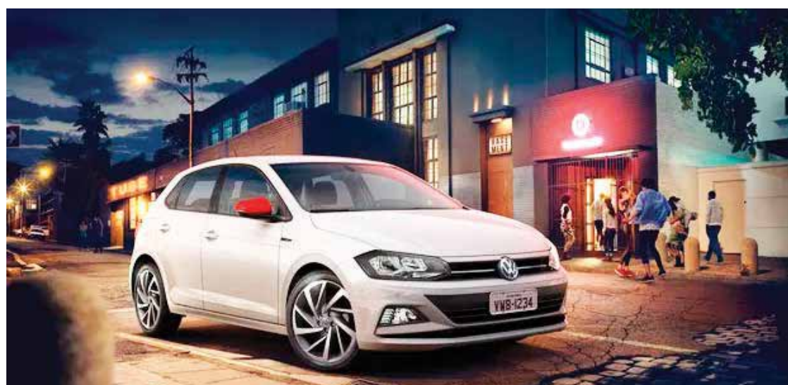
VOLKSWAGEN POLO BEATS.

Confira o valor dos opcionais para cada modelo e versão: - Polo Highline: R$ 2.278 - Polo Comfortline: R$ 2.872 - Virtus Highline: R$ 2.050 - Virtus Comfortline: R$ 2.083