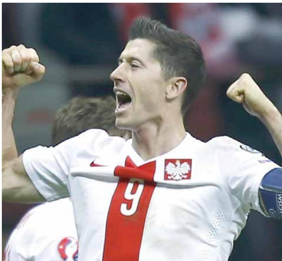
Robert Lewandowski é o destaque da Polônia

Já a Colômbia entrou na última vaga nas eliminatórias sul-americanas. Liderada por James Rodríguez e Falcao García,