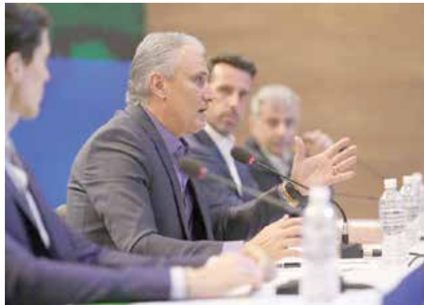
Tite: lista de convocados sem surpresa

para a vaga de Daniel Alves, que está fora da Copa devido a uma lesão do ligamento cruzado anterior do joelho direito sofrida em partida pelo PSG no último dia 8 de maio. Caso alguma lesão tire algum jogador convocado da Copa, Tite já tem uma lista com 12 suplentes, cujos nomes não foram divulgados no último dia 14 de maio. A lista com 35 nomes foi enviada para a Fifa. A delegação brasileira ficará hospedada na cidade de Sochi. A estreia no Mundial será no dia 17 de junho, em Rostov-on-Don. O Brasil entra em campo às 15 horas, horário de Brasília, para enfrentar a Suíça.