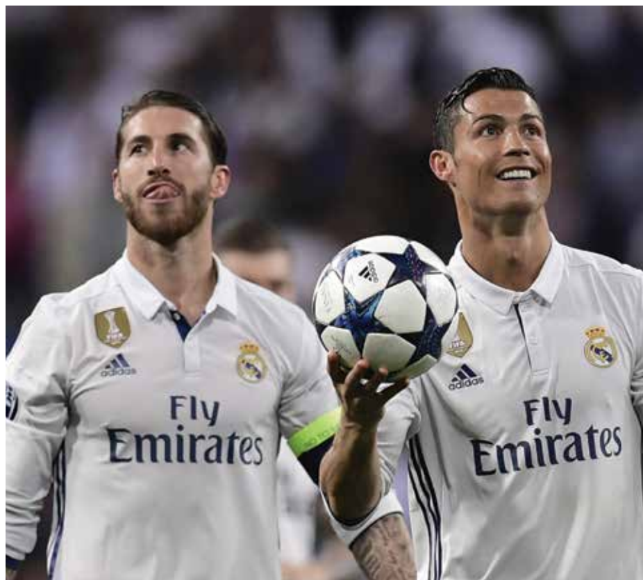
Companheiros no Real Madrid, Sergio Ramos e Cristiano Ronaldo se enfrentarão

O favoritismo para conquistar a Copa começa por uma defesa sólida com destaque para o goleiro