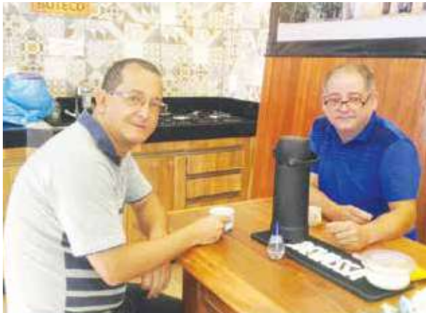
Na quarta-feira, (13), tive o prazer de receber o nosso amigo Baby. Grande conhecedor das questões partidárias, que me deu uma aula sobre as mudanças para as próximas eleições de 2020.