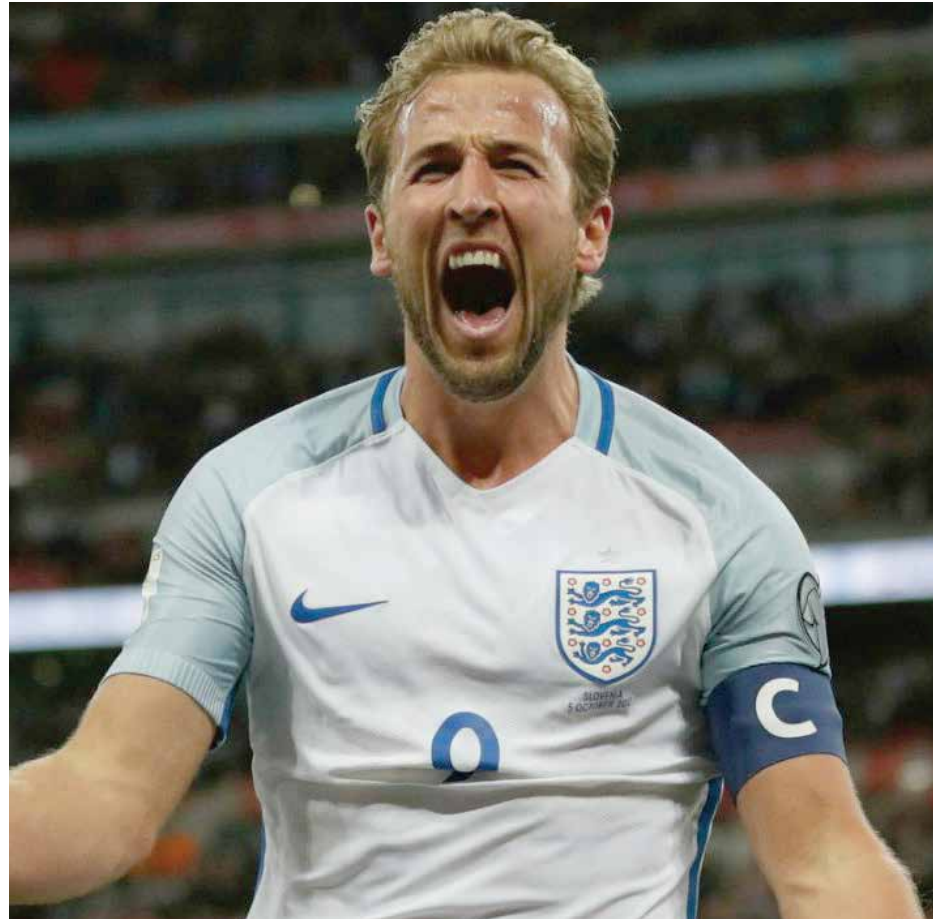
Harry Kane é o destaque da Inglaterra

A Inglaterra conhece bem boa parte dos jogadores belgas, que disputam a Premier League. É os ingleses chegaram na Copa sem dificuldades, invictos, mas isso ficou por conta dos fracos adversários. O técnico Gareth Southgate assumiu o selecionado em 2016, mas até agora não conseguiu fazer o time render a ponto de