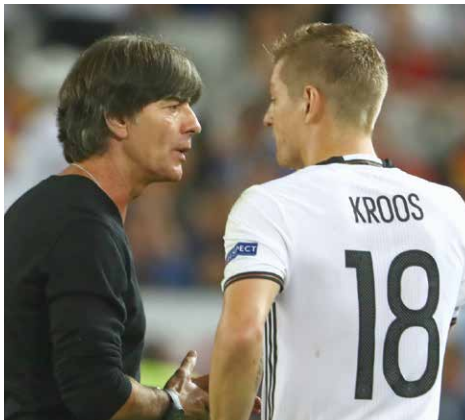
Joachim Löw e Toni Kroos

Se a vaga da Alemanha está garantida, México, Suécia e Coreia do Sul vão duelar para disputar a outra. A Coreia é o grande azarão do grupo, apesar de suas nove participações e um quarto lugar em 2002, quando a Copa foi disputada pela primeira vez em dois países: Coreia