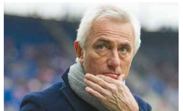
Van Marwijk eliminou o Brasil em 2010

Copa. Van Marwijk, de 65 anos, assumiu a responsabilidade. Ele já treinou Holanda Mundial de 2010, quando eliminou o Brasil de virada por 2 a 1 nas quartas de final. A Holanda acabou sendo vice-campeã, perdendo o título para a Espanha. Marwijk ainda tem no currículo a classificação da Arábia Saudita para esta Copa, encerrando sua seca de 12 anos.