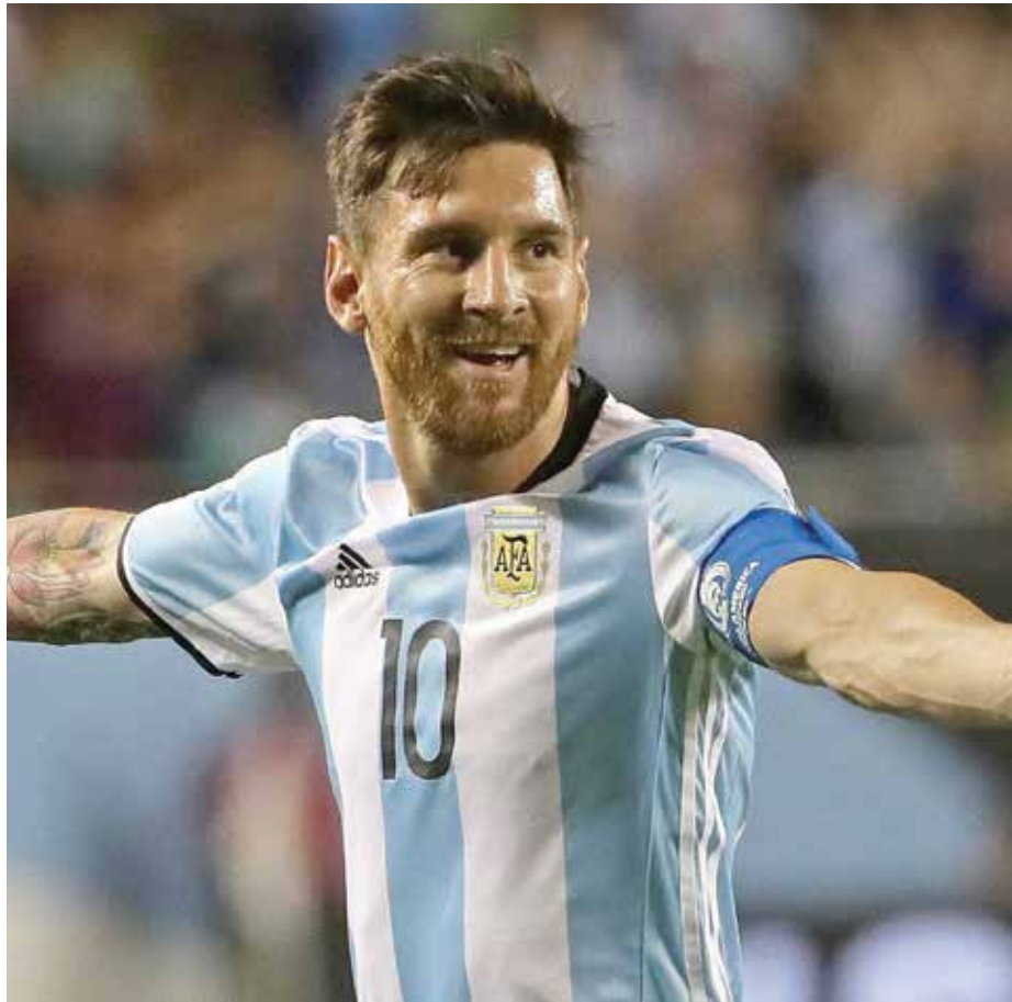
Argentinos esperam que Messi desequilibre

A primeira partida da Argentina será contra a Islândia, país com pouco mais de 300 mil habitantes, que participa de sua primeira Copa. A geração islandesa já havia surpreendido o mundo na Euro-