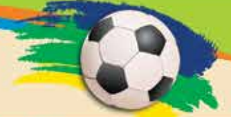
TABELA DE JOGOS