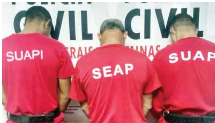
A Equipe conseguiu desvendar a dinâmica criminosa dos autores.

JUSTIÇA. Dos quatro envolvidos no crime, três já foram detidos enquanto um é foragido da polícia.