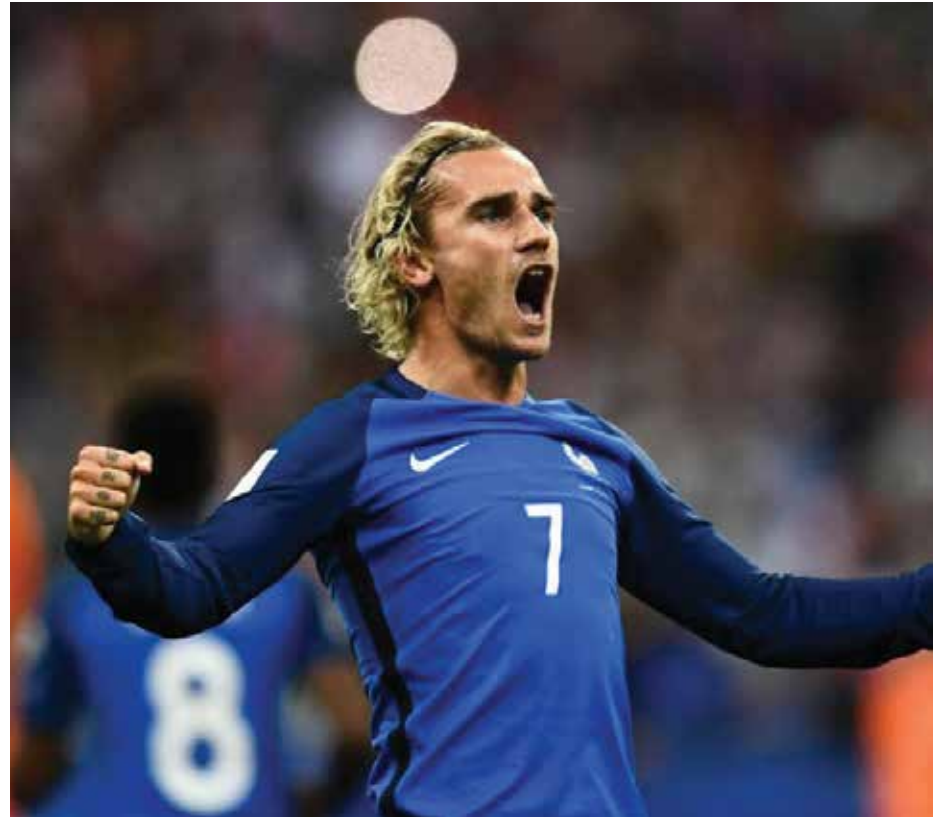
Antoine Griezmann é o destaque da França

Se para a França, a classificação está encaminhada, a segunda vaga para as oitavas promete uma disputa acirrada entre Peru e Dinamarca, apesar da ligeira vantagem dos escandinavos. O Peru foi a última seleção a se classificar para a Copa