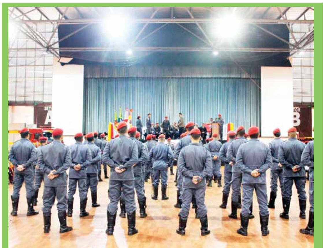
Governo inaugura sede do Corpo de Bombeiros Militar em Mariana