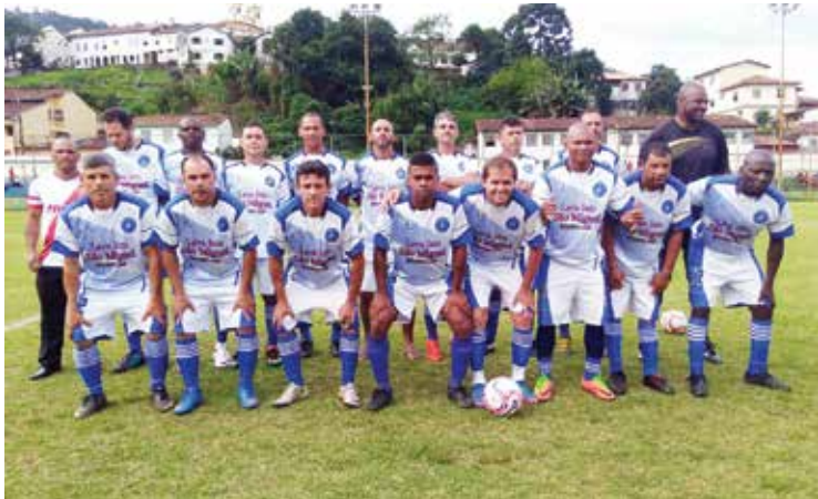
A equipe Santa-ritense venceu a equipe do Independente de Acaiaca pelo placar de 3x0.

Acaiaca e a final, entre Minasfer e Santa-ritense será às 15:15h.