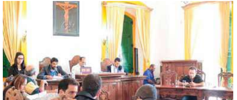
O projeto ainda não entrou em pauta oficial e já gerou um grande debate entre os parlamentares.