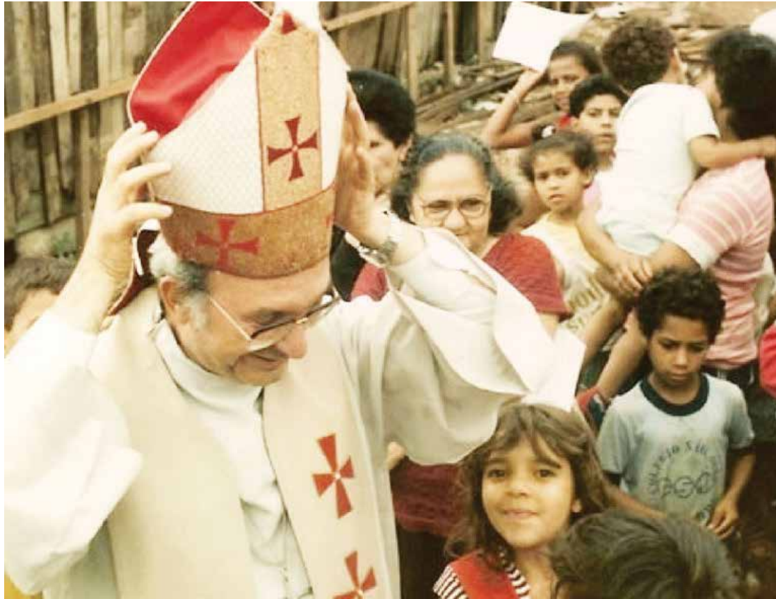
O quarto arcebispo de Mariana, Dom Luciano Pedro Mendes de Almeida, faleceu no dia 27 de agosto de 2006, em São Paulo.

CELEBRAÇÃO. Após 12 anos de sua morte, Dom Luciano terá celebração de encerramento da fase do Processo de Beatificação.