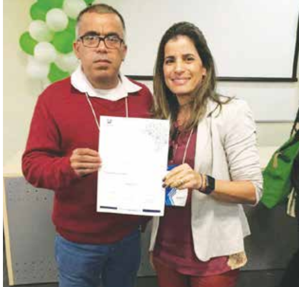
O Polo Unopar Mariana, durante a reunião da Microrregional da Unopar, realizada em BH na última sexta feira, (25), foi um dos homenageados por ter atingido as metas comerciais de Captação e Rematricula no Ciclo 2018.1.