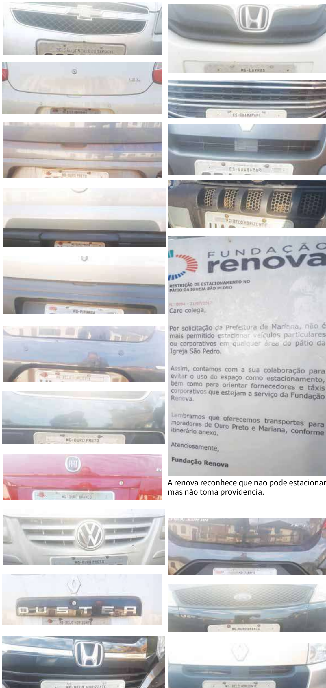
A renova reconhece que não pode estacionar mas não toma providencia.

DENÚNCIA. Patrimônio histórico de Mariana tem visitação prejudicada por uso inadequado de estacionamento.